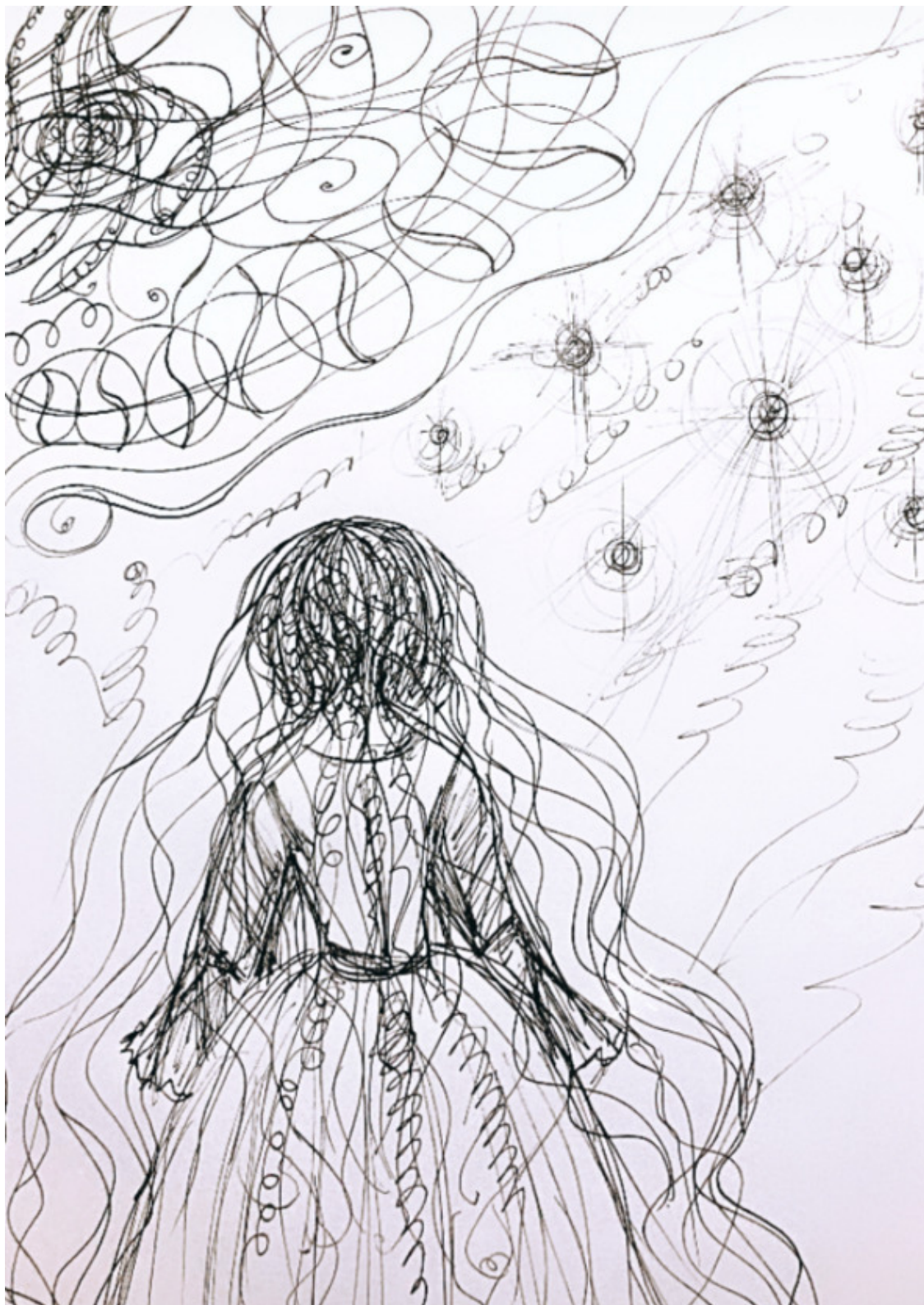
Королевишна и хтонь

ренне свободна, милосердна и щедра. Но если проходишь испытание хтонью, то могут придти подарки от Вселенной.