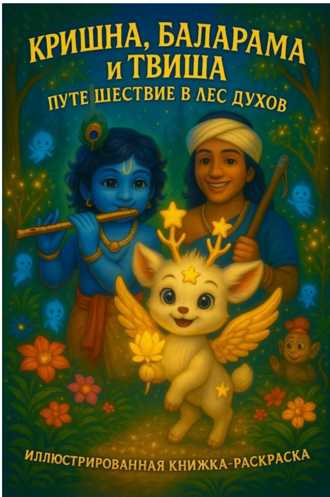
Кришна, Баларама и Твиша. Путешествие в Лес Духов»