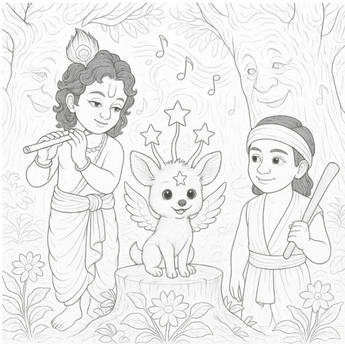
Лес, где живёт песня.