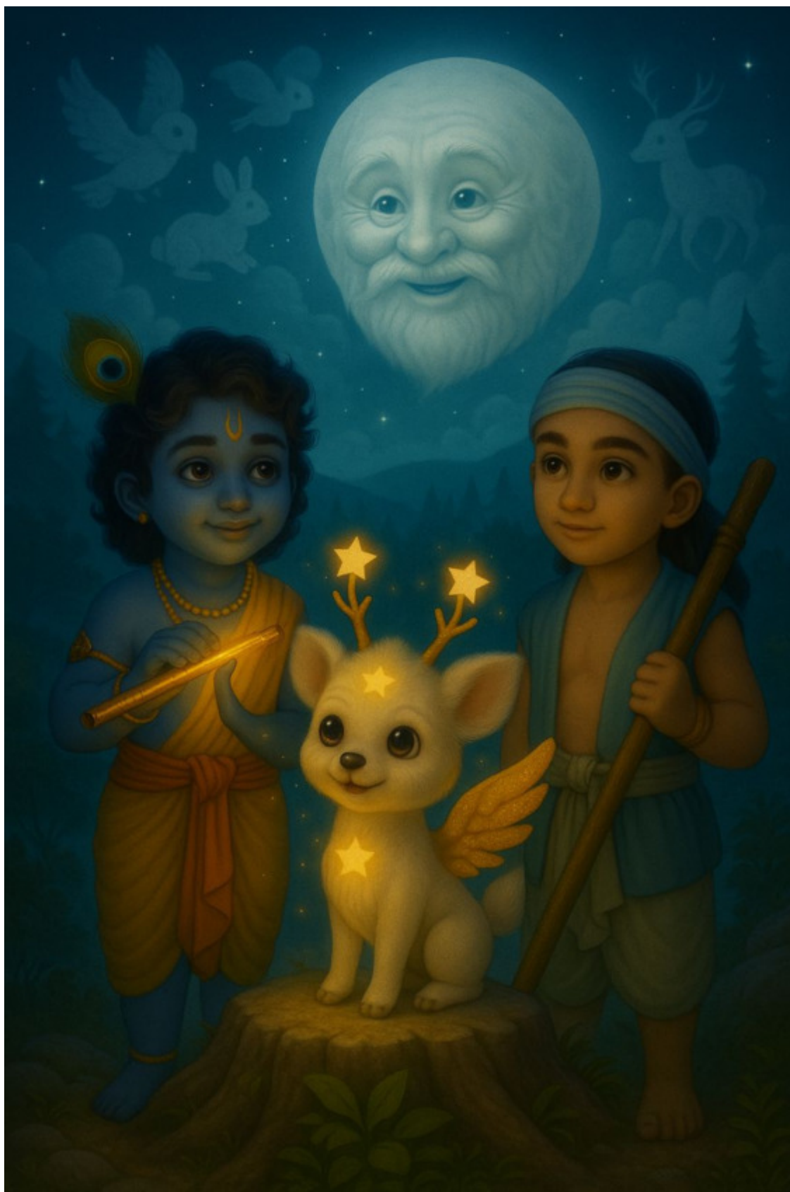
Волшебный камень Желаний.