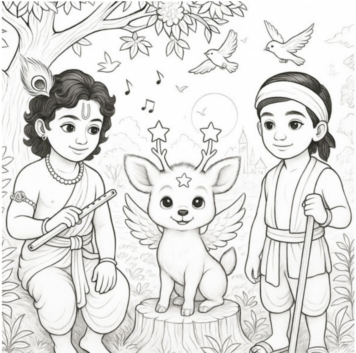
Сказка о Двараке – Городе Морской Звезды.