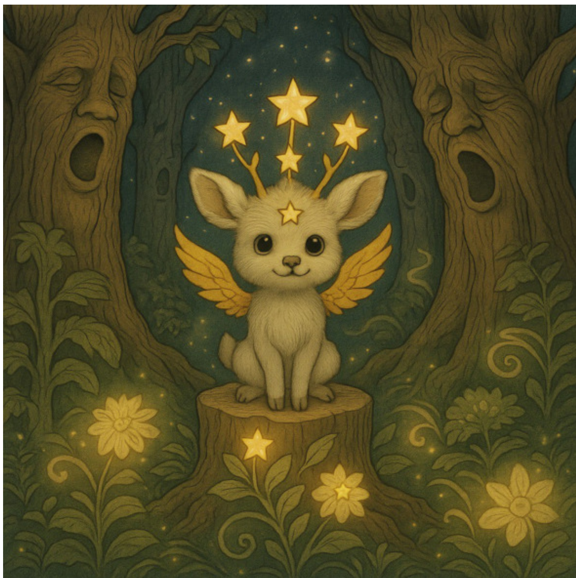
Демон Хлыстун и озеро Страха.