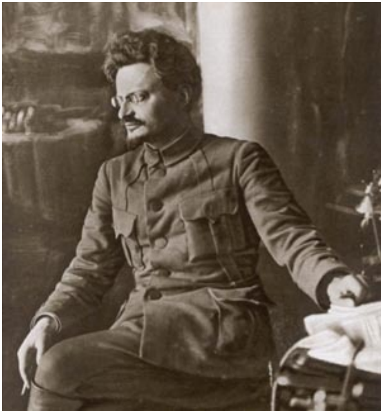
Лев Давидович Троцкий. 1910-е.

Действительно, приготовления к перевороту шли под прикрытием легальных советских органов и выглядели как