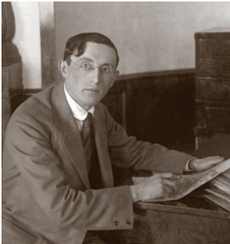
В. Володарский (Моисей Маркович Гольдштейн). 1918.

После победы на выборах большевики решили, что це-