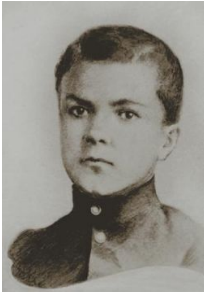
Вячеслав Михайлович Скрябин (Молотов). Начало 1900-х. [РГАСПИ. Ф. 82. Оп. 2. Д. 1598. Л. 7]