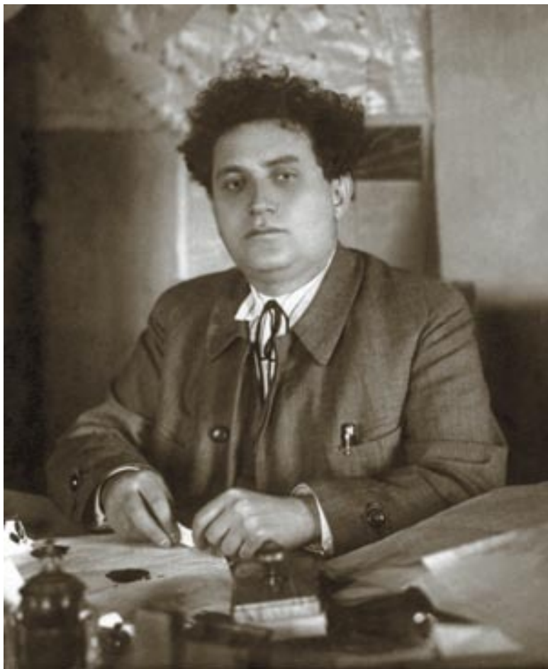
Григорий Евсеевич Зиновьев. 1920-е.