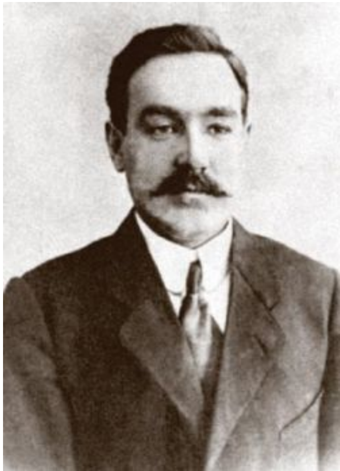
Александр Гаврилович Шляпников. 1910-е.