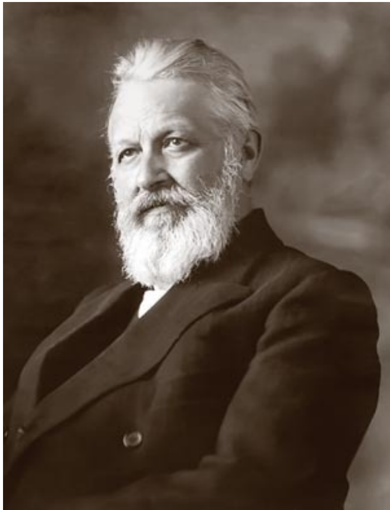
Михаил Степанович Ольминский (Александров). 1910-е.