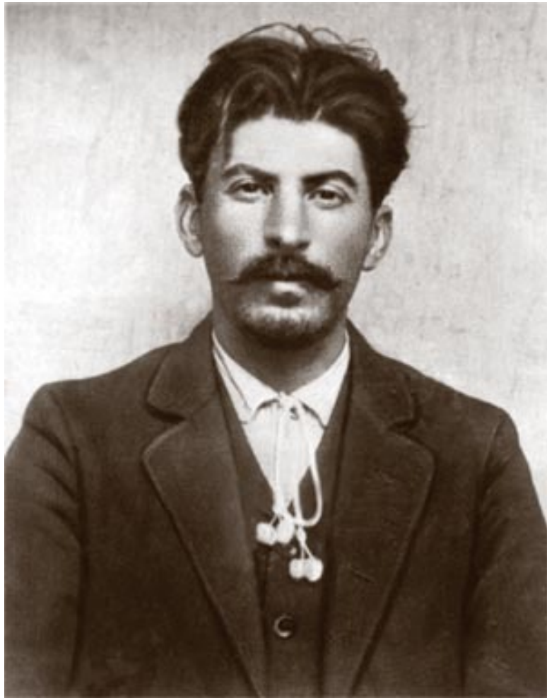
Иосиф Виссарионович Сталин.1911. [РГАСПИ. Ф. 558.