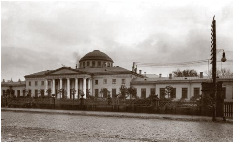
Таврический дворец. 1900-е.

Суханов, вместе с которым Шляпников ушел от Горького, описал свои впечатления от их путешествия по городу, охваченному революцией. Таким же маршрутом затем шли и Молотов с Залуцким, так что, благодаря Суханову, у нас есть возможность посмотреть на те же виды Петрограда, которые наблюдал Молотов в эти судьбоносные для страны часы: «Троицкий мост был свободен, но довольно пустынен. Толпа, густо усеявшая площадь и сквер перед мостом, по-баивалась того оживления, той деятельности, которую проявляла Петропавловская крепость и возившиеся на ее стене около пушек солдаты... Нам встречались автомобили, легковые и грузовики, в которых сидели и стояли солдаты, ра-