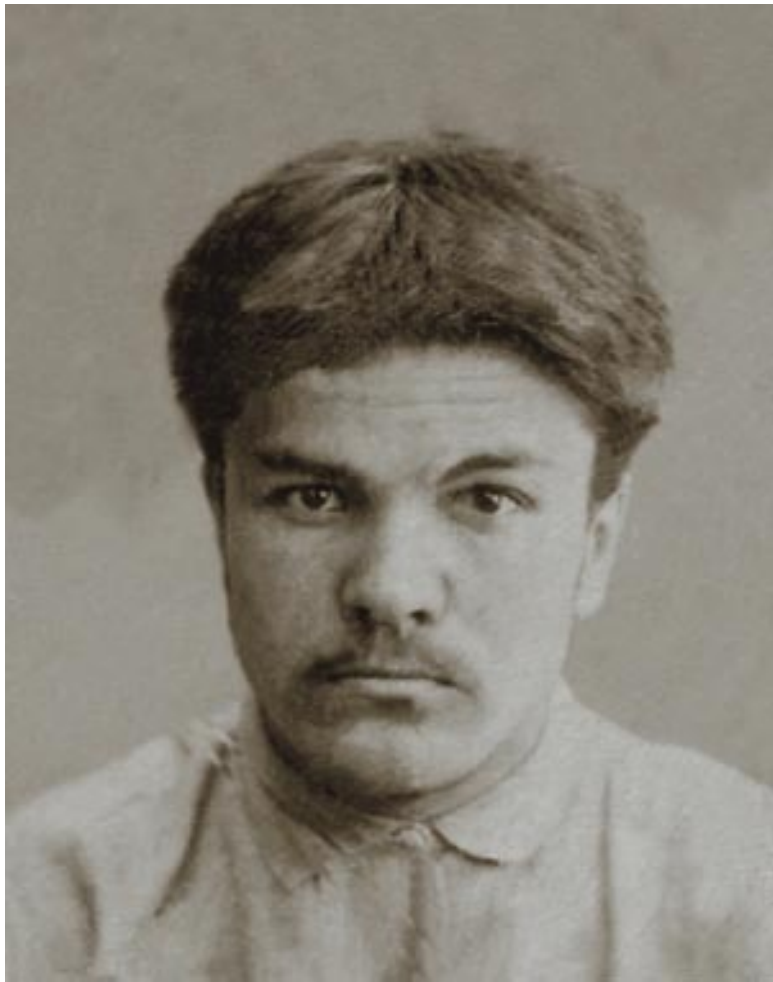
Вячеслав Михайлович Скрябин. Казань. 1907. [РГАСПИ. Ф. 82. Оп. 2. Д. 1598. Л. 1]