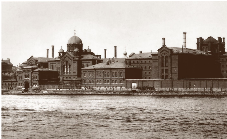
Тюрьма «Кресты». Санкт-Петербург, начало XX в.

тербурга в Императорском техническом обществе арестовали и Луначарского. Он провел несколько дней в Шлиссельбургском участке, а 4 января был переведен в знаменитые петербургские «Кресты» в одиночную камеру. И, как раньше, 24 дня нахождения в тюрьме снова стали для него временем небывалого творческого подъема. Писать никто не мешал, а тюремная библиотека оказалась «вполне приличной». Луначарский задумал создать книгу «Великаны – мученики» о великих деятелях русской культуры и пьесу «Фауст и город». За 8 дней, с 9 по 16 января, Луначарский написал большую стихотворную пьесу в 7 сценах «Королевский брадобрей», которую считал «недурственной вещью».