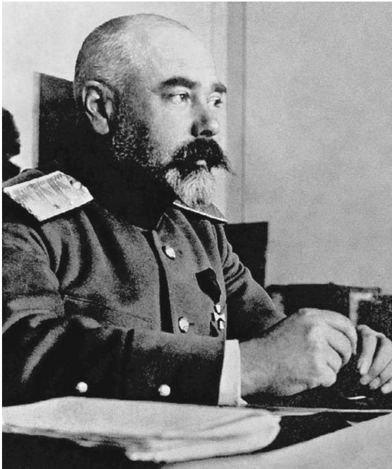
Генерал-лейтенант А. И. Деникин, 1917 год

Крайне тяжёлое положение армии усугублялось ультима-