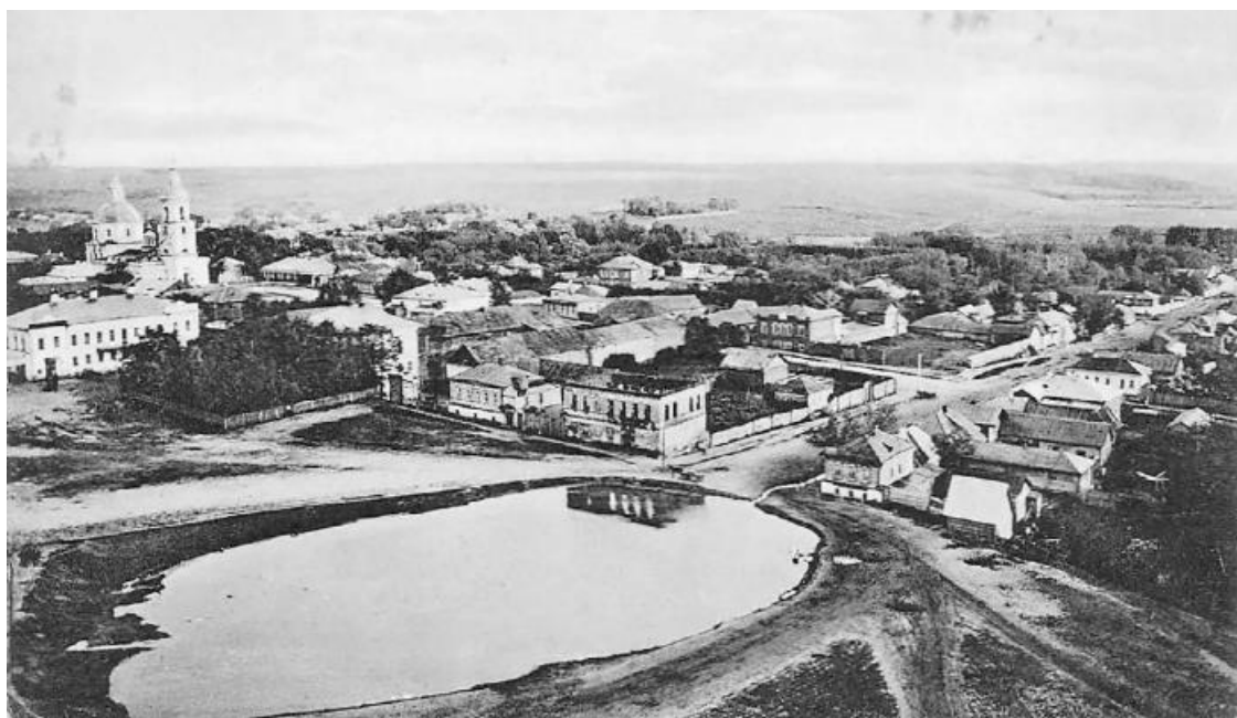
Скопин. Общий вид с северо-запада. Фото начала 20-го века

Две лаконичных строчки о детстве. Возникает вопрос: почему так мало написал? Очень жаль, что мы не можем спросить об этом самого С. С. Бирюзова. Вне всякого сомнения, ему было что рассказать, но, видимо, слишком тяжелы были те детские воспоминания. Я посчитал своим долгом разобраться, насколько это возможно, в бытовых условиях и жизненных обстоятельствах, в которых проходило детство Сергея Бирюзова.