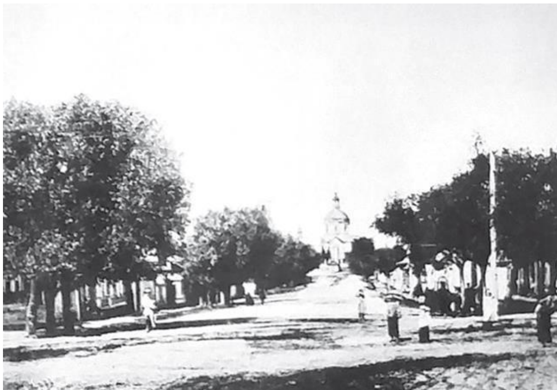
Рязанская улица. Скопин. Начало 20 века