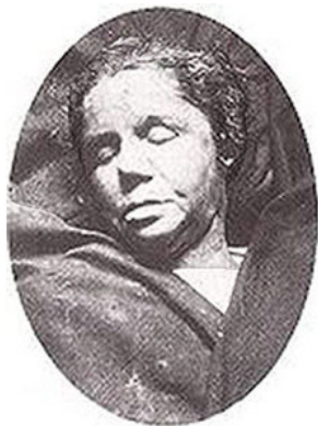
Фотография тела Элис Маккензи.

Проходил месяц за месяцем, и спокойствие как будто бы стало возвращаться в Уайтчепел. Но в июле 1889 г. произошло новое зверское убийство проститутки. Элис Маккензи получила удар ножом в сонную артерию, после чего живот женщины был безжалостно истыкан тем же ножом.