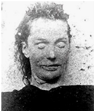
Посмертная фотография Элизабет Страйд.