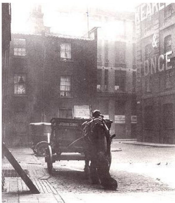
Площадь Майтр-сквеар. Фотография 1925 г. поэтому на заднем плане виден автомобиль.

В то самое время, пока на Бернер-стрит напряжённо работали полицейские и врачи, совсем неподалёку – буквально в 400 метрах – констебль Эдвард Уоткинс патрулировал площадь Майтр-сквеар и прилегающие к ней улицы. Это было тихое убогое местечко, где практически не было жилых домов – только склады и магазины. Констебль миновал Майтр-сквеар в 01:30 ночи, и в это время там было всё спокойно. Площадь была невелика – квадрат со стороной 22 метра – и потому не заметить что-либо подозрительное там было просто невозможно. Уоткинс спокойно пересёк площадь и двинулся по одной из примыкавших к ней улочек. На площадь Майтр-сквеар он вернулся менее чем через четверть часа. В 01:44 он обнаружил прямо на площади окровавленное тело женщины, лежавшее на спине.