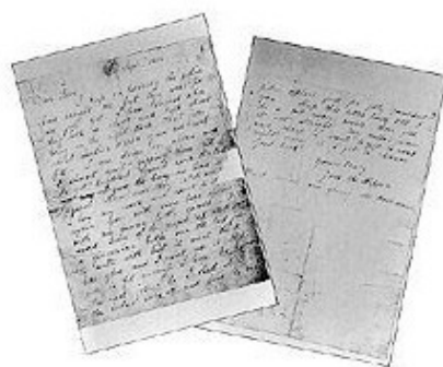
Фотографии писем, подписанных «Джек-потрошитель».

Оба письма из «Central news office» были переданы в полицию, которая взялась за розыски анонима. Были изготовлены фотокопии обоих посланий, которые поступили во все полицейские участки страны. Власти надеялись, что кто-либо сможет опознать почерк писавшего. Идея эта оказалась отнюдь не так наивна, как можно было бы подумать; во всяком случае, аноним более никого не беспокоил. Увидев собственную писанину в полицейском участке, он, скорее всего, перепугался и затаился. Хотя автора клички «Джек-потрошитель» так никогда и не нашли, это прозвище закрепилось за «убийцей из Уайтчепела», сделавшись своего рода его легальным именем.