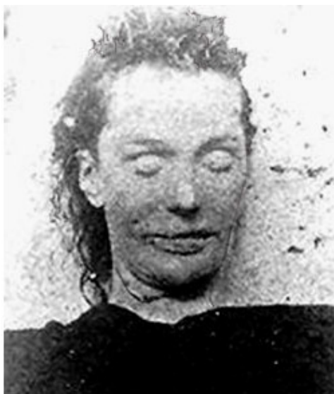
Посмертная фотография Элизабет Страйд.