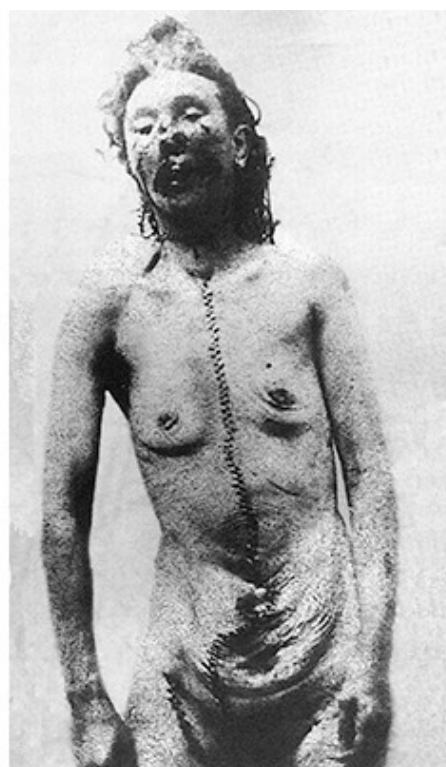
Посмертные фотографии Кэтерин Эддоус.