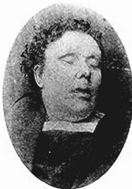
посмертная фотография Энни Чэпмен.

Десятки полицейских были брошены на опрос жителей Уайтчепела. Им была поставлена задача отыскать свидетелей, которые могли видеть человека в окровавленной одежде на Хен-бари-стрит.