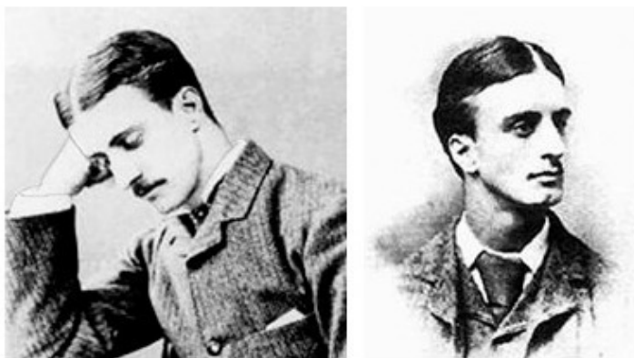
Фотографии Монтагью Джона Друитта, сделанные в разное время.

Наиболее серьёзным кандидатом в преступники начальник полиции метрополии называл некоего Монтагью Джона Друитта.