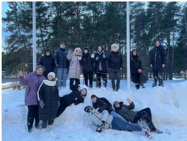
Гулянки Студенческим Советом в 2022г.