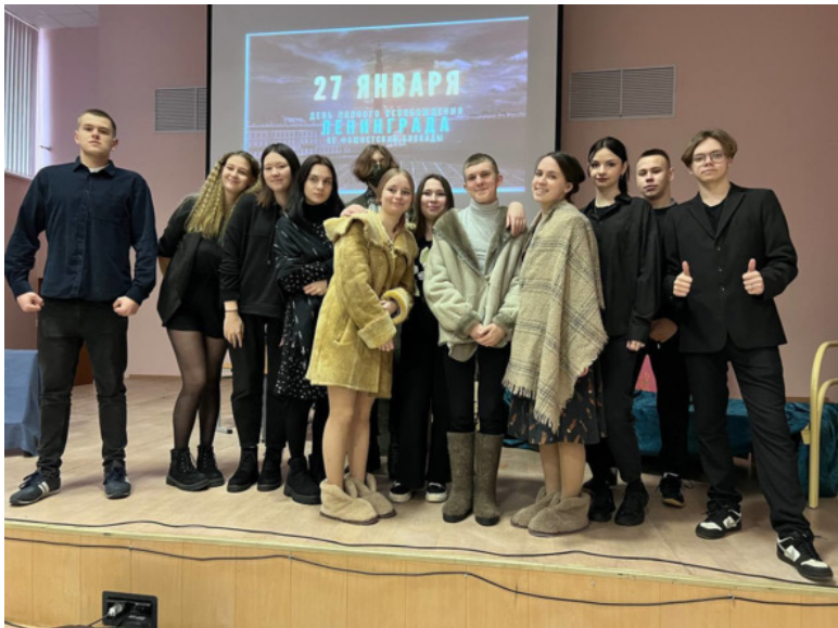
Спектакль ко Дню Снятия Блокады 2024г.