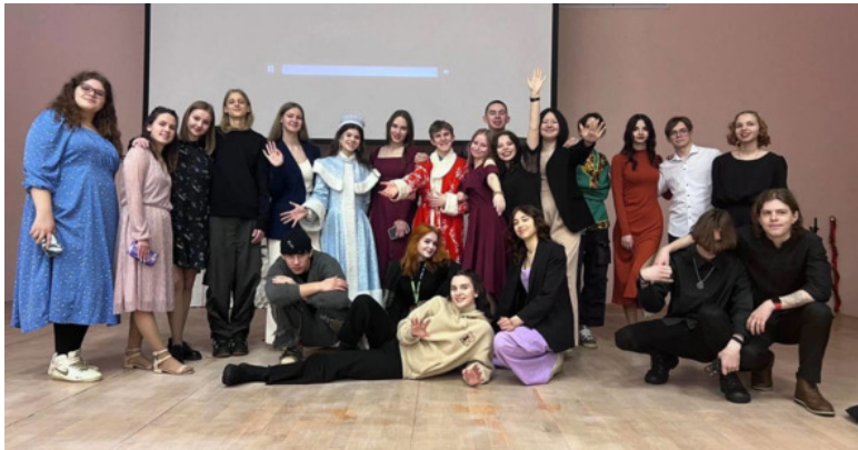
Новогодний концерт 2024г.