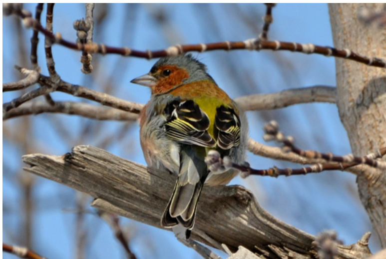
Зяблик из лесополосы

цы хоть и пытались спрятаться в переплетении веток, но внимательному взору нет-нет да и открывались их простенькие убежища, а место следующей после перелёта посадки было видно издали. В стайке получилось заснять овсянку, щегла, но основными моделями стали зяблики.