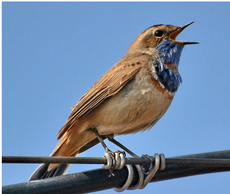
Солист садового хора

И здесь же сидела крошечная, чуть мельче воробья, пичуга с синим пятнышком на груди, готовилась к броску за добычей. Мгновение – и она уже на соседней веточке, а в клюве завтрак – на лету схваченное поперёк туловища большое, кажется, шире птичьей головы насекомое, которое птаха очень ловко, одним только клювом, в несколько приёмов перехватывала и глотала. Затем снова готовилась к прыжку.