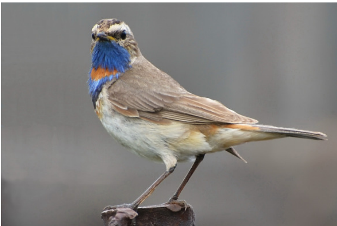
Сразу видно, кто в доме хозяин

Мне повезло: оказалось, что мой первый квартирант практиковался в самых престижных птичьих ансамблях. Много самцов-варакушек видел мой сад, но того, первенца, никто впоследствии не перепел. Поёт у варакушек только самец – страстно, не жалея голоса, словно пробуя на вкус прозрачный, полный любви воздух.