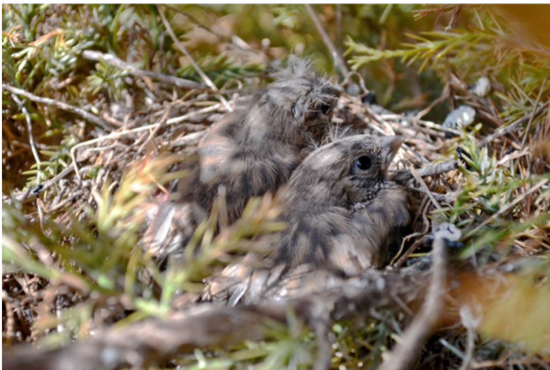
Последняя минутка в родимом гнезде

Вынув из кустов отслужившее гнездо коноплянок и попробовав разделить его надвое, я удивился, как крепко оно сплетено. Казалось бы, обычные травянистые стебли должны были легко расплзтись, но не тут-то было, пришлось приложить значительное усилие. Плетение выполнено с подвохом: стебли скреплены паутиной (я-то ничего не разглядел, так утверждают специалисты), но мне кажется, должны быть какие-то скрытые узелки, которые при растяжении затягиваются, очень уж плотная получилась вязка, да и попробуйте найти паутину в апреле, когда закладываются первые в сезоне гнёзда. Снаружи травы грубые, внутри – тонкие, лоток выстлан мягкими материалами. Сложное, с инженерной точки зрения интересное сооружение.