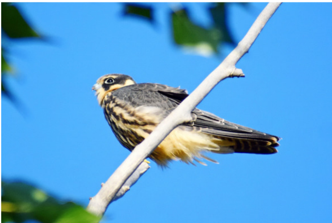
Совсем молодой соколик

Через день решил снова наведаться к тополю, проверить соколов. К взрослым птицам добавились окрепшие слётки, над лесопосадкой кружила уже целая соколиная стая. Никакой агрессии не было, чеглоки спокойно летали надо мной, позировали на ветках деревьев, особенно старались молодые, иногда даже демонстрировали групповые полёты. Фотографий получилось больше, чем в предыдущий съёмочный день. Вечером я перебирал, сортировал снимки и вдруг подумал о жаворонках, вспомнил, что ни одного из них за эти два дня мне не встретилось. На следующее утро полетел на жаворонковое поле проверить свои опасения. Любимых моих певцов не было... Чеглок – самый быстрый из соколов, такой же, как сапсан; охотится на лету, предпочитает некрупных птиц – скворцов, жаворонков, даже самая стремительная мелочь (ласточки и стрижи) не может спастись от этого хищника. Оставалось надеяться, что кто-то из пернатых артистов схоронился на соседних полях, в лесопосадках, хотя ясно было, что далеко не многие. Расстроился я, да ничего не поделаешь, дикая природа живёт по своим законам. Три года после этой трагедии по весне заезжал я на жаворонковое поле, но никого из них не нашёл. Крепко запомнили птицы суровый чеглочий урок.