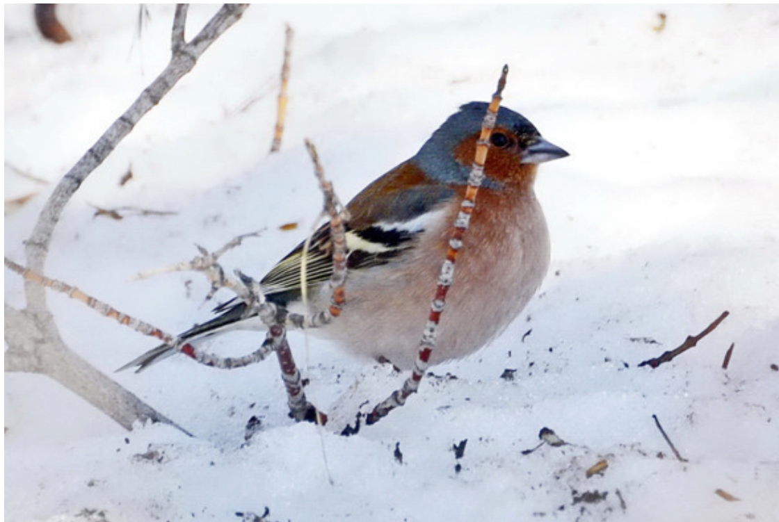
Зяблик на снегу

далеко. Птицы явно устали с дороги, перелетали от меня неохотно, недалеко и сразу в изнеможении ложились животом на толстые, раскинутые параллельно земле ветви. Наконец, плюнули на свою стайную систему безопасности, успокоились, стали допускать меня на приличный фотовыстрел.