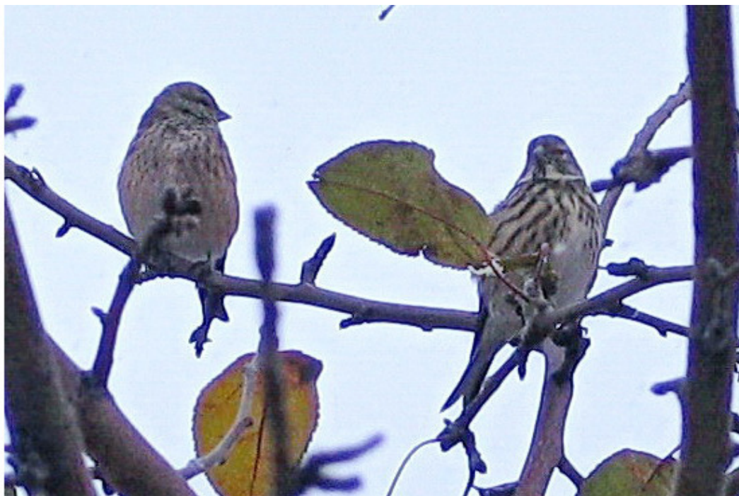
Прощальное фото коноплянок

Было очевидно, что это последнее фото, подкараулить ставших подвижными коноплянок, а тем более приблизиться для съёмки на расстояние в три метра больше не получится. Так же, как в случае с варакушкой, мне чудесным образом было подарено и это последнее, прощальное свидание.