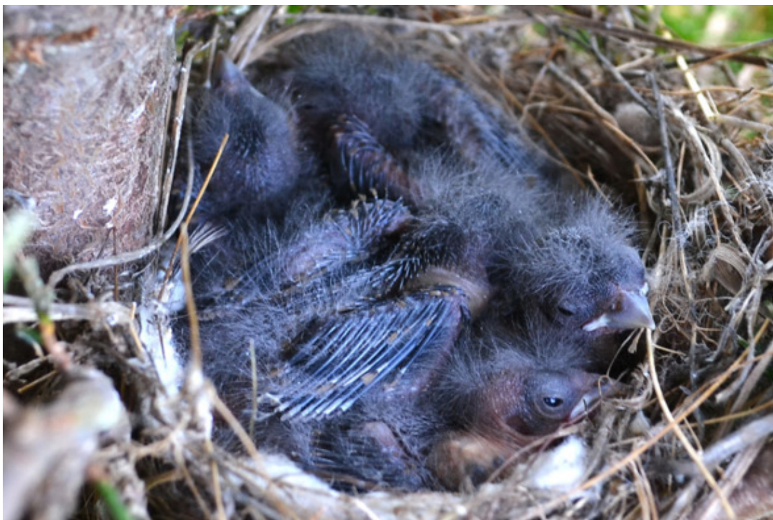
Уже не «гуманоиды»

Третий снимок со слётками вполне оправдывает своё сентиментальное название «Последняя минутка в родимом гнезде». Всё произошло в разросшемся кусте пирамидального можжевельника. Я выследил птичье убежище, но с фотографией на долгую память не спешил, поджидая, когда птенцы оперятся. Когда, наконец, собрался, то, раздвинув колючие ветви, увидел гнёздышко, а в нём двух насторожившихся птенцов. Оказывается, шёл выход из гнезда подросших птичек, и, к моему счастью, в гнезде задержались двое последних его обитателей – оперённых, но не обретших решительность для встречи с неизвестностью загнездового мира. Несколько снимков успели запечатлеться в памяти камеры, после чего один из птенцов решил, что он уже совершил всё возможное в интересах моей фотогалереи молодых пернатых, что дальше терпеть щелчки камеры просто невыносимо. Взлетел и удрал в соседский вишарник. Второй предпочёл затаиваться. Я покинул съёмочную площадку, а вернувшись на следующий день, застал уже только пустую плетёную чашечку. Очередное поколение реполовов вышло в свет.