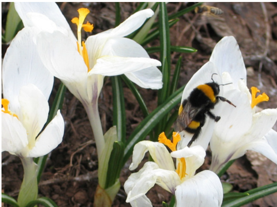
Шафран (крокус) весенний

Кажется, за один только вчерашний день выскочили из земли и опушились тоненькими листьями-иглочками побеги адониса весеннего, и уже крошечная, похожая на ёлочку кочка сплошь покрылась, загорелась золотистыми ромашковыми солнышками. За то и называется в народе горицветом. Адонис приехал в сад из цветущей оренбургской степи. Когда-то я его аккуратно, с земляным комом, вырыл на каменистом косогоре, посадил в саду, и теперь он благодарно преподносит мне удивительно длительное цветение.