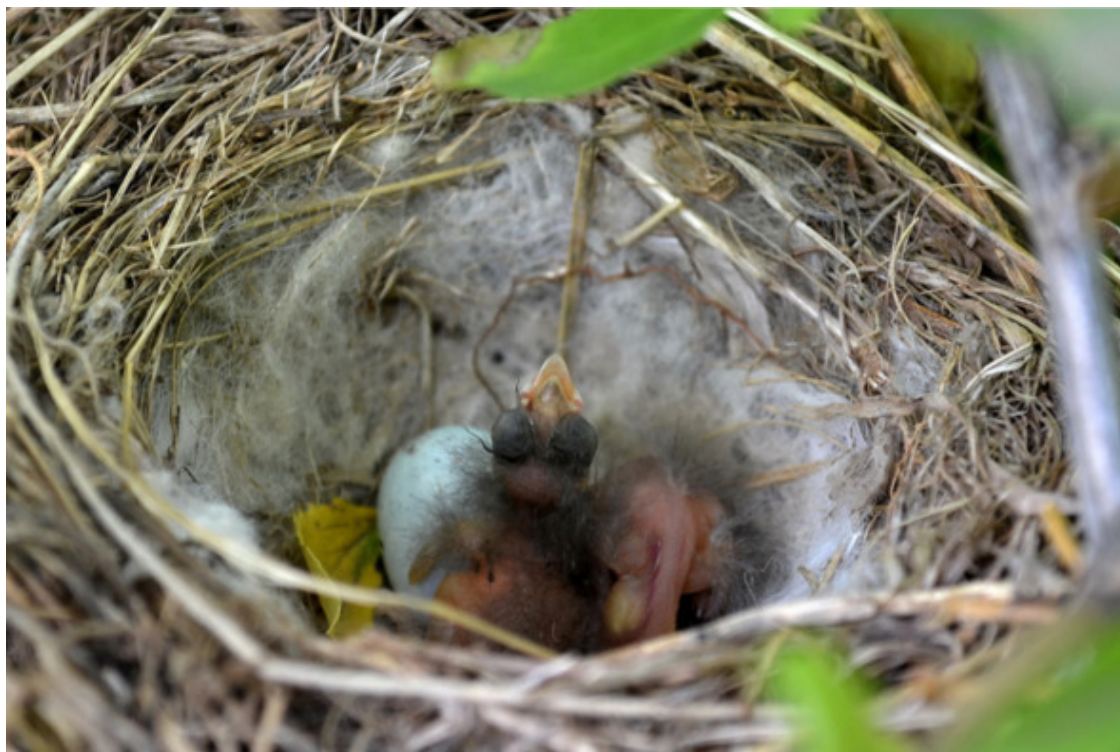
«Тройняшки» в гнезде коноплянок

Выждав, когда очередная птаха, покормив потомство, вылетела из барбарисового убежища, я заглянул в гнездо, которое мне показалось чистеньким и уютным. Лоток заботливо выстлан толстым слоем мягкого пуха. На белой подстилке лежали два существа с огромными глазами (показалось, что это типичные гуманоиды) и одно голубоватое «космическое» яичко. Это всё, на что хватило последних августовских птичьих силёнок. Обычная норма – ближе к шести. На отдельных участках юного тела росли неряшливые пучки сероватого пуха. Вели себя гости родимой планеты вполне по-земному: на мой лёгкий свист с готовностью раскрывали жёлтые прожорливые клювики, думая, что это мамочка принесла вкусненькие семена одуванчика или сурепки. Они ещё не научились различать свист фотографа и призывный зов настоящих кормильцев, но совсем скоро при малейшей опасности будут затаиваться, изображая совершенно неживых гуманоидов.