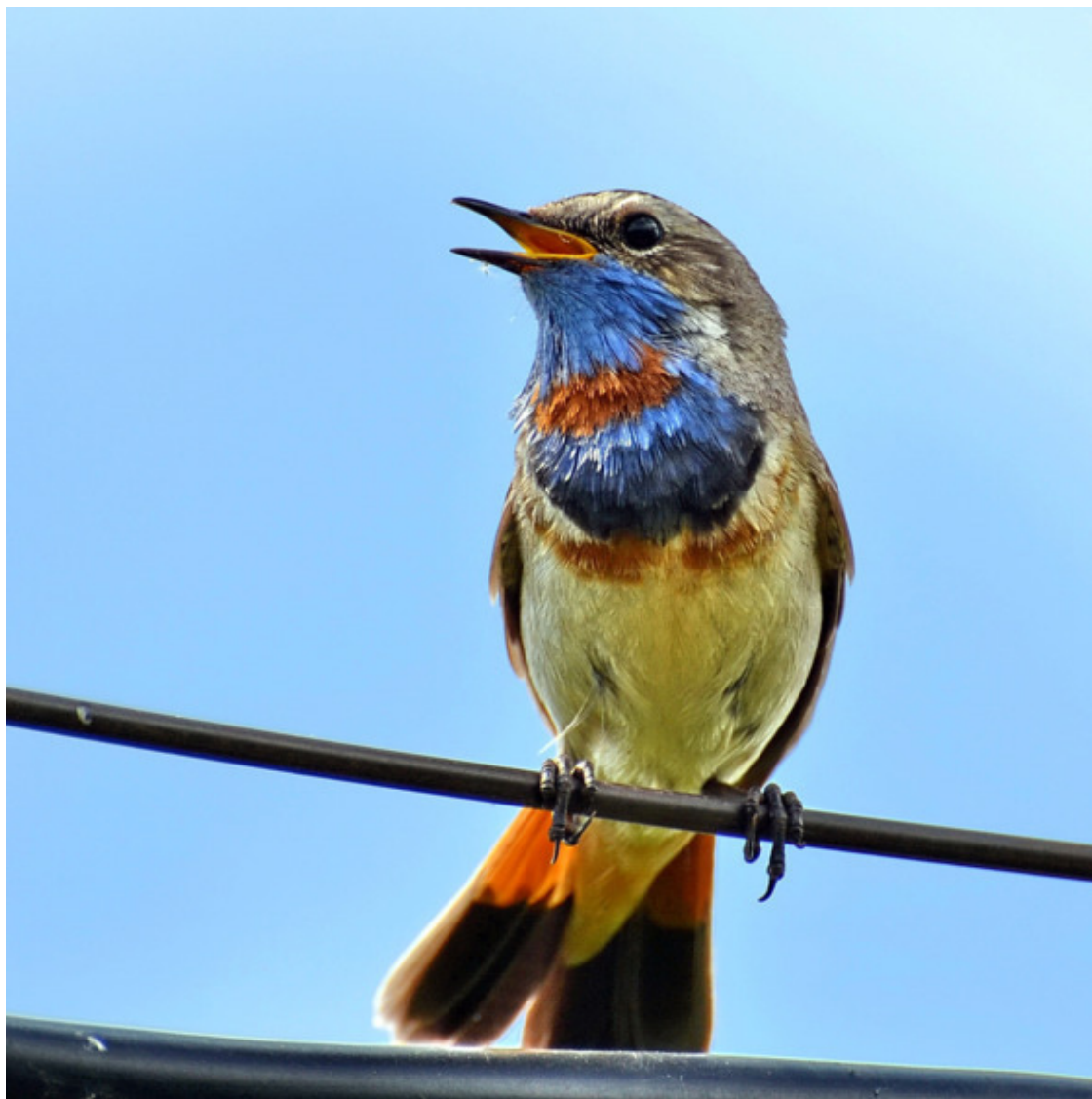
Самый красивый из соловьёв

Ягоды уже давно начали зреть, первые даже перестояли, набухли, проявился лёгкий аромат малиновой закваски для домашнего вина, которого я в былые годы ставил немало. У меня слабость к свежей малине, люблю есть не по одной яголке: набираю пригоршню и отправляю её в рот, дабы ни один вкусовой рецептор не остался не затопленным малиновым цунами. Я так увлёкся поеданием ягод, что забыл о варакушке.