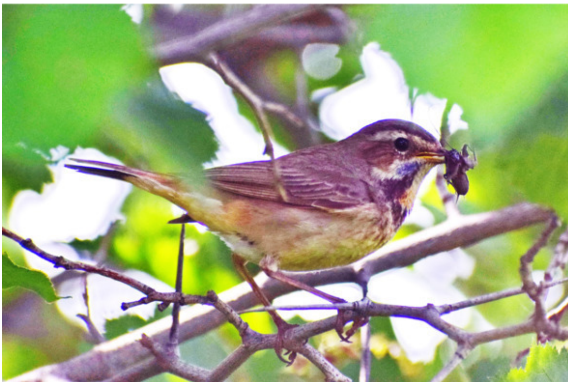
Ответственная хранительница очага

Гнездятся варакушки обычно в одном и том же месте, и я подозреваю, что ко мне прилетают одни и те же птицы, особенно крепка эта догадка по отношению к самке. У нас сложился некий трогательный ритуал: обычно непубличная, она каждую весну и каждую осень приходит ко мне как бы на официальный приём, подлетает совсем близко, неспешно прогуливается на открытом пространстве подле меня, фотографируется, свидетельствует своё весеннее прибытие или сообщает о скором отлёте на зимовку.