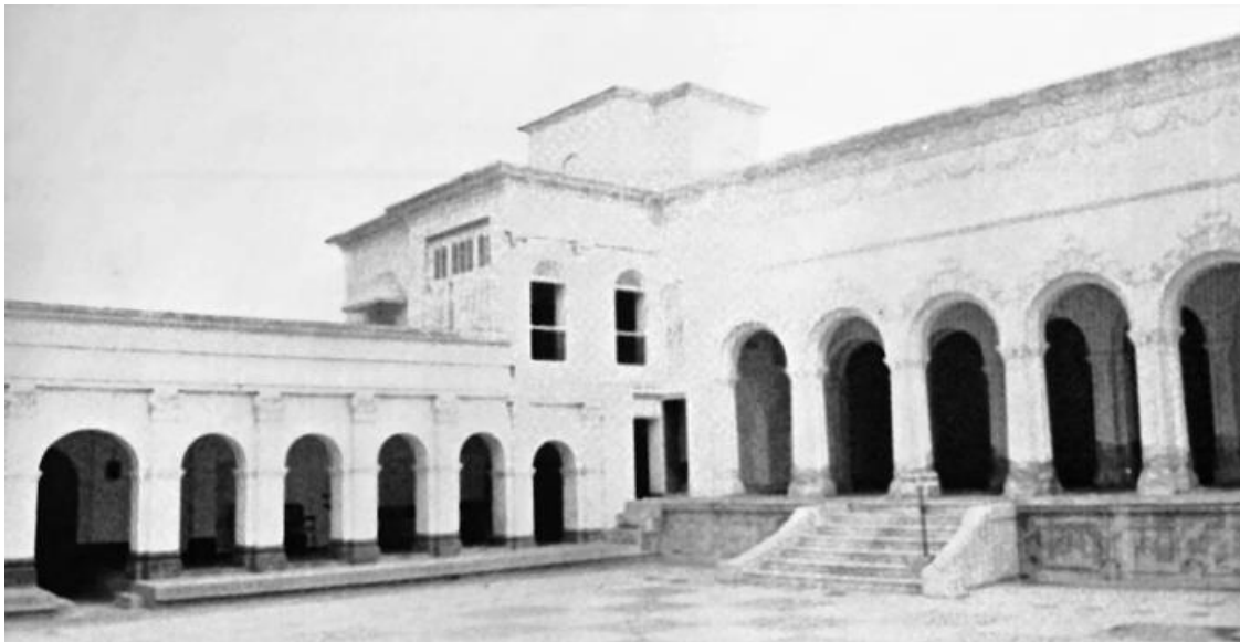
Дом предков Свами Вивекананды, Калькутта

Я играл со своим конюхом: мы изображали вайраги, посыпанных пеплом, в набедренных повязках (каупина). И если садху приходил за милостыней, родители запирали меня наверху, чтобы я не давал ему слишком много.