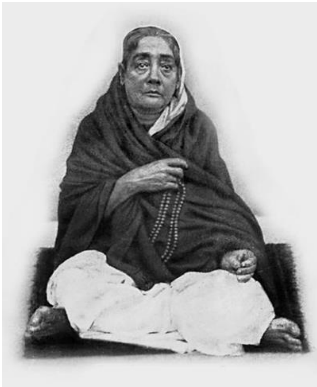
Бхуванесвари Дев (1841–1911)

Я стал тем, кто я есть, благодаря материнской любви, и я в долгу перед матерью, в неоплатном долгу.