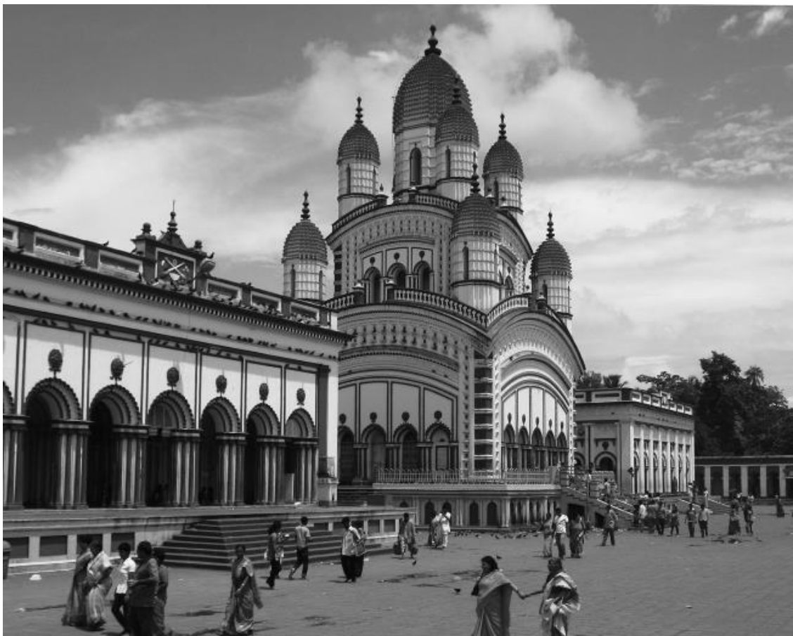
Храм Кали в Дакшинешваре

Тогда я не думал, что храмовый сад Дакшинешвара расположен так далеко от Калькутты, ведь в прошлый раз я ехал туда в экипаже. Дорога показалась мне очень длинной, почти нескончаемой. Однако так или иначе я добрался до сада и направился прямо в комнату Шри Рамакришны. Он сидел один на небольшой кровати. Он обрадовался, когда я пришел, и ласково позвав подойти, усадил рядом с собой на кровать. Но в следующее мгновение я увидел, что он охвачен каким-то волнением. Тихонько что-то бормоча и не сводя с меня глаз, он медленно придвинулся ко мне. Я подумал, что он может сделать что-нибудь необычное, как в прошлый раз. Не успел я и глазом моргнуть, как он поставил правую ногу на мое тело. Этот жест тут же вызвал у меня незнакомое переживание. Я наяву видел, как стены и мебель в комнате стремительно вращаются и обращаются в ничто, а вся Вселенная, как и моя индивидуальность, готовы исчезнуть в таинственной всеохватной пустоте! Я страшно испугался и решил, что сейчас умру, ведь смерть и означает потерю индивидуальности. Не в силах сдерживаться, я закричал: «Что вы со мной делаете! Меня дома ждут родители!» В ответ он громко рассмеялся и, погладив меня по груди, сказал: «Ладно, на сегодня хватит. Всему свое время!». Удивительно, но стоило ему это сказать, как необычное переживание исчезло. Я вновь пришел в себя и заметил, что в комнате и на улице всё как прежде.