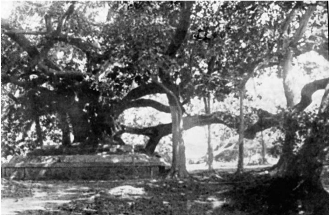
Панчавати в Дакинешиваре

Однажды, когда Учитель сидел со мной в комнате для занятий и наставлял меня о том, как важно всю жизнь поддерживать воздержание, бабушка всё подслушала и сообщила об этом родителям. С тех пор они стали прилагать все усилия, чтобы устроить мою свадьбу, опасаясь, что я уйду в монахи, живя с sadhu . Но разве в этом был толк? Все их усилия не могли преодолеть сильной воли Учителя. Даже когда вопрос о свадьбе, казалось, решился, переговоры снова и снова срывались из-за пустячных расхождений во взглядах сторон [27].