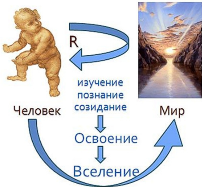
Схема 1. Модель образования человека

Предложенная модель базируется на пяти выявленных нами ключевых стремлениях человека : познавать, создавать, организовывать, взаимодействовать, находить смысл и определять ценности. Каждое из стремлений выражается через соответствующие ключевые образовательные деятельности человека: