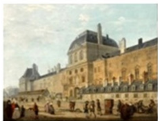
Лувр в 17 веке

учит не унывать и не сдаваться перед трудностями. Если тебе трудно сразу читать такую толстую книгу, то посмотри сначала мультимедиа, познакомься с героями книги. Тогда захочется её прочитать и поиграть с друзьями в мушкетёров.