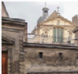
Монастырь кармелиток Дешо

Un pour tous et tous pour un! Один за всех и все за одного!