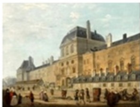
Лувр в 17 веке

Королевские мушкетёры – лучшая часть французской гвардии. Они охраняли Лувр и участвовали во всех войнах. Их главным оружием были острые шпаги. Д 2 Артаньян и его друзья всегда выступали на стороне королевы и помогали ей победить кардинала. Эта книга рассказывает про крепкую дружбу, верность своему слову и благородство. Она учит не унывать и не сдаваться перед трудностями. Если тебе трудно сразу читать такую толстую книгу, то посмотри сначала мультфильм, познакомься с героями книги. Тогда захочется её прочитать и поиграть с друзьями в мушкетёров.