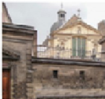
Монастырь кармелиток Дешо

А в это время в 16.... году в Париже на пустыре за монастырем кармелиток Дешо, мушкетёры Короля: Д I Артаньян, Атос, Портос и Арамис устроили пикник. Они делали barbecue , обсуждали свои приключения во время путешествия в Лондон по просьбе королевы. Они привезли ей подвески и победили всесильного кардинала Ришелье. А теперь просто отдыхали и радовались жизни.