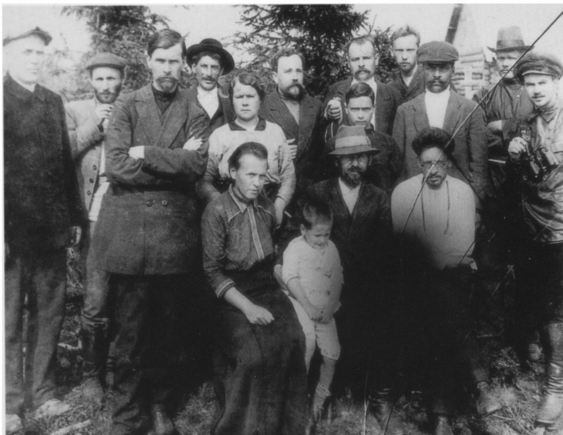
Сталин (четвертый слева, сзади) в группе ссыльных большевиков (среди них Каменев, Спандарян, Свердлов) Туруханск 1915 г.