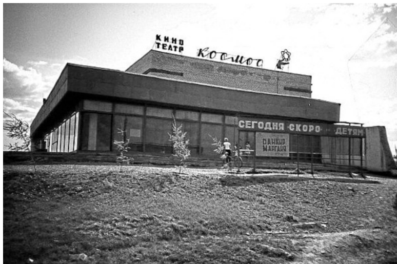
Кинотеатр «Космос», 80-е годы прошлого столетия

Не умею пользоваться аппаратом памяти и процессом запоминания, как хотел бы... Знаю и уверен, что память наша уникальная и всё там хранится. Есть моменты, какие помнишь до мельчайших подробностей, «до сучка и мельчайших трещинок», всё помнишь, а бывают такие, что плавают как в тумане, а есть и напрочь «отшибнутые», тебе говорят, а ты глазками хлопаешь, моргаешь и словно спрашиваешь «и я там был...?»