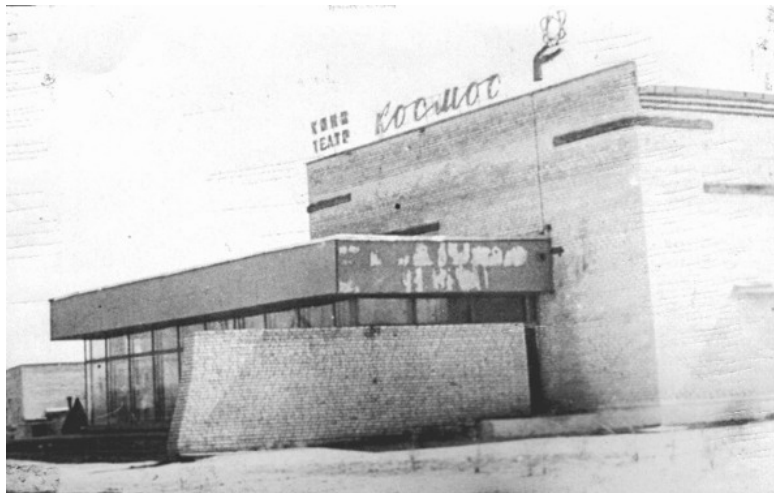
Кинотеатр «Космос», 70-е годы прошлого столетия