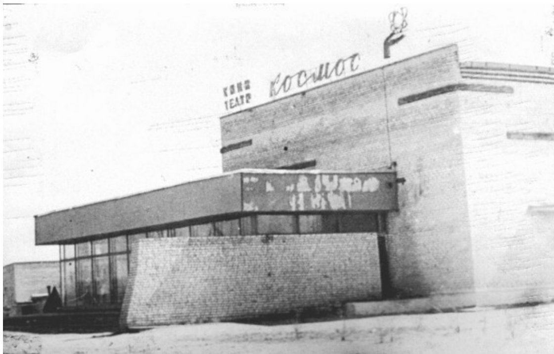
Кинотеатр «Космос», 70-е годы прошлого столетия