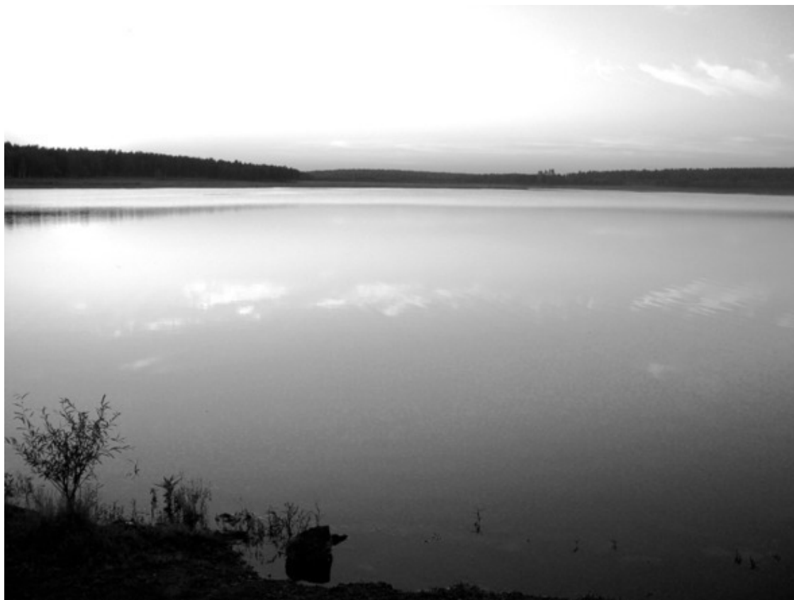
Закат на Плотине

...Ещё кроме купания, привлекала плотина своими закатами, что открывало вечерами удивительную картину заходящего солнца. Не похожими были друг на друга, каждый раз по-новому раскрашивали окраину неповторимыми красками, а когда спускался туман, то распределение лучей составляло чудесное матовое освещение, создавался импрессион – впечатление. Рыбак на лодке, оказавшийся в плену надвигающихся языков тумана, всегда рисовался загадочным путником, попавшим в неожиданную картину. И было интересно наблюдать, как постепенно с каждым наплывом пелены, рыбак скрывался из виду, пропадал в неизвестное детскому уму природное хитросплетение. А заря медленно гасла где-то на краю Земли... Пропадали последние подсветы и по поверхности воды оставались слышимыми тихие всплески вёсел о воду.