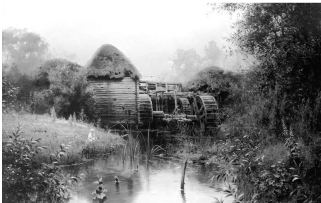
Художник Поленов Василий Дмитриевич (1844—1927). Старая мельница.

Мне стало крайне интересно то, что же собой представляла местность... Оставив на сержантов личный состав, я с удовольствием отправился осматривать то, что когда-то представляло собой шумный говорливый узел жизни.