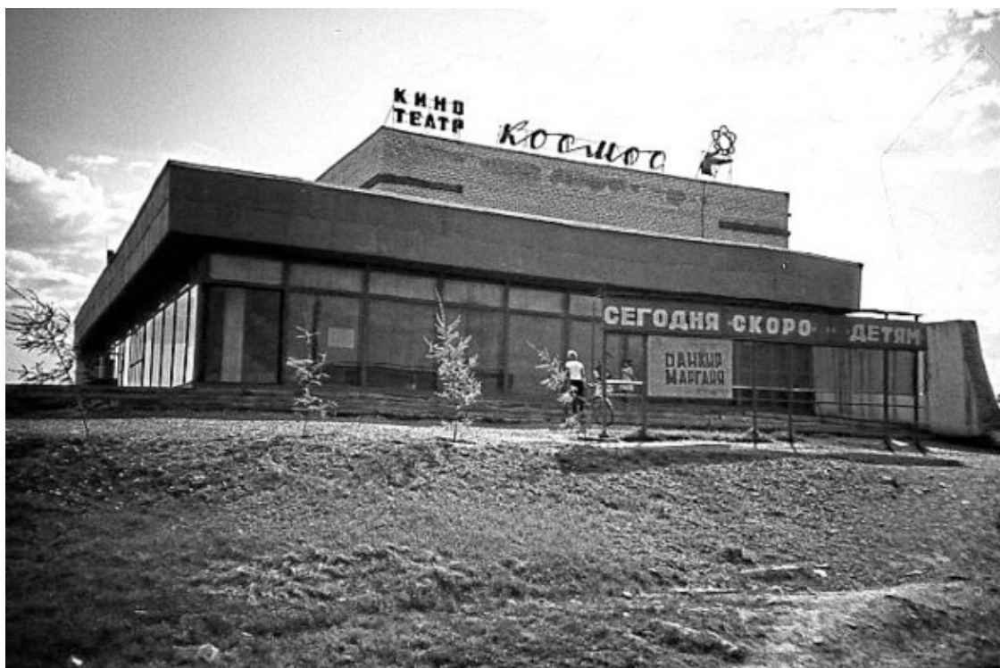
Кинотеатр «Космос», 80-е годы прошлого столетия

Человек может помнить особенно, если связано с каким-либо событием, важным моментом его жизни, тогда память закрепляется надёжно и оно, событие может освежить жизнь прошедшую, что рядом проходила с этим событием. И, как пример, вспомнил тут об олимпиаде по физике, что проходила в школе рядом с кинотеатром, который толи строился, толи был ещё в проекте зимой 68—69 года, когда я учился в шестом классе... Это воспоминание быстренько отправило памятью к девочке, с которой познакомился там, и долгое время она нравилась мне. А за памятью о ней вспомнился каток, где тайком следил за ней. [1] Каток для нас был неким центром, где пробегали вечера нашей зимней жизни... И Вы пробуйте вспомнить события, действие которых протекали в тогдашнем времени и к нему подтянутся ряд дополнительных воспоминаний и так далее, и далее обозначатся контуры прошлого. [2]