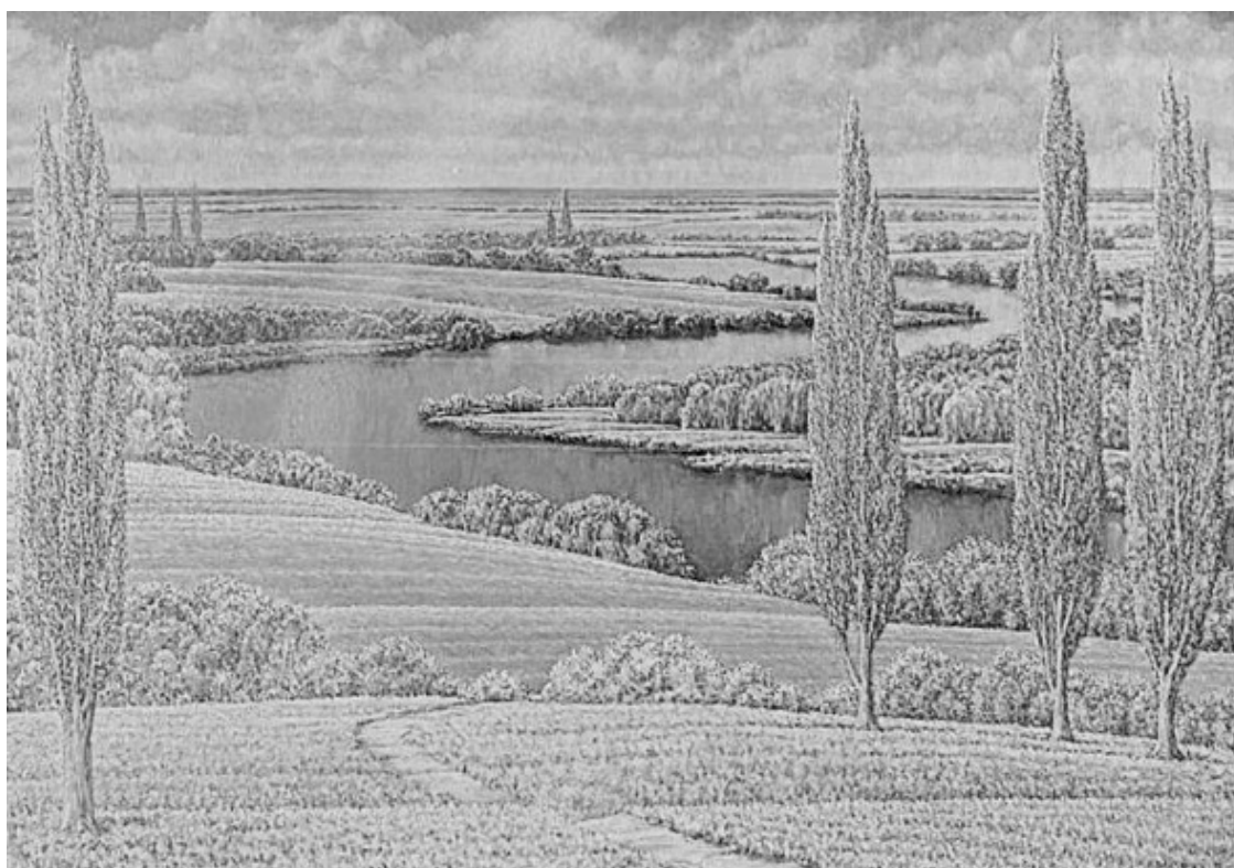
Художник Винтенко Борис Михайлович (1927—2002). Весна на Ингуле

Многие люди в такие времена снимаются с мест насиженных и отправляются в путь, порою совсем неизвестный, не зная, что ждёт их в местах чужих... Они с болью и тоской покидают нажитые места и, отрываясь от дома своего, испытывают боль. Кто из них знал, какая участь предостерегает в новых местах, никто! но открепляются и едут в стороны чужие. Зовутся они беженцами. Думалось ли, что когда-нибудь такая участь выпадет мне... Да жизнь полна сюрпризов, пришлось испытать.