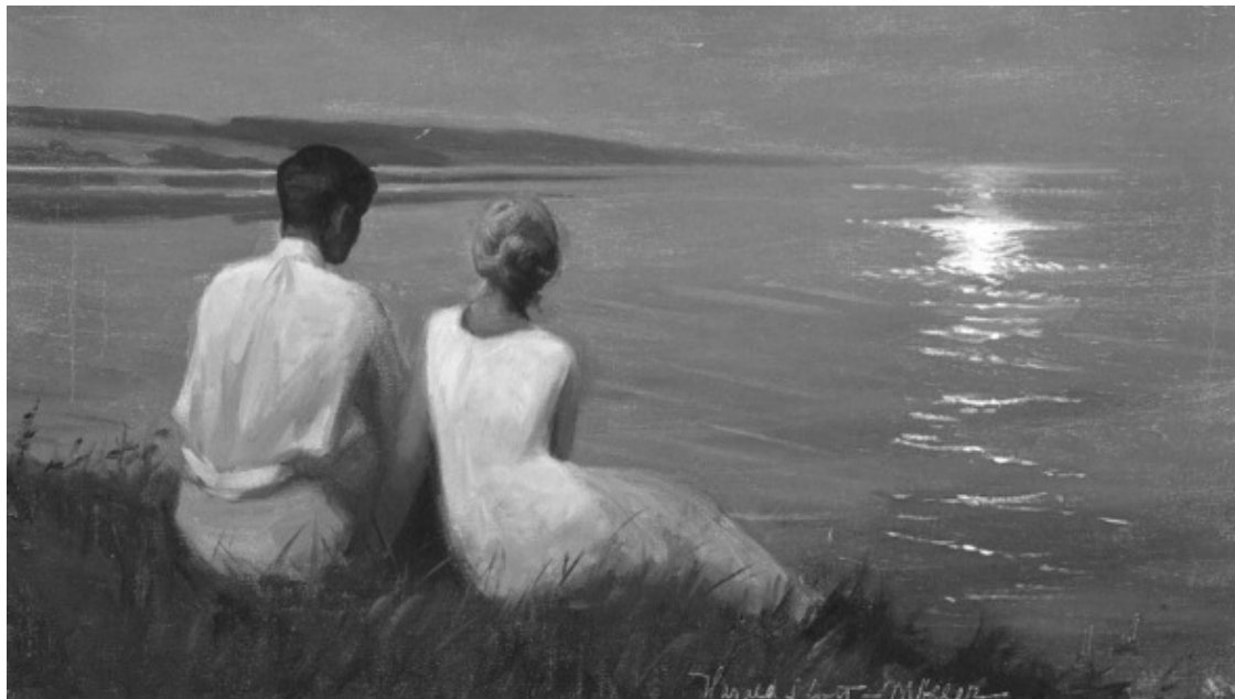
Художник Харальд Слот-Мёллер (1864—1937). Лунный свет.