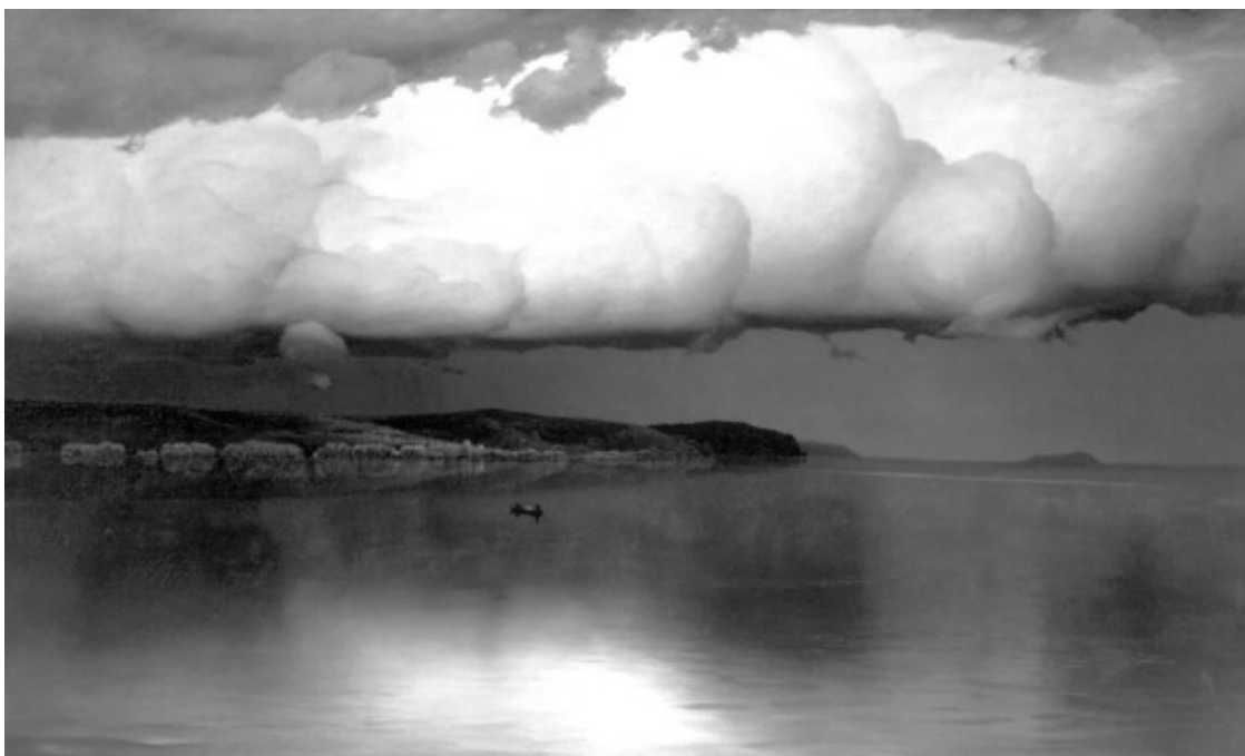
Художник Дубовской Николай Никанорович (1859—1918). Притихло.

Он поднимается, это является признаком, пора расходится, разговорам конец... Мужики быстренько рассыпаются по домам своим. Надо сделать догляд, всё ли так в хозяйстве перед дождём, может и град приключится. Запираются двери, окна, а нас стараются загнать домой помимо нашей воли, случись гроза. Это не всегда получается... Пугают шаровой молнией, которую мы в глаза не видели, но говорят, есть она, существует. С ней всякие страшилки рассказывают, мол, заходит в дом, бродит в нём и надо в этот момент совсем не двигаться, прямо замереть на месте. Якобы она может за бегущим от неё погнаться и поразить... Здесь совсем страшно! и мы верим в такое... Потом, выпучив глаза, будем другим рассказывать, но с уже приукрашенными подробностями и своими вымыслами.