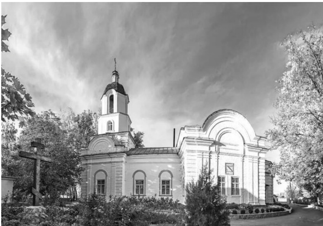
Свято-Богоявленский женский монастырь. Село Диковка, Кировоградской области