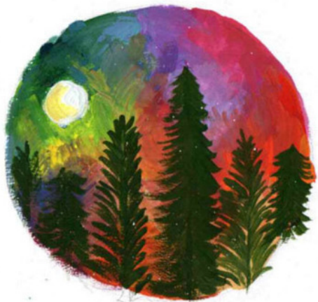
Туркова Феврония «Луна»