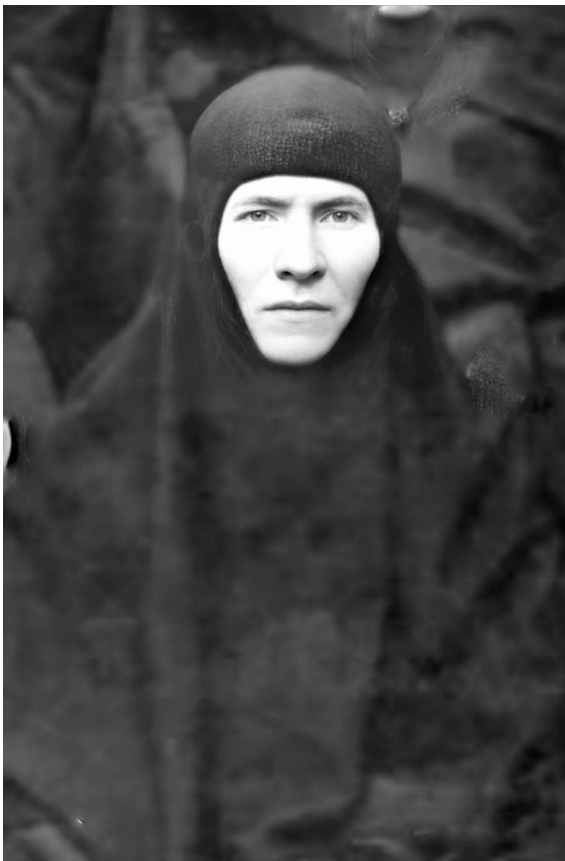
Сапрыкина Прасковья Афанасьевна (Макария) Икона матушки Макарии.