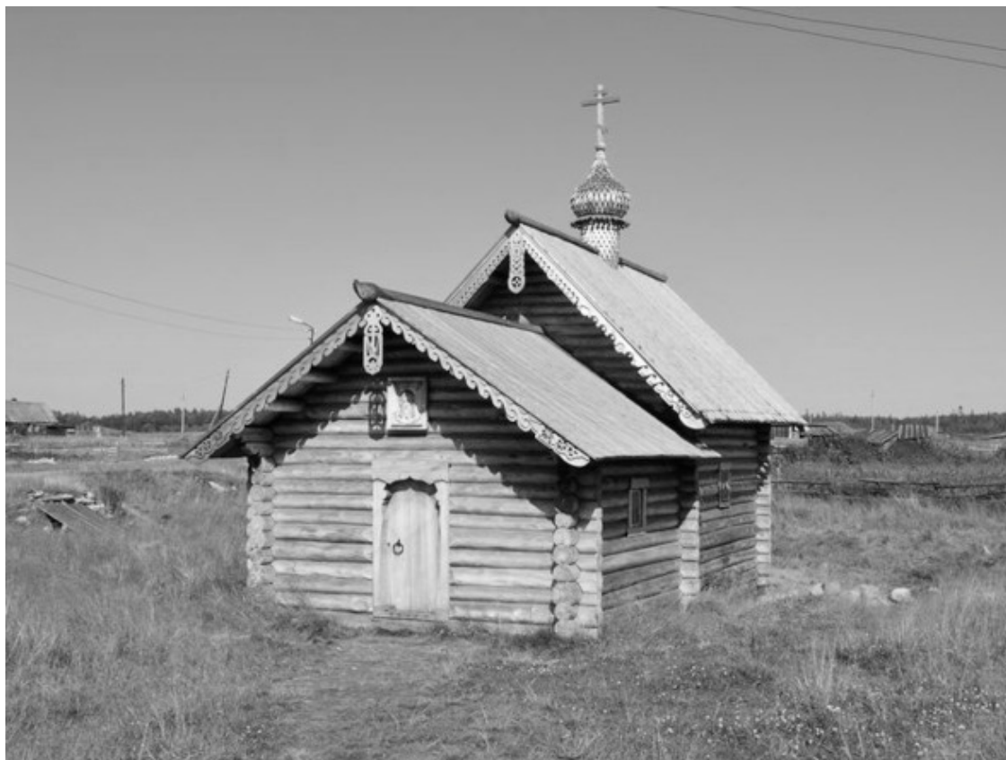
Примерный внешний вид первого храма в селе Теляжье.