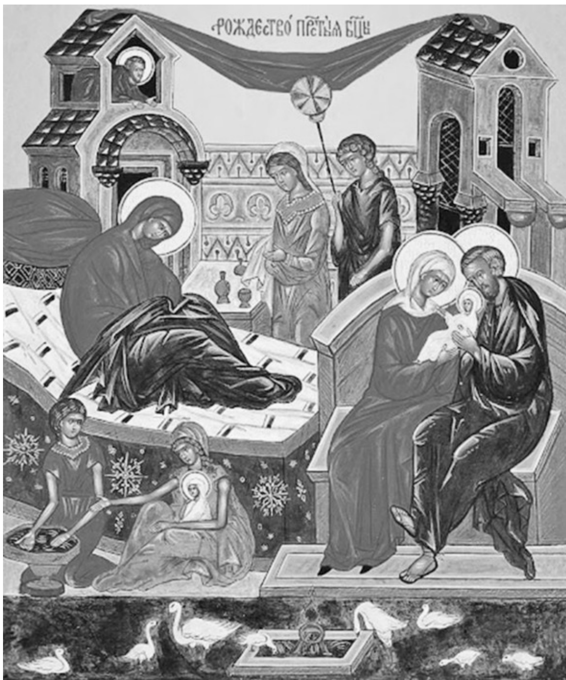
Икона «Рождество Пресвятой Богородицы».

У восточных славян день посвящён собранному урожаю, плодородию и семейному благополучию. К этому времени завершаются полевые работы: жатва, вывоз хлеба в овины, уборка льна. В этот день чествовали и благодарили Богородицу (Мать – Сыру – Землю) за собранный урожай. Считалось, что она даёт благополучие, покровительствует земледелию, семье и особенно матерям. В некоторых местах отправляются поминки по мёртвым, как в Дмитриевскую субботу. В давние времена женщины рано утром старались пойти на речку и встретить этот день у воды. Считалось, что если женщина умоется в этот день водой до восхода солнца, то она будет красива до самой старости. А если девушка умывалась до восхода солнца – быть ей в этом году просватанной. В этот же день считалось обязательным навестить молодых. Ходили в гости к тем, кто недавно отпраздновал свадьбу. Считалось, что родители в этот день должны были