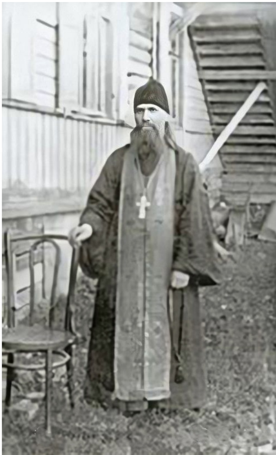
иеромонах Варнава Клыков незадолго до ареста 1932 год.