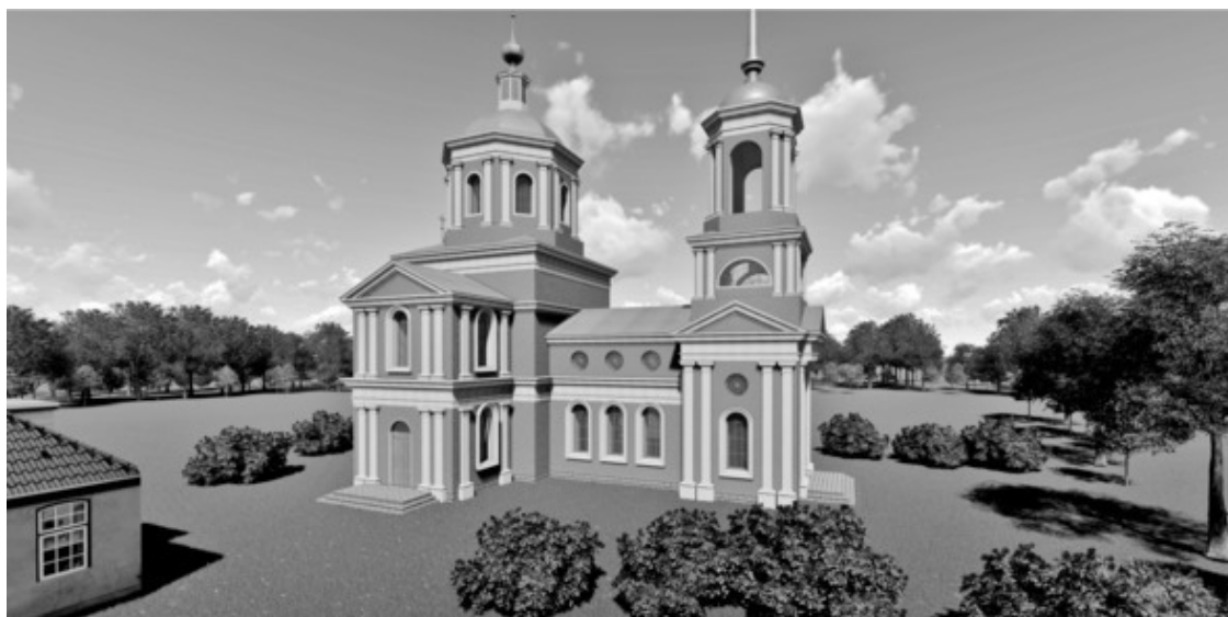
Примерно так выглядела Рождество Богородицкой церковь в с. Теляжье.