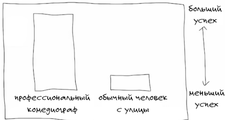
Сравнительная таблица успешности в комедии

Моя книга подробно их все описывает и объясняет, как ими пользоваться. Она конденсирует все, что комедийный