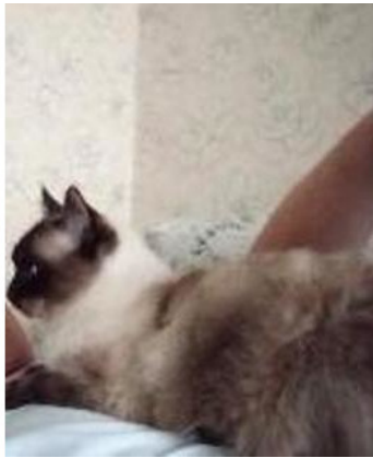
Кот-сиамец Барсик (фото автора).

Красивый кот, явный сиамец, лениво лежал на серо-зелёном, недоступном для его острых когтей, диване, самодовольно играя кончиком хвоста, и внимательно выслушивая малоубедительное враньё хозяйки. Пока пострадавшая сушила феном волосы, Лёха рассуждал про себя, в чём же состояла вина хвостатого любимца дома и была ли она реальна вообще?