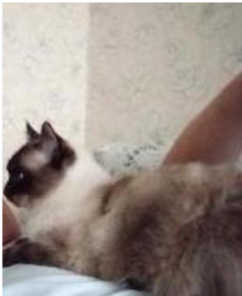
Кот-сиамец Барсик.