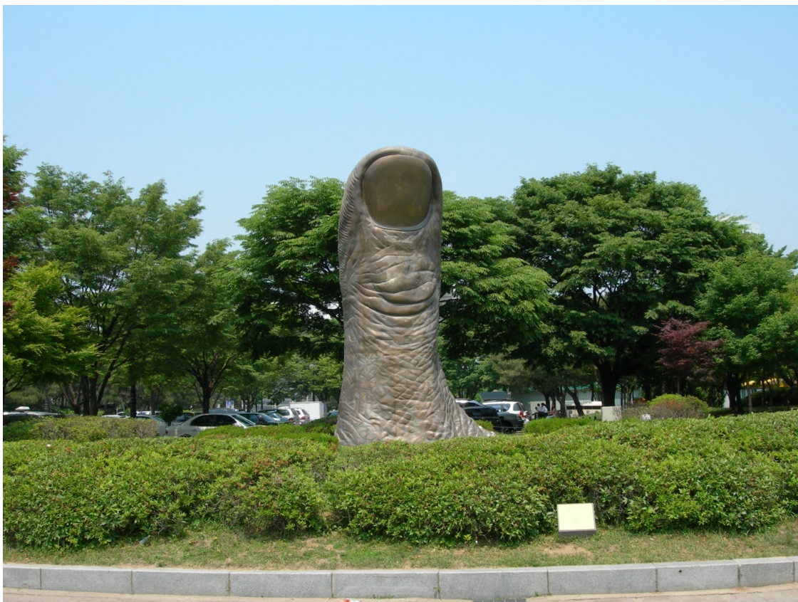
Олимпийский парк в Сеуле. Скульптура «Указующий перст».