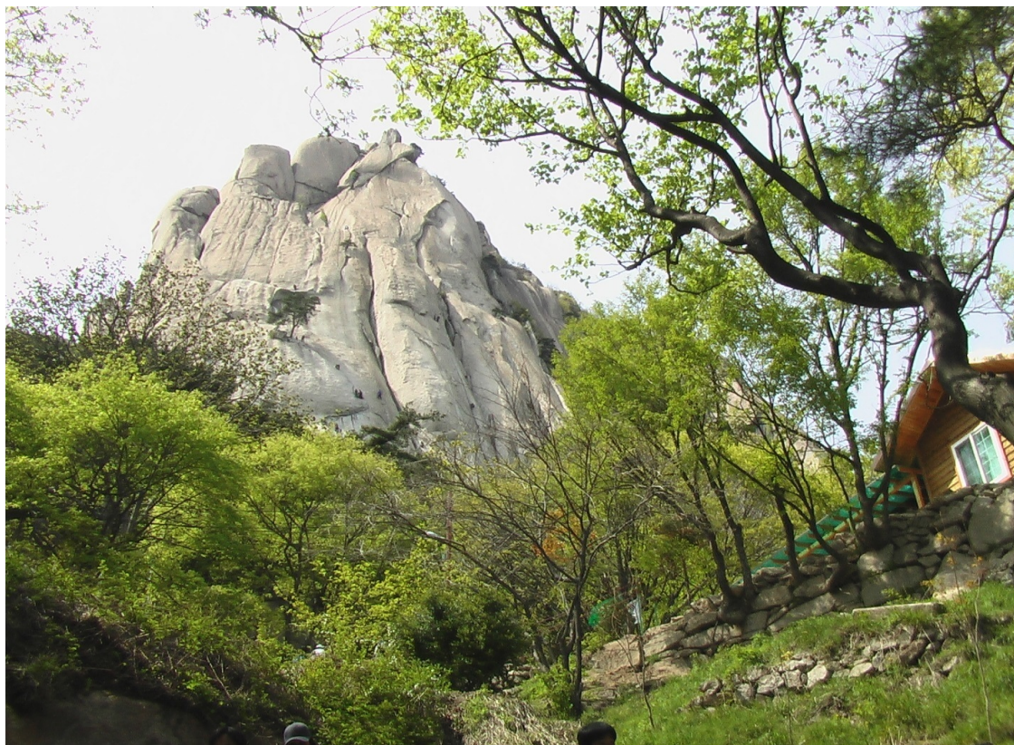
Вершина корейской горы Добонгсан

Они расположены тут же, в Сеуле, и в них развернуты национальные парки для отдыха. Южная Корея – территориально весьма небольшая страна, ее размер сравним с размером Московской области, 70% территории – горы. Дачных участков практически ни у кого нет, по выходным жители Сеула в большинстве своем отправляются в национальные парки лазить по горам. До этих парков легко добраться на метро.