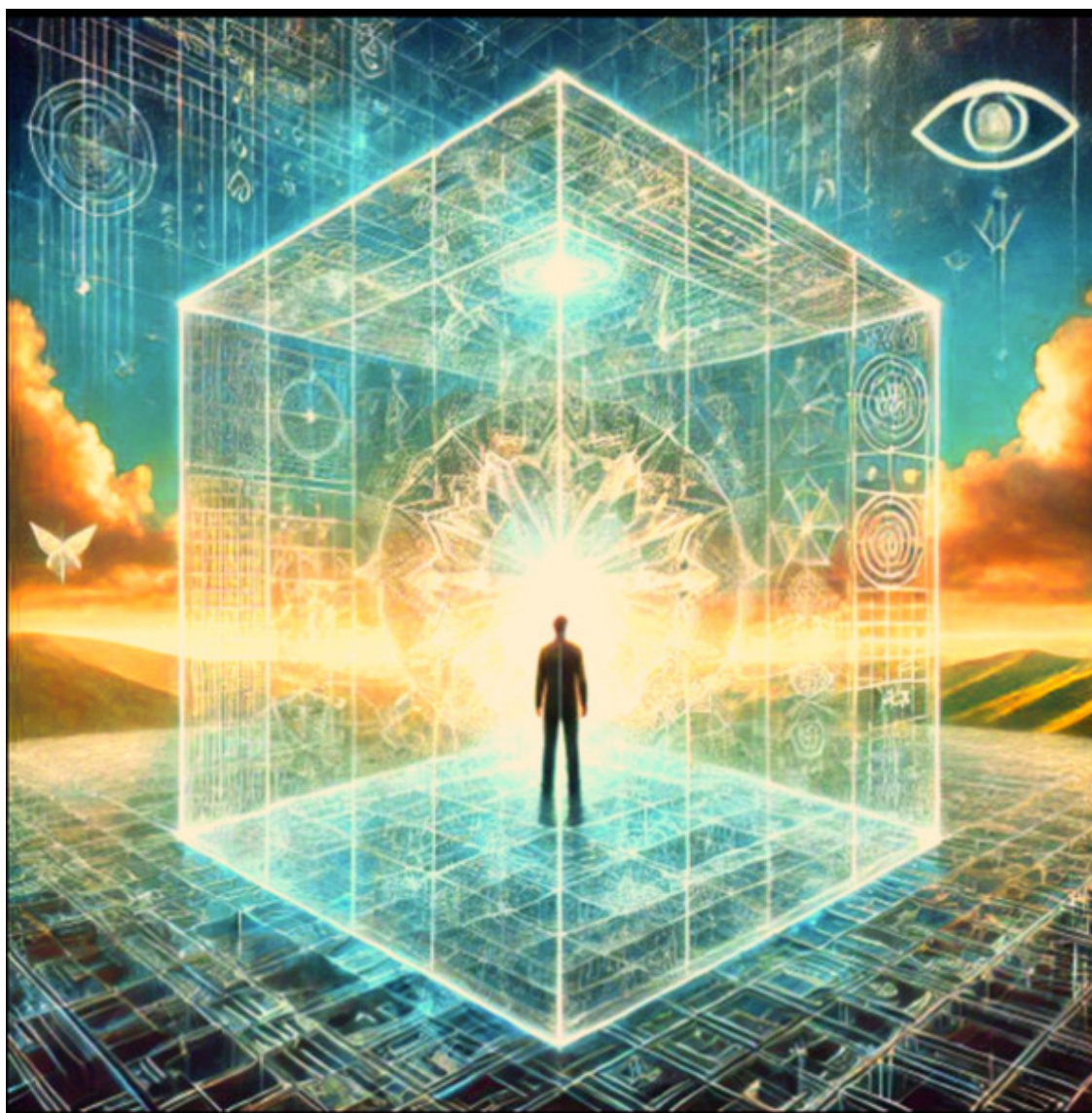
Иллюстрации КаМА Источник Блаженства

Давай перейдём ко второй главе и углубимся в следующую ступень пути – осознание собственных границ и ограничений, которые мешают восприятию внутренней свободы.