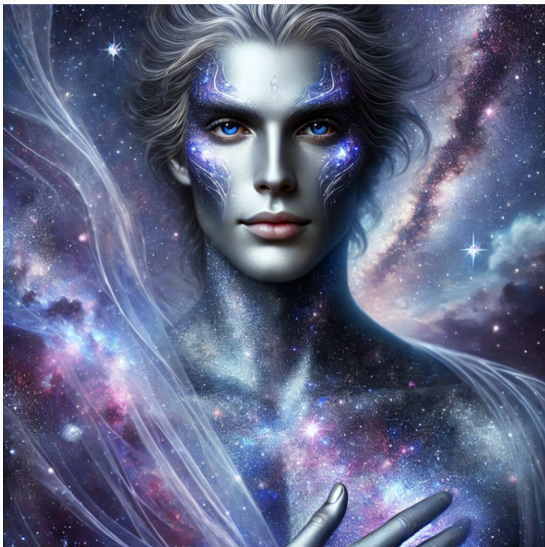
Иллюстрации КаМА Источник Блаженства