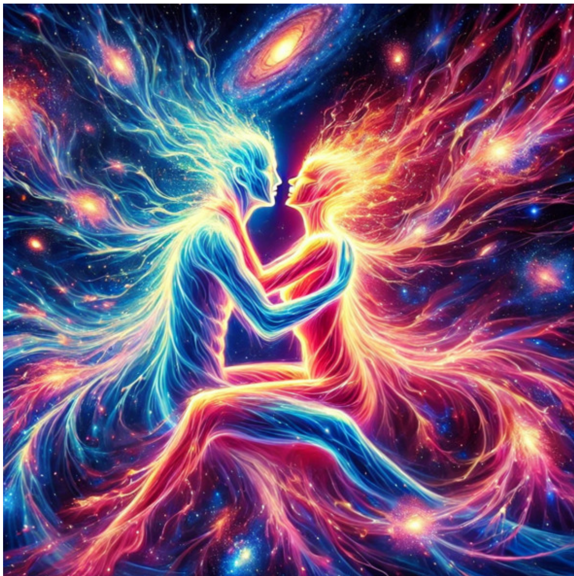
Иллюстрации КаМА Источник Блаженства