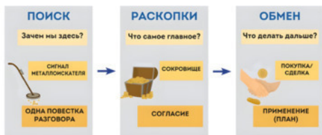
Схема 1. Путь к сокровищу в разговоре.

Данный процесс можно обобщить в следующей схеме: