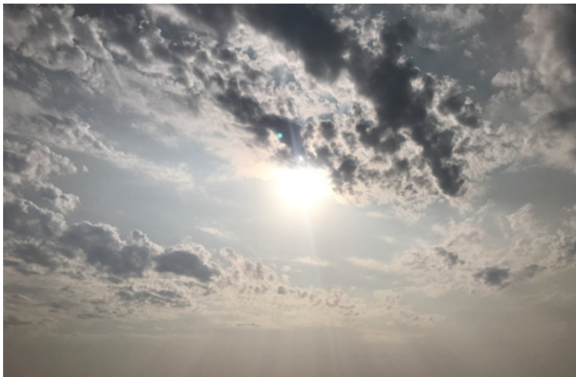
Сочи. 28 октября 2020