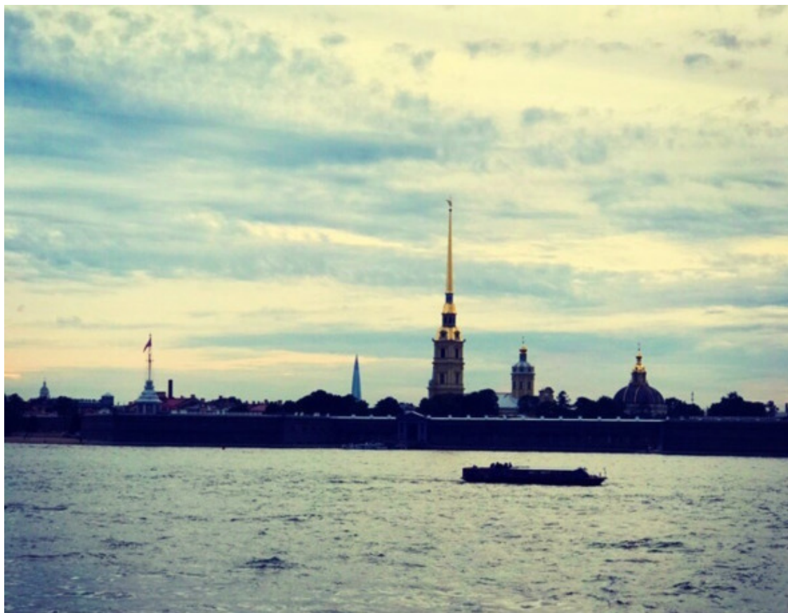
Санкт-Петербург, 2018