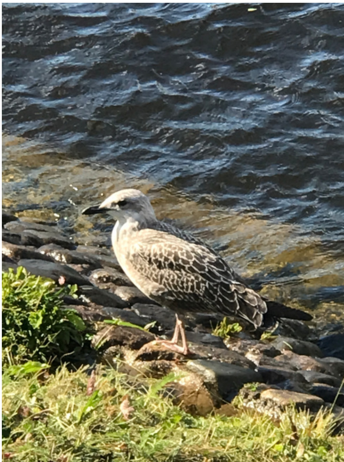
Санкт-Петербург. 21 июля 2021 год