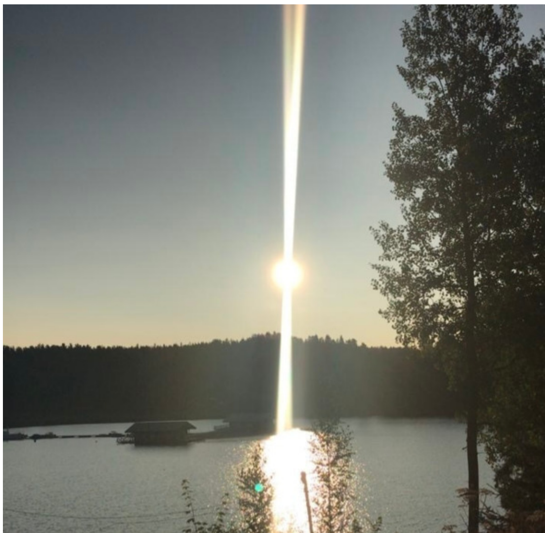
Карелия. Лахденпохье. 1 августа 2020