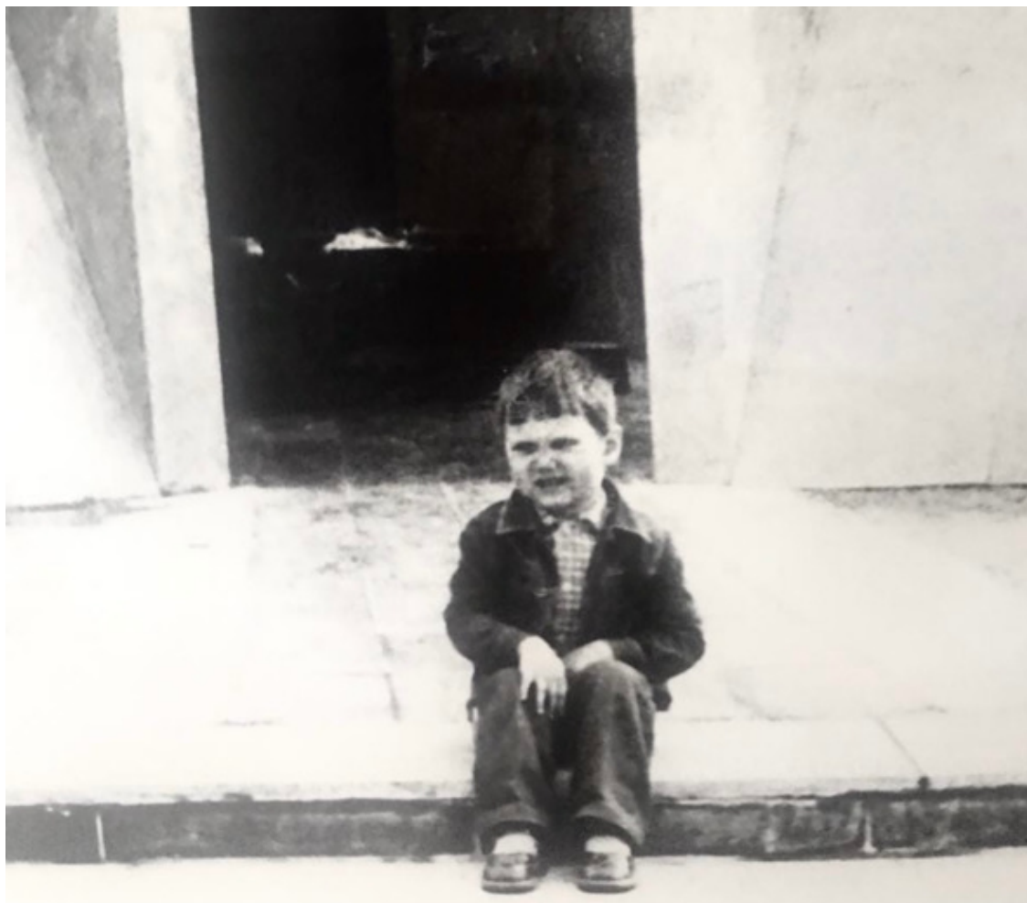
Ухта. Вечный огонь. 1985 год