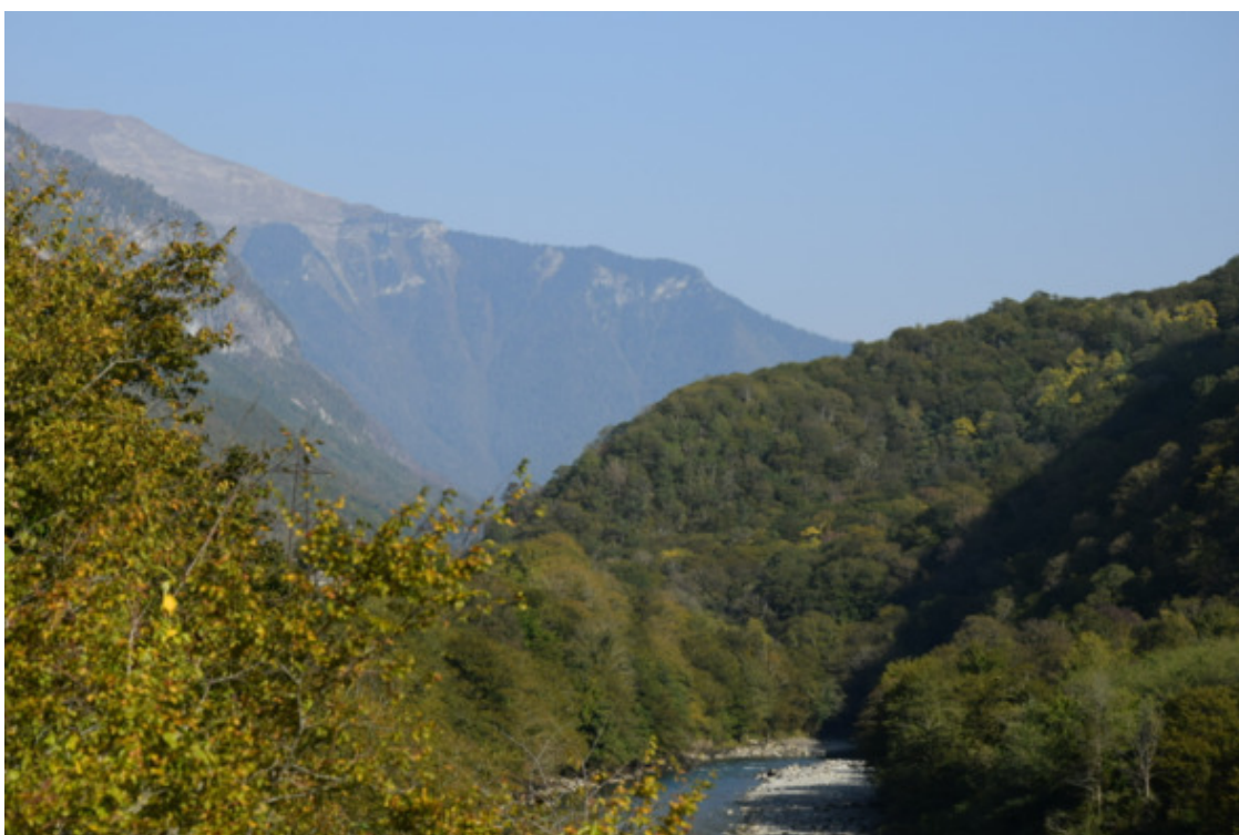
Абхазия. 29 октября 2020