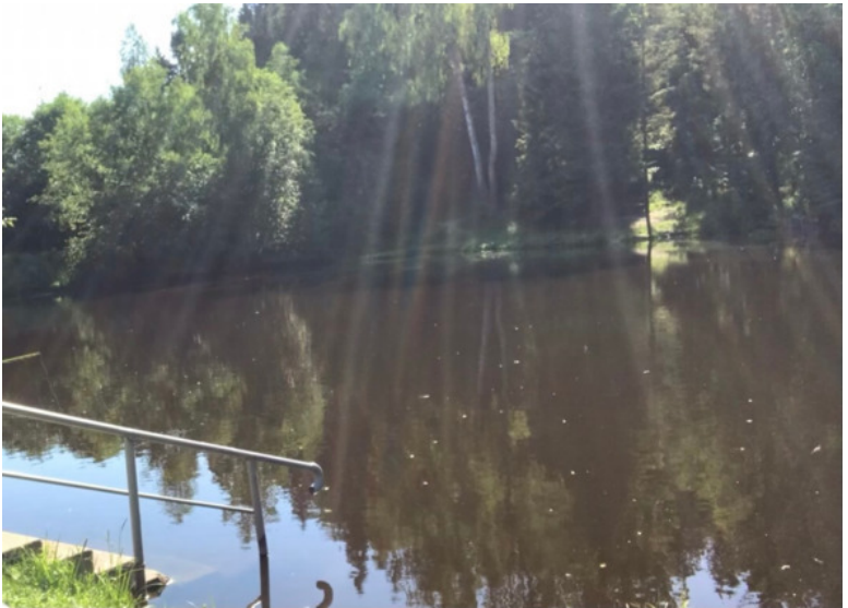
Московская область, деревня Су- харево, 2020