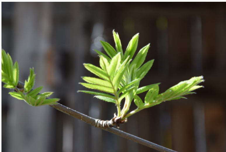
Россия. Рябина. 2017