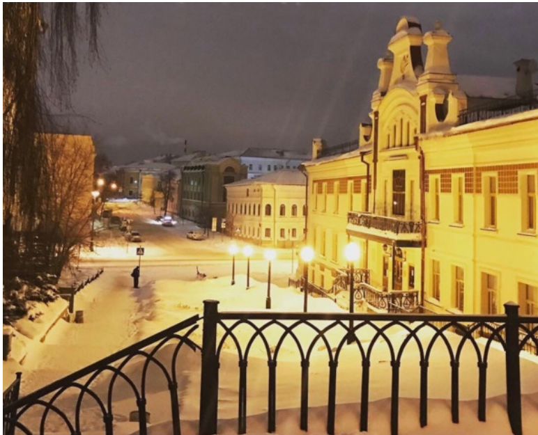
Казань, 2020. Селах