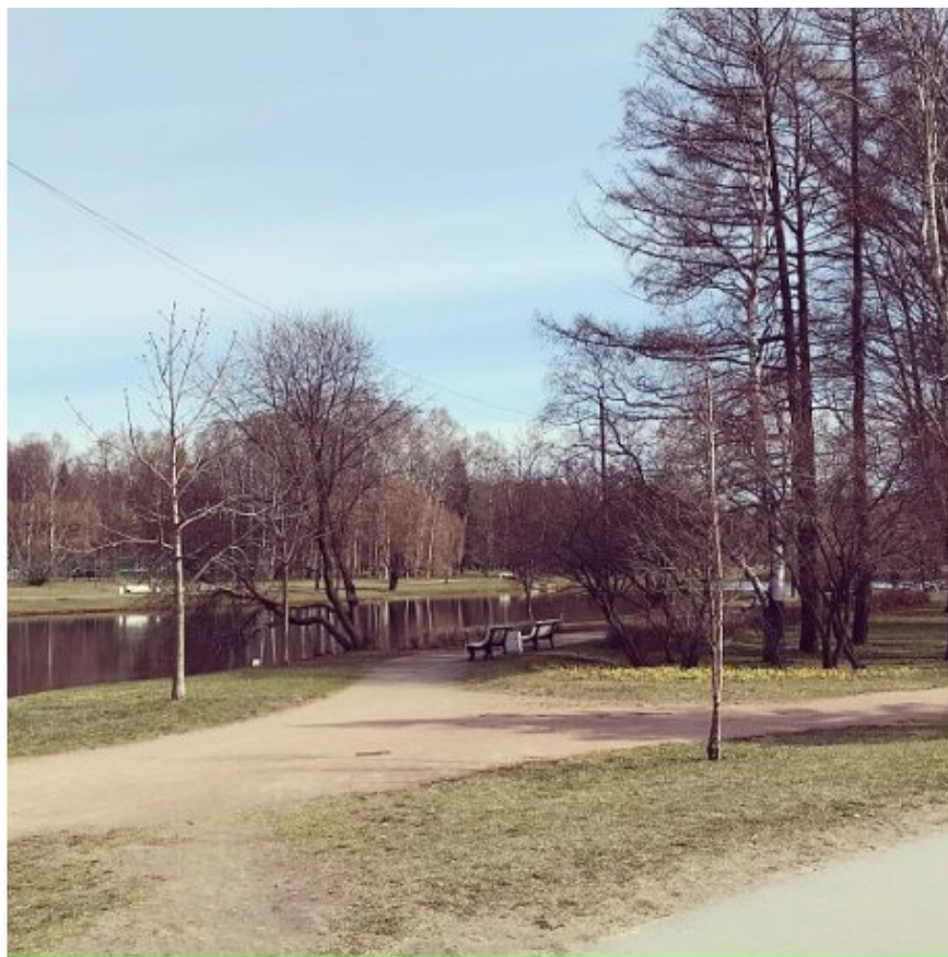
Санкт-Петербург, Крестовский остров, пандемия 2020 год, апрель