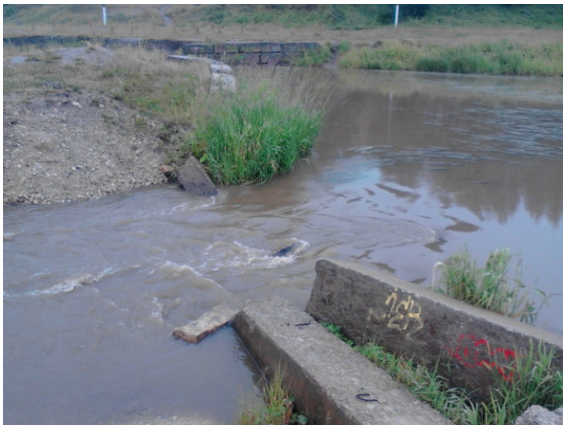
Ухта. 2015