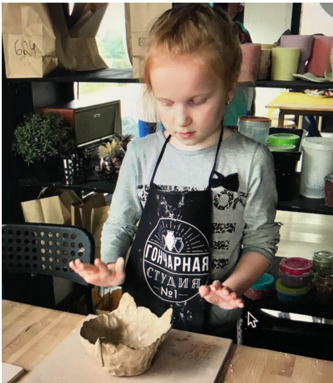
Гончарная мастерская. 28 сентября 2018 год