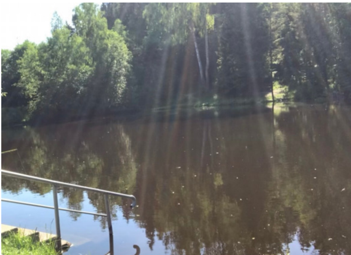
Московская область, деревня Сухарево, 2020