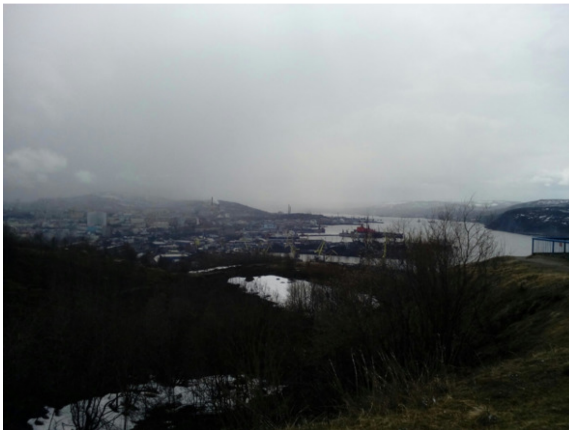
Мурманск, 2017