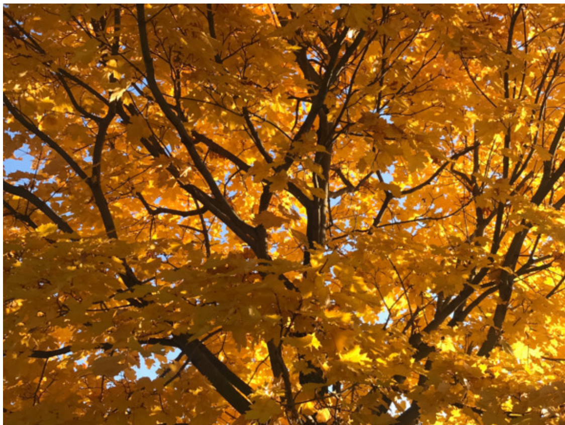
Санкт-Петербург, 2020