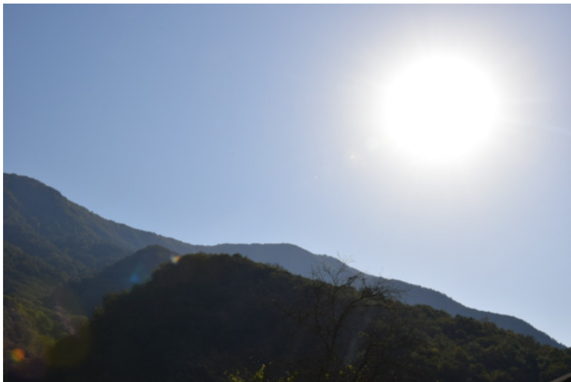
Кавказ. Сочи. Красная Поляна. 2020