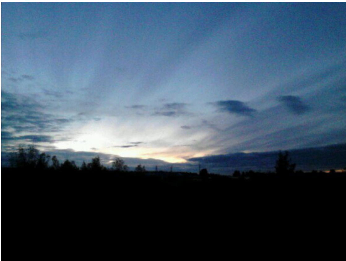
Местечко Месью. 2016