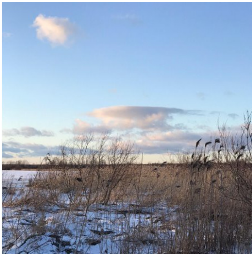
Санкт-Петербург, 2020