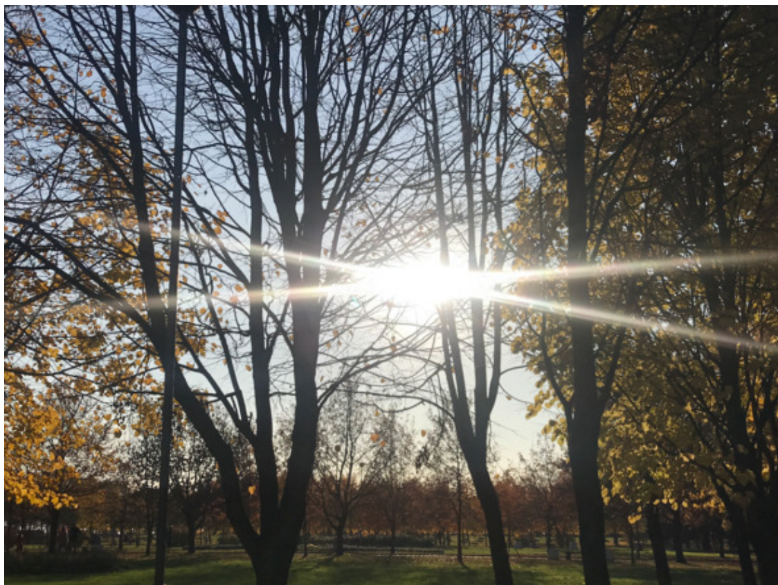
Санкт-Петербург, 2020