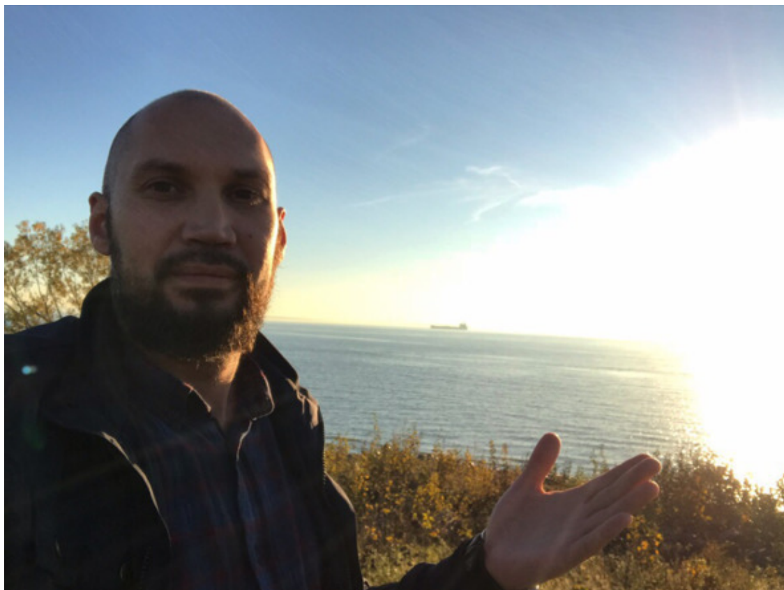
Кронштадт, 2018