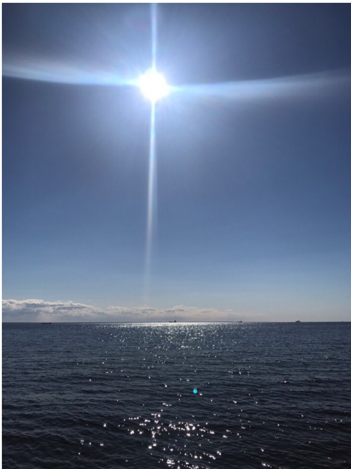
Кронштадт, о. Котлин, 2017