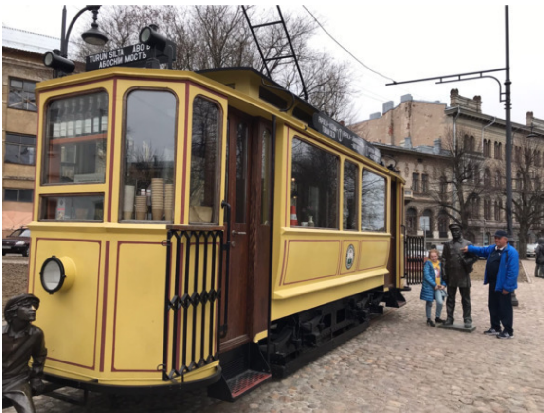
Выборг, 2021