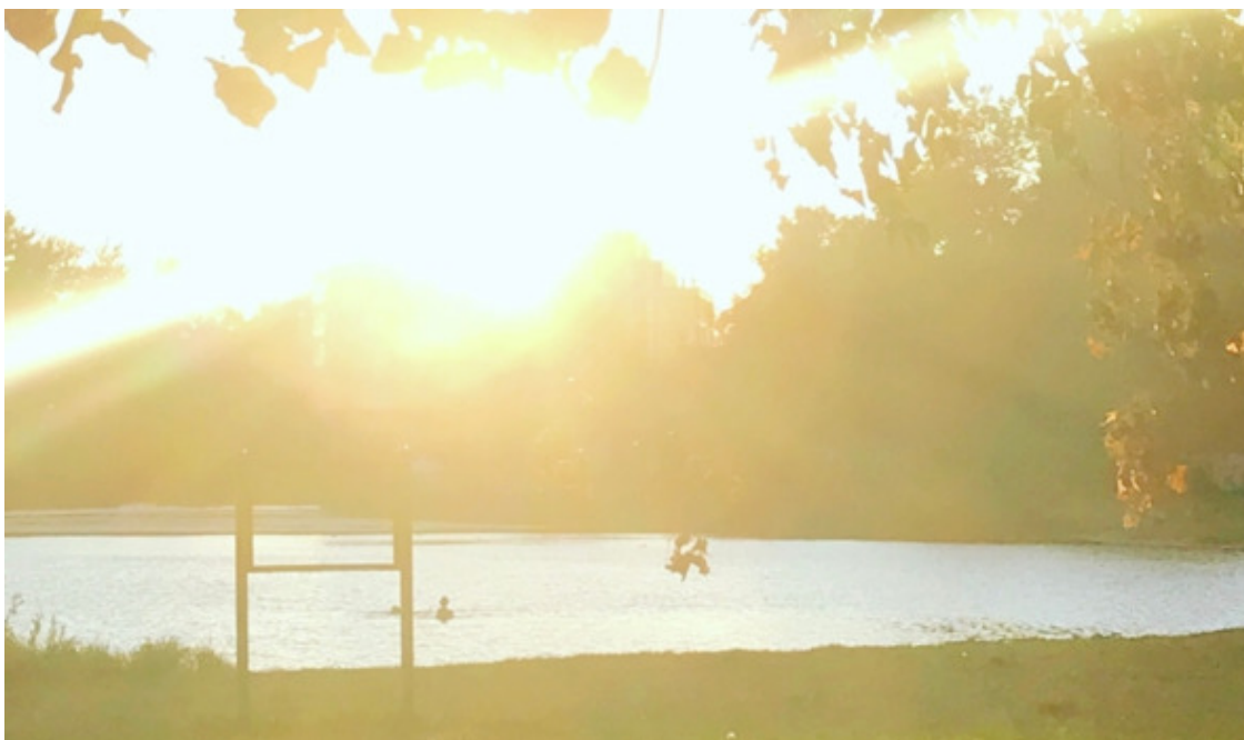
Санкт-Петербург, Петровский остров