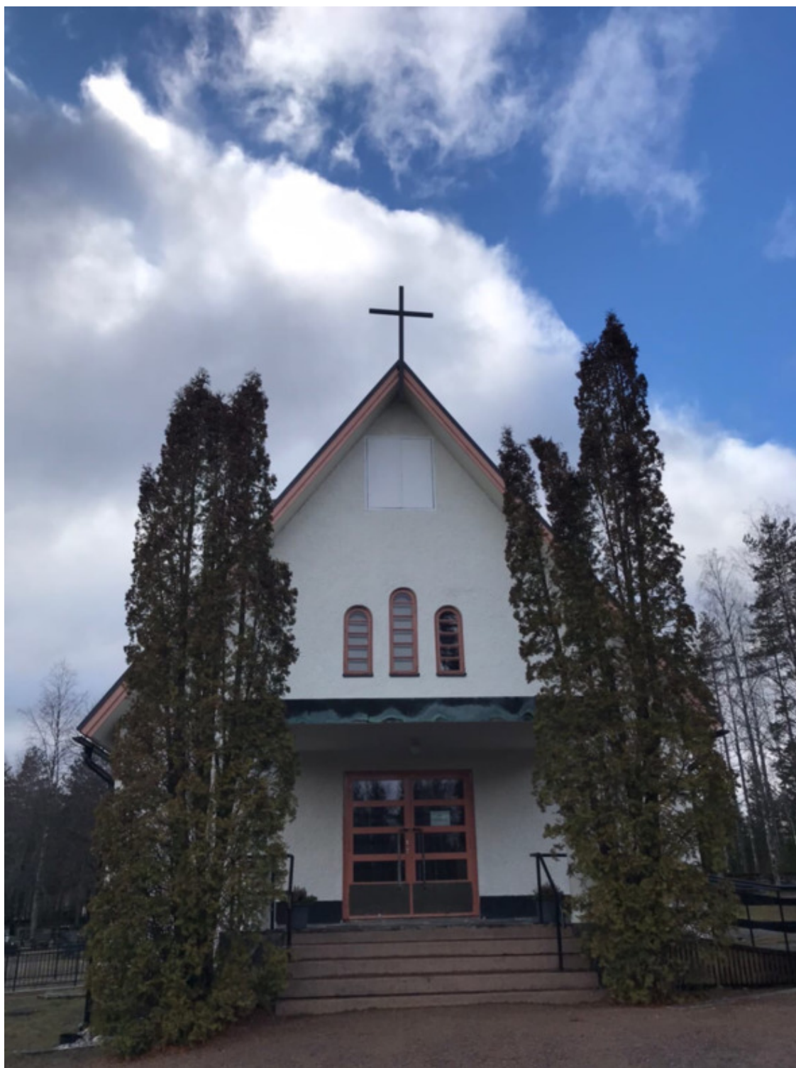
Финляндия, 14.03.2020