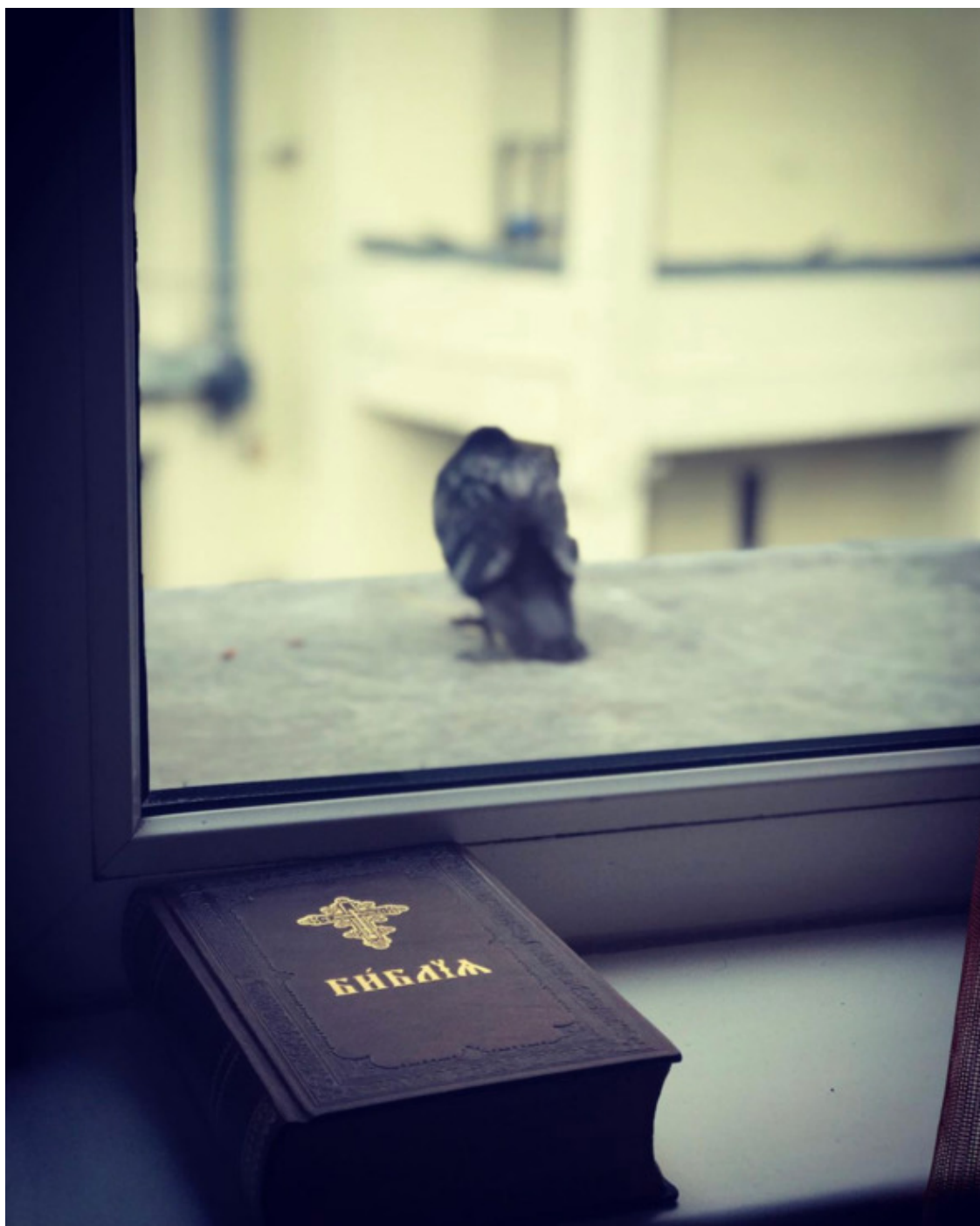
Санкт-Петербург. СПбХУ, 2018