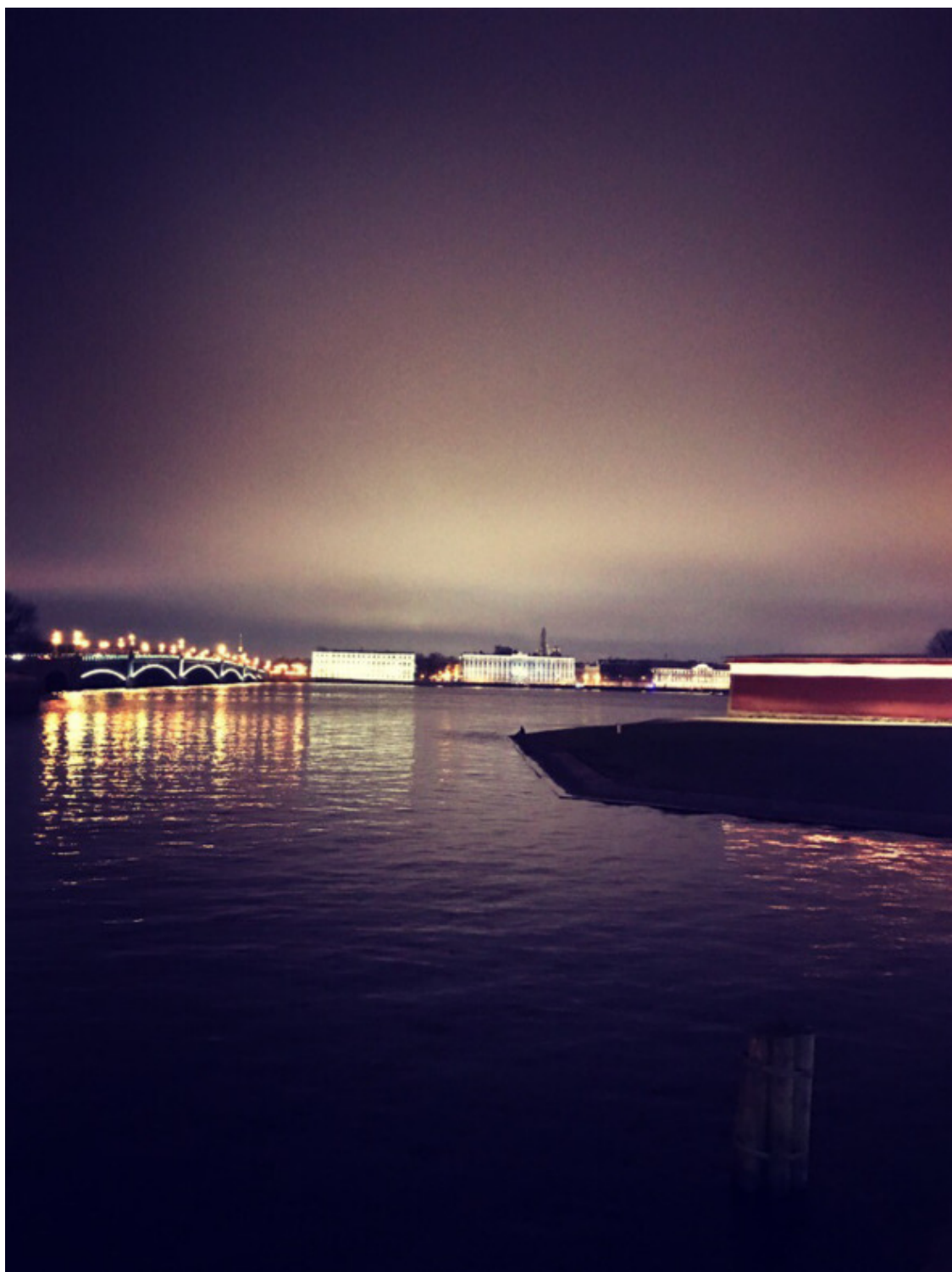
СПб, 2019