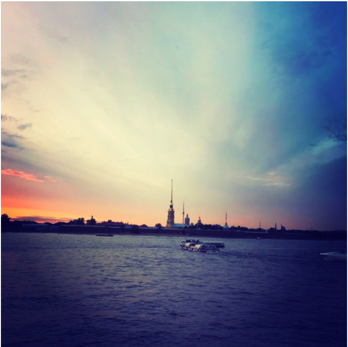
г. Санкт-Петербург, вид на Петропавловскую крепость 07.06.2018