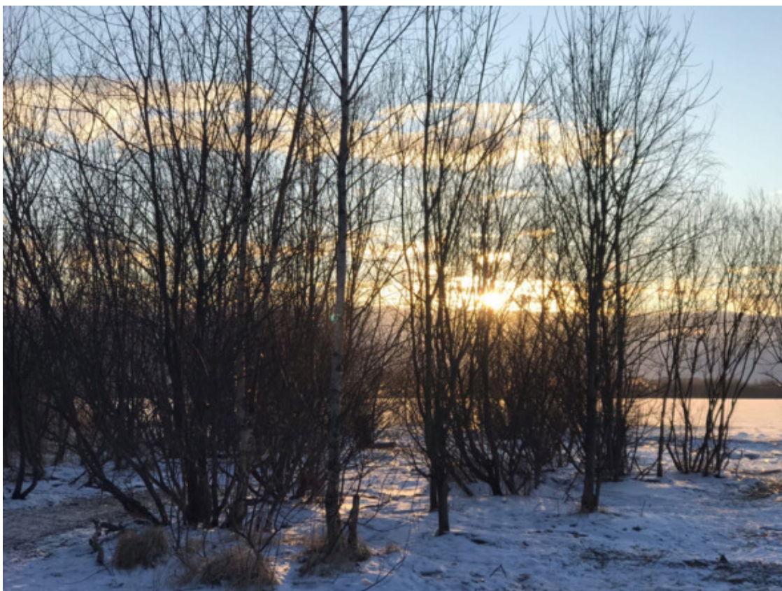
Санкт-Петербург, Шуваловский заказник, 2020