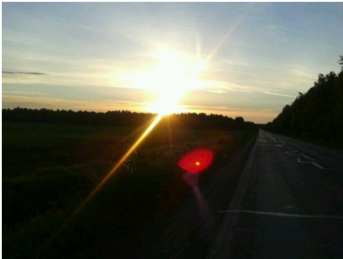
Фото из архива автора. Сосногорск-Ухта, посёлок Югэр, Республика Коми, 2012