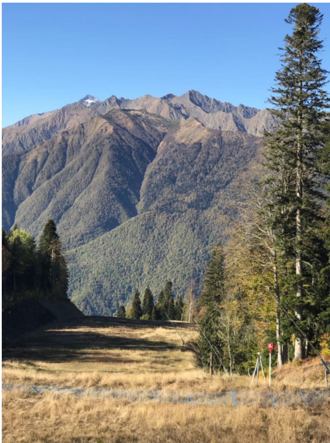
Сочи, Красная Поляна, 2020