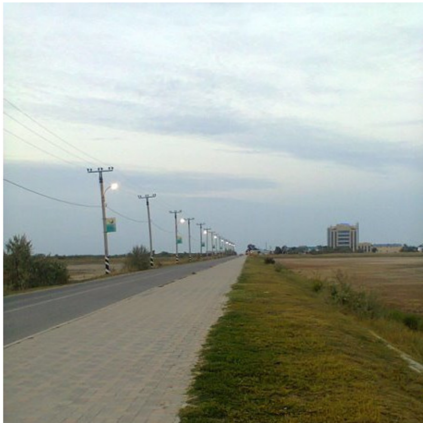
Станция Благовещенская, 2015