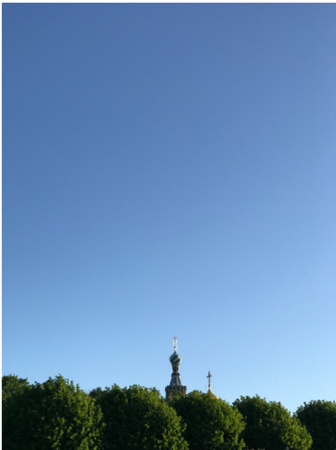
г. Санкт-Петербург, Спас на крови, 2021