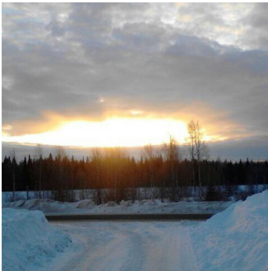
Местечко Месью, 2015 год