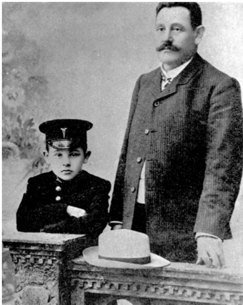
Илл. 1. Бабель со своим отцом. Николаев, 1902 год