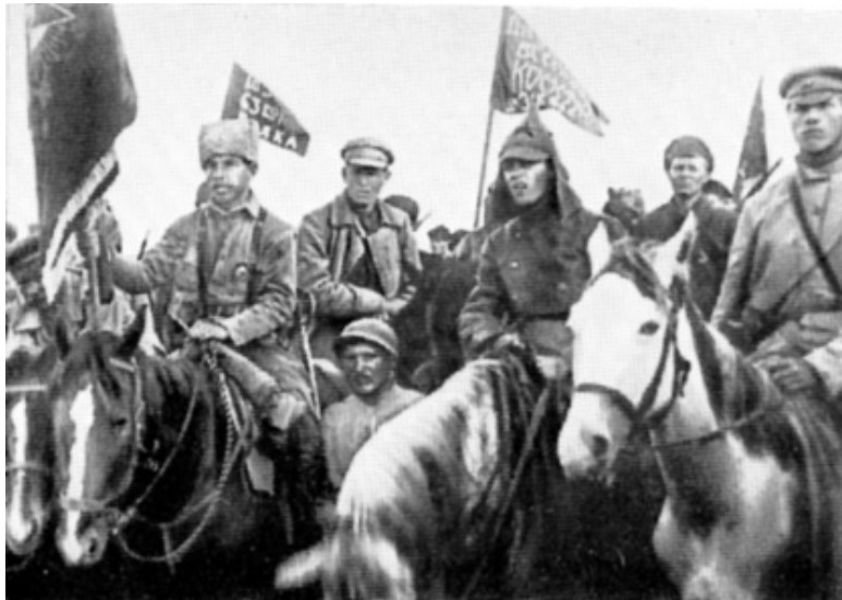
Илл. 5. Первая конная армия, 1920 год

В редакторском предисловии нападки Буденного названы «ценными», а также дается обещание, что за ними последует обсуждение всего творчества Бабеля – и это до того, как Бабель выпустил хоть одну книгу!