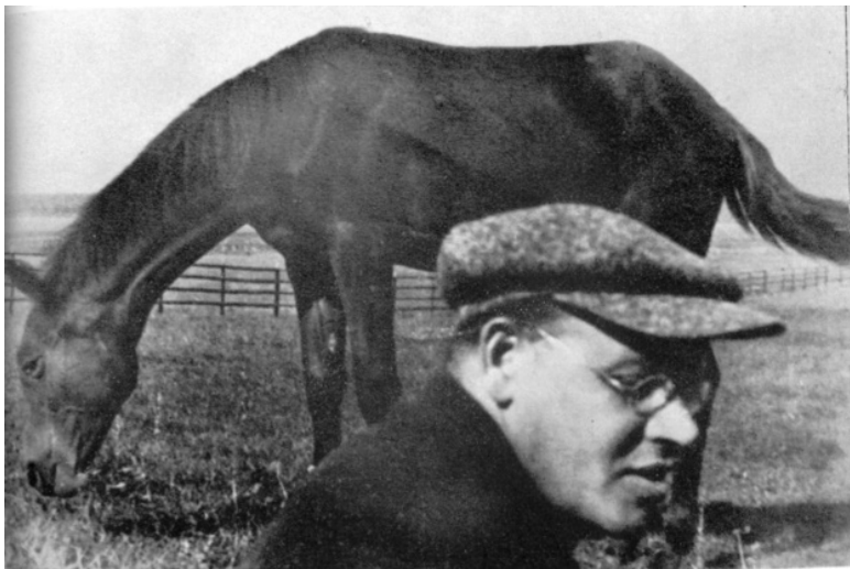
Илл. 11. Молоденово, 1931 год

Разочарование Бабеля из-за терний на пути становления полностью независимым профессиональным писателем усиливалось необходимостью выполнять подработки и выторговывать у редакторов авансы за неоконченные или не подлежащие публикации рассказы. Приходилось придерживаться идеологически правильного поведения, чтобы получить разрешение на выезд за границу, а также деньги на жизнь и семью. В сочетании с астматическими заболеваниями и дорогостоящим лечением зубов это мешало писательскому развитию и ставило его на своего рода беговую дорожку, с ко-