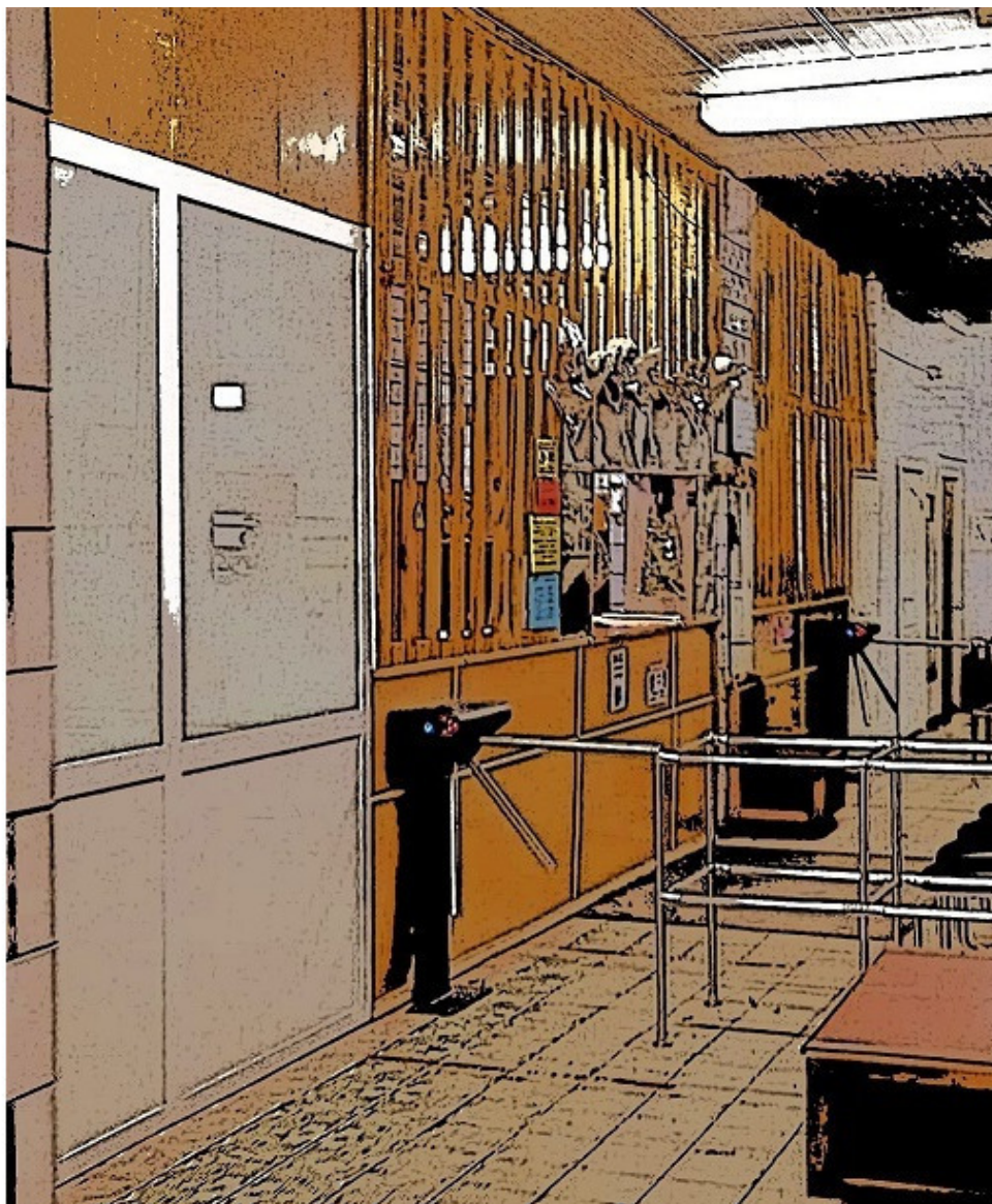
Проход в мужские разряды