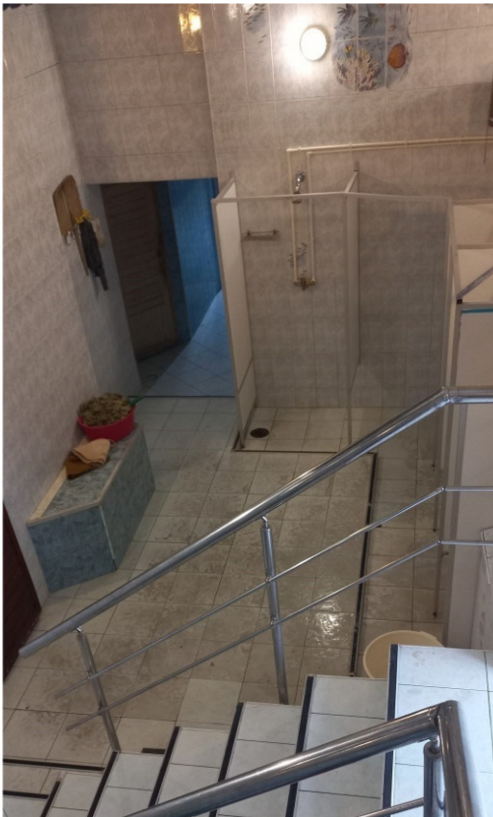
Зальчик для помыться