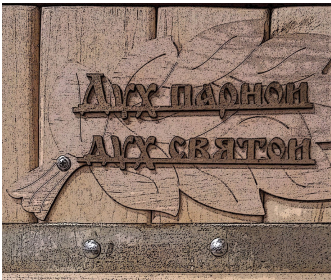
Надпись на дверях парилки

В дальнейшем Кеша нашел нетривиальный выход и, может быть, когда-нибудь расскажет вам и о нем.