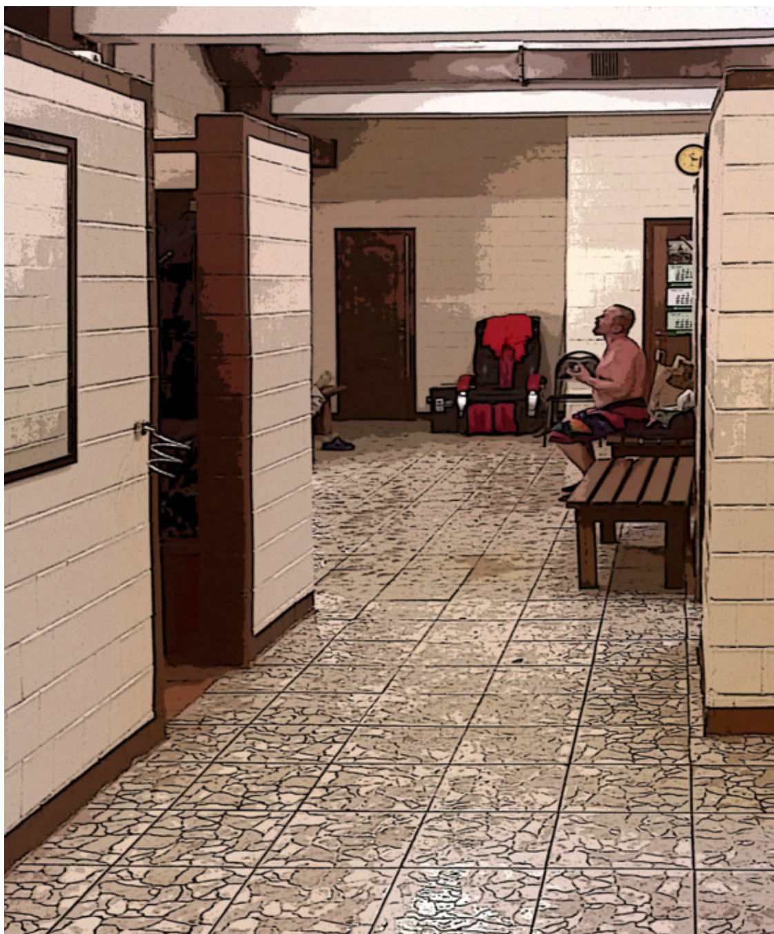
Зал отдыха. Гость просит у банника: – легкого пара!

«Ну да ладно, приживусь, притрусусь, так сказать», – решил Иннокентий.