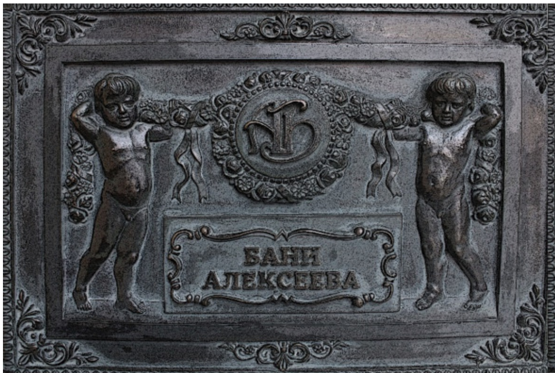
Доска-табличка на здании Алексеевских бань

герою эти обстоятельства не помешали быстро добраться до места, так как дорога за городом проще, чем утыканная светофорами трасса столицы.