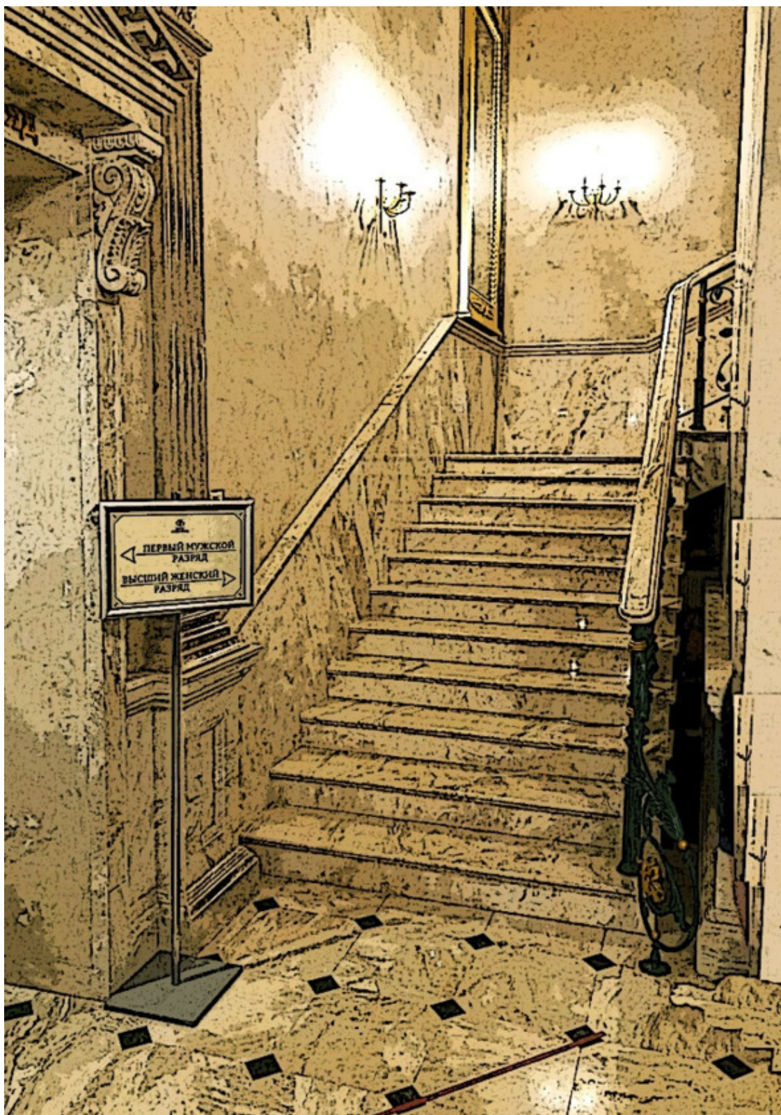
Лестница в высший женский разряд