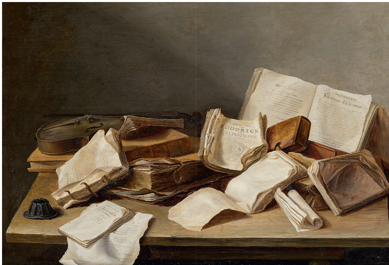
Я.Д. де Хем. Натюрморт с книгами и скрипкой