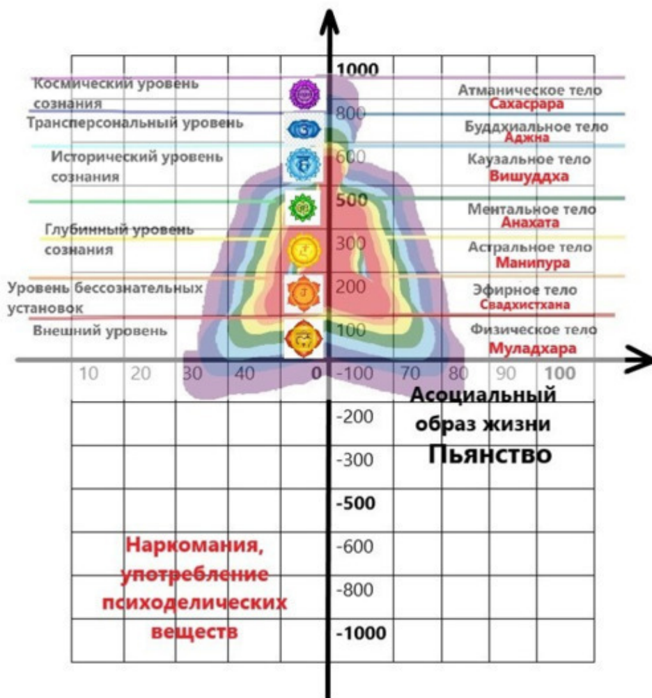
Графическая картография сознания

Я разработал также графическую картографию сознания , цель которой показать, на каком уровне находится человек или общество. Так как психосфера тесно взаимодействует с биосферой и ноосферой, если уровень развития психосферы низкий, то это отрицательно сказывается на других сферах мироустройства. Далее я приведу и кратко опишу уровни сознания, о которых говорил выше.