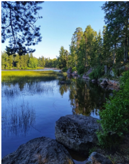
В парке Монрепо

на домах в стиле северный модерн, уютные балкончики, мощёные улочки, небольшие скульптуры. Именно они делают Выборг таким самобытным. Это не тот город, который можно пробежать за пару часов. Выборг – это про атмосферу, про выпить кофе с выборгским кренделем, полюбоваться городом со смотровой площадки башни Святого Олафа, посидеть на лавочке в парке Монрепо, созерцая кувшинки в пруду.