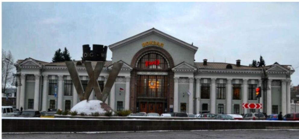
Железнодорожный вокзал Выборга

Из Санкт-Петербурга удобно ехать на «Ласточке» с Финляндского вокзала. Оттуда же отправляется обычная электричка, но идёт она в 2 раза дольше, а стоит примерно столько же. Поэтому смысла ехать на ней нет.