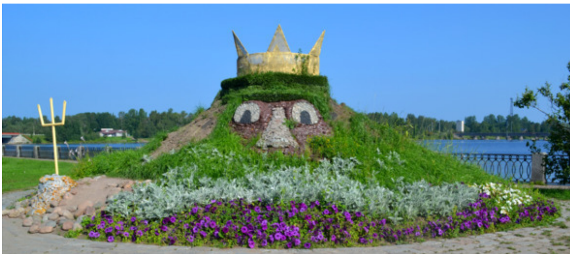
Клумба на набережной залива Салакка-Лахти

В 2000-х годах часть набережной была «откололась» в самостоятельную набережную 30-го Гвардейского Корпуса. Штаб этого корпуса располагался в стоящем рядом доходном доме Хакмана.