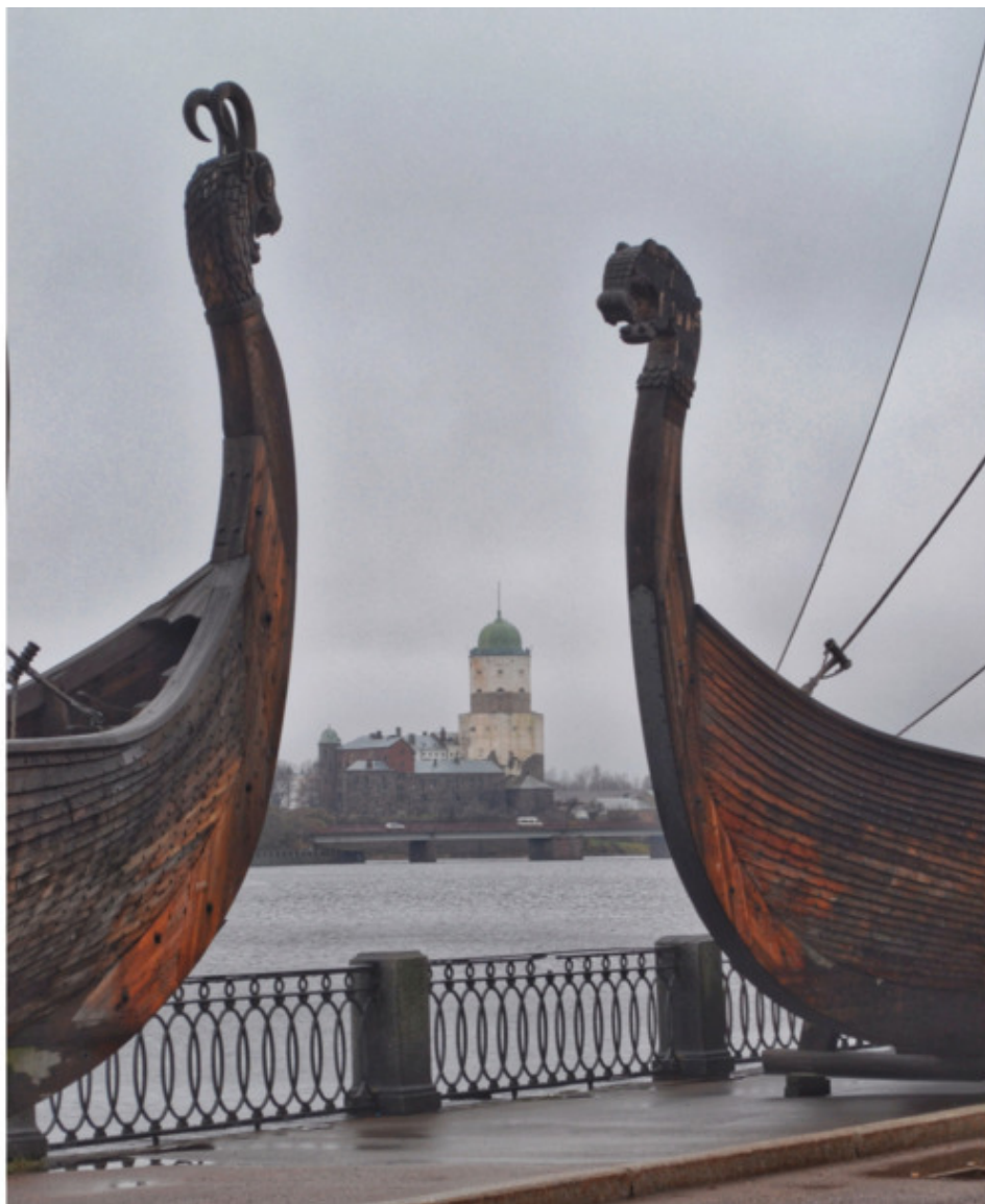
На набережной залива Салакка-Лахти

Поэтому несмотря на то, что Выборг – отличный вариант для путешествий на выходные, отправляясь туда в субботу или воскресенье, будьте морально готовы встретить множество единомышленников. Или выбирайте для поездки будний день.