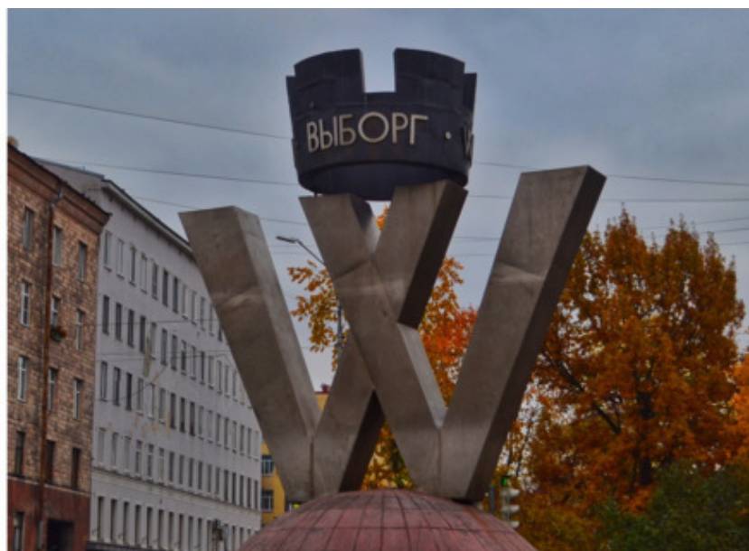
Въездной знак «Выборг»

До 1939 года Выборг был вторым по величине и значимости в Финляндии, спокойная жизнь в городе шла своим чередом. Зимняя война положила этому конец. Поражение финнов привело к тому, что Выборг вошел в состав Карело-Финской ССР.