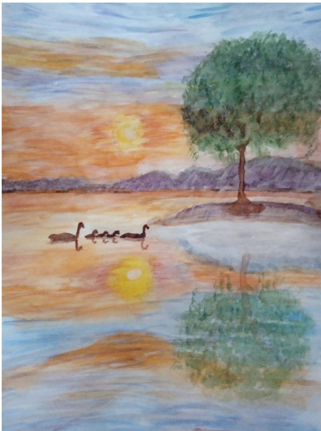
Художник: Людмила Васильева, д. Адам Глазовского района.