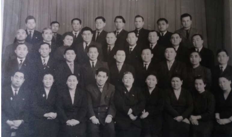
Республиканский семинар председателей исполкомов городских и районных советов депутатов трудящихся Киргизской ССР 1.12.63г.