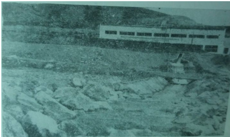
«Он-Арча» насосдук станциясы. Бул насос секундасына 1300 литр суу чыгарат.

Райондун сугат аймактарынын кеңейиши менен бирге айыл чарбасынын дүн продукциясы өсүүдө.