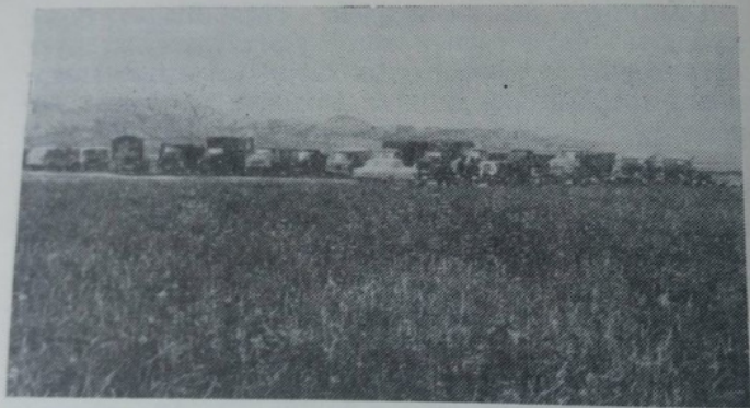
Карл Маркс атындагы колхоздо чөп чабуу алдында семинар өткөрүү.

Партиянын агрардык саясатынын көрөгөчтүгү жана акылмандуулугу бардык райондордой эле биздин райондун мисалынан да өзгөчө күч менен көрүндү. Партия менен өкмөт айыл чарбасынын материалдык-техникалык базасын чындоо үчүн орчундуу чараларды көрдү. Жыл сайын жаңы тракторлор, автомашиналар, айыл чарба техникалары, минералдык жер семирткичтер берилүүдө. Электр энергиясын пайдалануу толук чечилди. Мына ушунун бардыгы айыл чарба өндүрүшүн жогорулатуу үчүн бекем негиз түзүүгө жана жаратылыштын стихиялык күчтөрүнөн анын көз карандылыгын азайтууга толук шарт тузду.