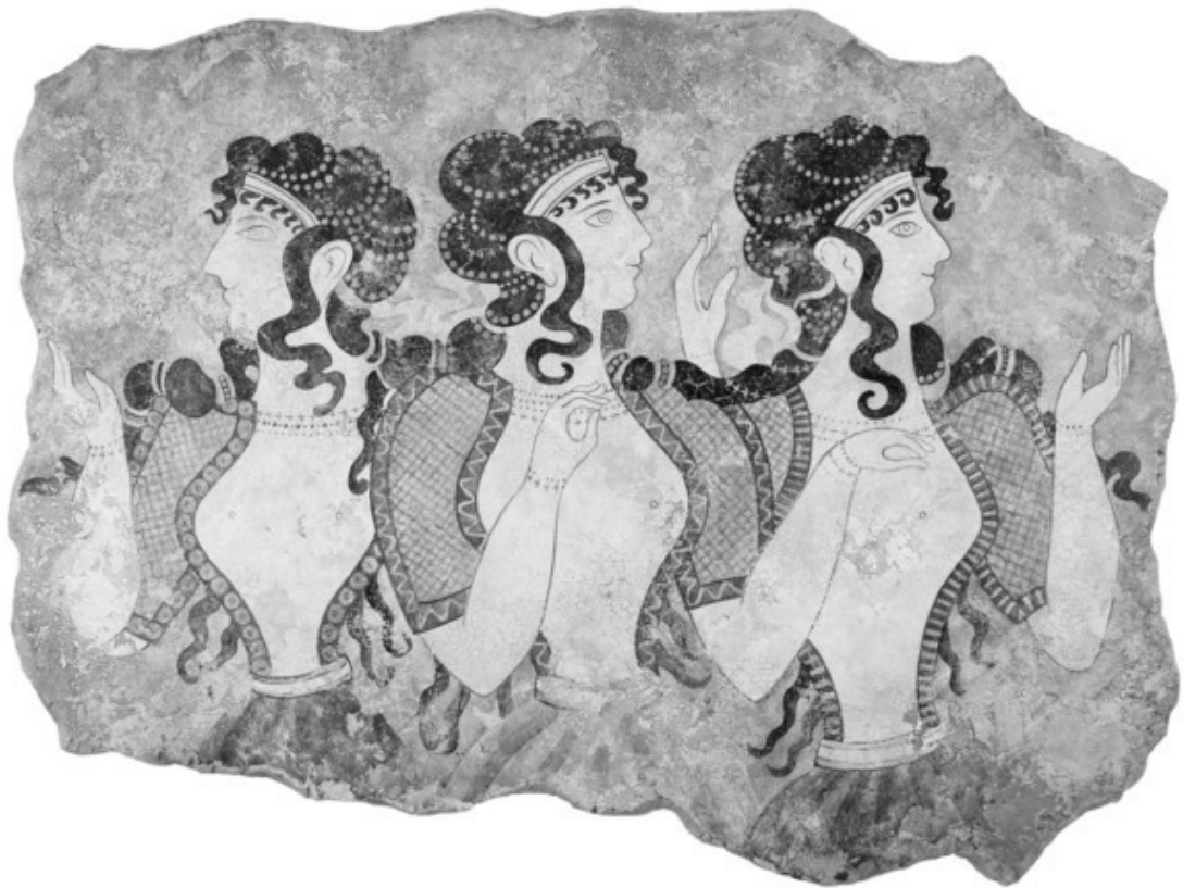
КРИТСКИЕ ЖЕНЩИНЫ. ФРЕСКА