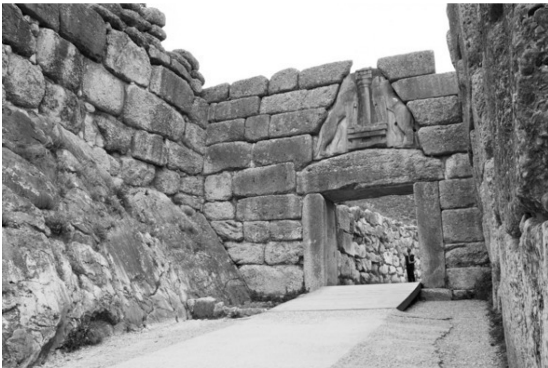
МИКЕНЫ. ЛЬВИНЫЕ ВОРОТА