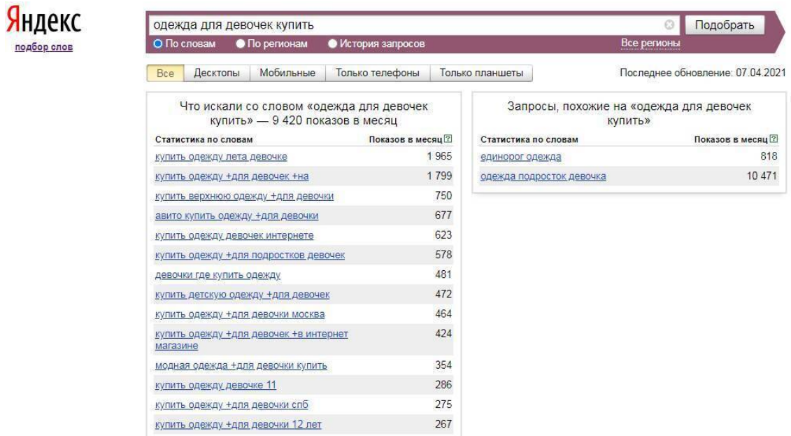
Рисунок 2. Планировщик ключевых слов