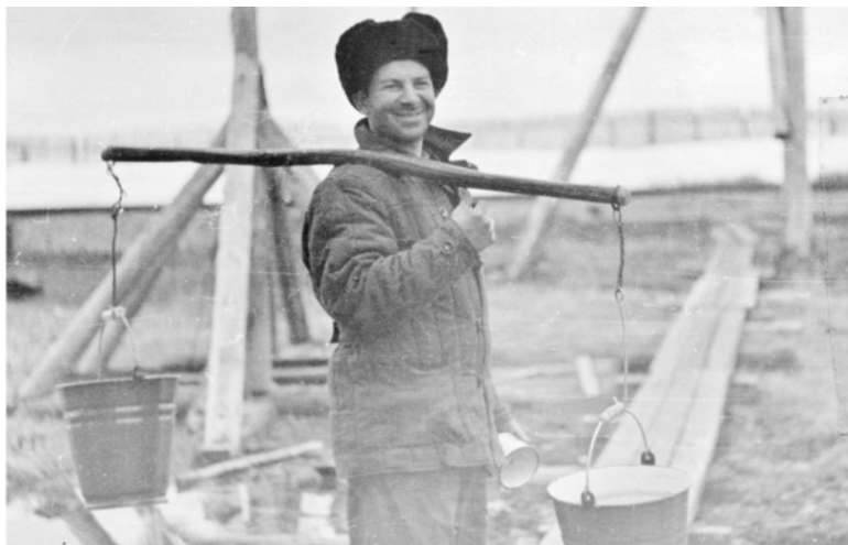
А. Столин. Дежурство на кухне. 1969 г., ст. Тундра

Читатель подумает, что речь пойдёт о чём-то аморальном; бог с ним, с таким читателем, хотя элемент аморальности в повести, конечно, будет: дело было в сугубо мужской не самой нежной кампании, место действия – участок ж.д. в районе симпатичной речки Далдыкан; как там бы сказали – на Далдыкане. Картина вполне обычная для того периода работы: Жаркий солнечный день ( t > 30 градусов С – это в Норильске!!). Громко трещит ЖЭСка и четыре шпуги, человек 15 заняты работой.