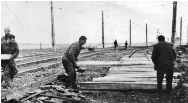
Укладка запасного пути для разъезда встречных составов: С. Грачёв, В. Бостанджиян, И.Ф.Щёголев