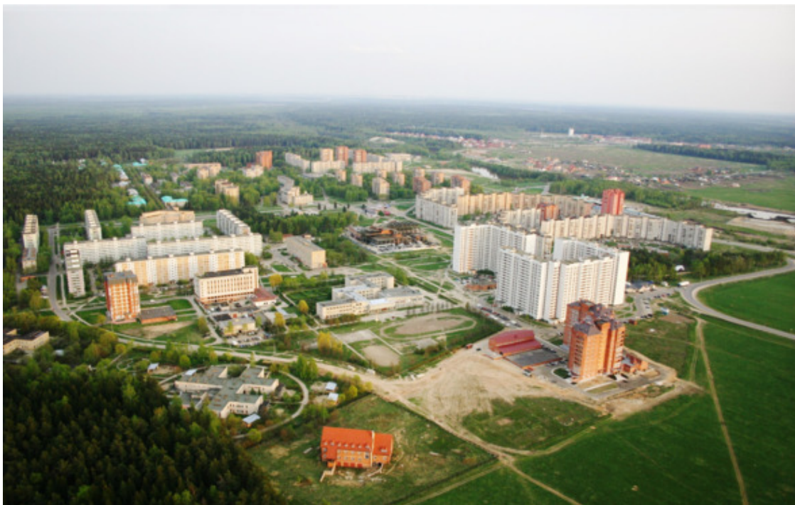
Черноголовка. 80-е. 3