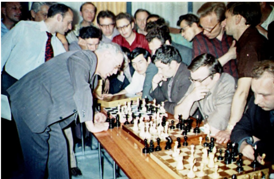
Сеанс одновременной игры между многократным чемпионом мира Ботвинником М. М. и черноголовцами