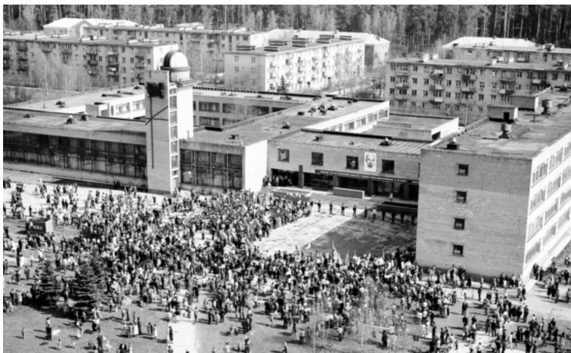
Первомайская демонстрация на площади школы №82