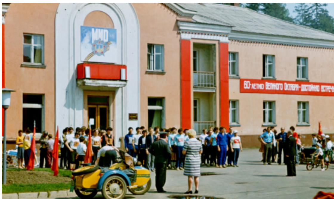
Построение у гостиницы на Первой улице перед первомайским забегом

Тогда посёлок оканчивался за нашими домами. Дома быта (КБО) и домов по улице Центральная ещё не было. Там были очистные сооружения. Зимой мы ходили на горку у гастронома. Катались на картонках по ледяной, подозреваю, заливавшейся кем-то из старшего поколения дорожке с выкатом почти на проезжую часть. По вечерам жизнь на этой горке буквально кипела. А в самом гастрономе, у левой его стены, где был буфет, можно было купить сок: абрикосовый, виноградный или томатный, который наливали из стеклянных конических сосудов, похожих на огромные морковки с краником и марципан или хотя бы булочку с изюмом. В молочном отделе, который был в правой части гастронома, мы сдавали принесённые бутылки из-под кефира и сметаны, (молоко в полулитровых тетраэдрических пакетах родителям выдавали на работе за вредность) и, конечно, доплатив какую-то сумму деньгами, покупали то, что наказывали родители. Летом гоняли на великах и сами по себе по всему посёлку, и участвуя в соревнованиях 9 мая по трассе на Первой улице.