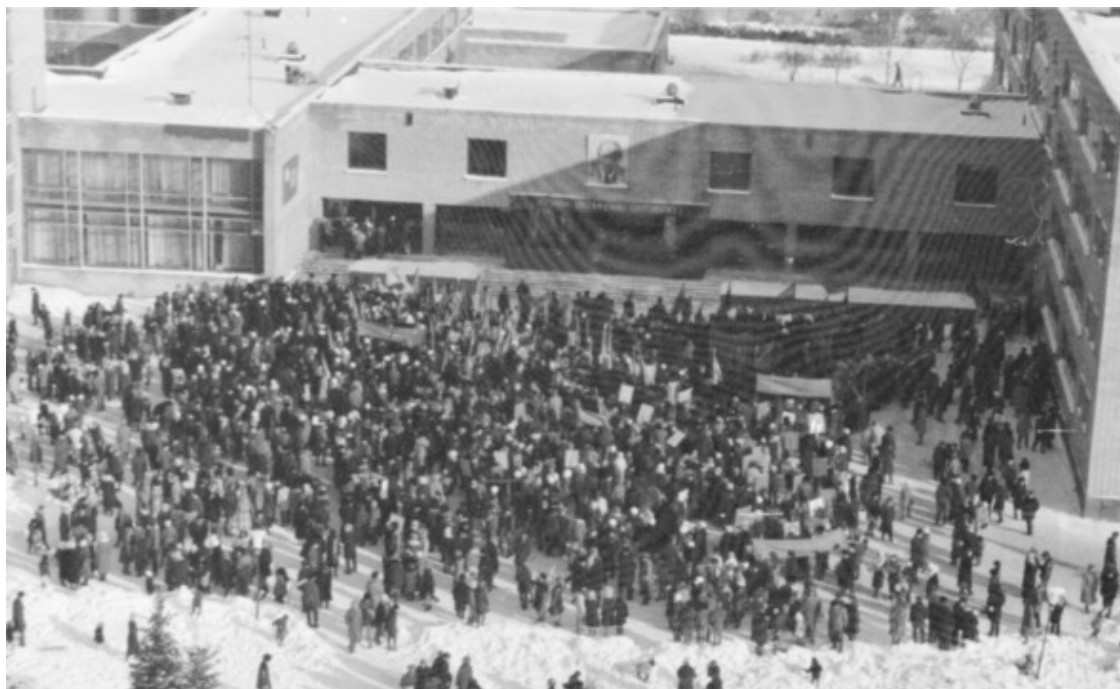
Праздничная демонстрация 7 ноября на площади школы №82