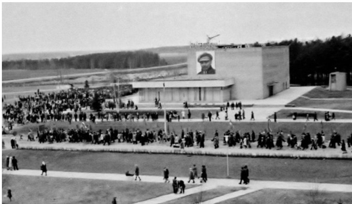
Кинотеатр в Черноголовке. 70-е годы