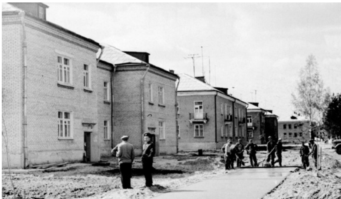
Строительство Первой улицы

Ещё было: два общежития – наша пятиэтажка 1968 года, буквально в колосившемся поле, и маленькая общага, получившая позднее название армянской, ещё – казармы стройбата (он всё и строил на поселке, кроме блочных домов) с музыкой утром и вечером, за глухой стеной – от строительной столовой до леса, ещё – милиция и Дом ученых 1967 года, школа в конце Первой, гастроном – посредине Первой.