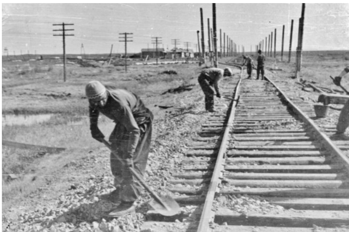
Засыпка ж. д. полотна после балластёра

Меня интересовало как эту самую северную в мире дорогу строили зэки. Мастер сказал, что рельсы укладывали прямо на снег, он зимой под ветром становился твердым как камень, а летом правили, подсыпали щебенку. Вот поэтому наша работа и называлась подъемкой. Надо было нарастить толщину слоя балласта, иногда довольно значительно, кажется до 30 см и выше. Это позволяло сохранять вечную мерзлоту под балластом – хорошим теплоизолятором.