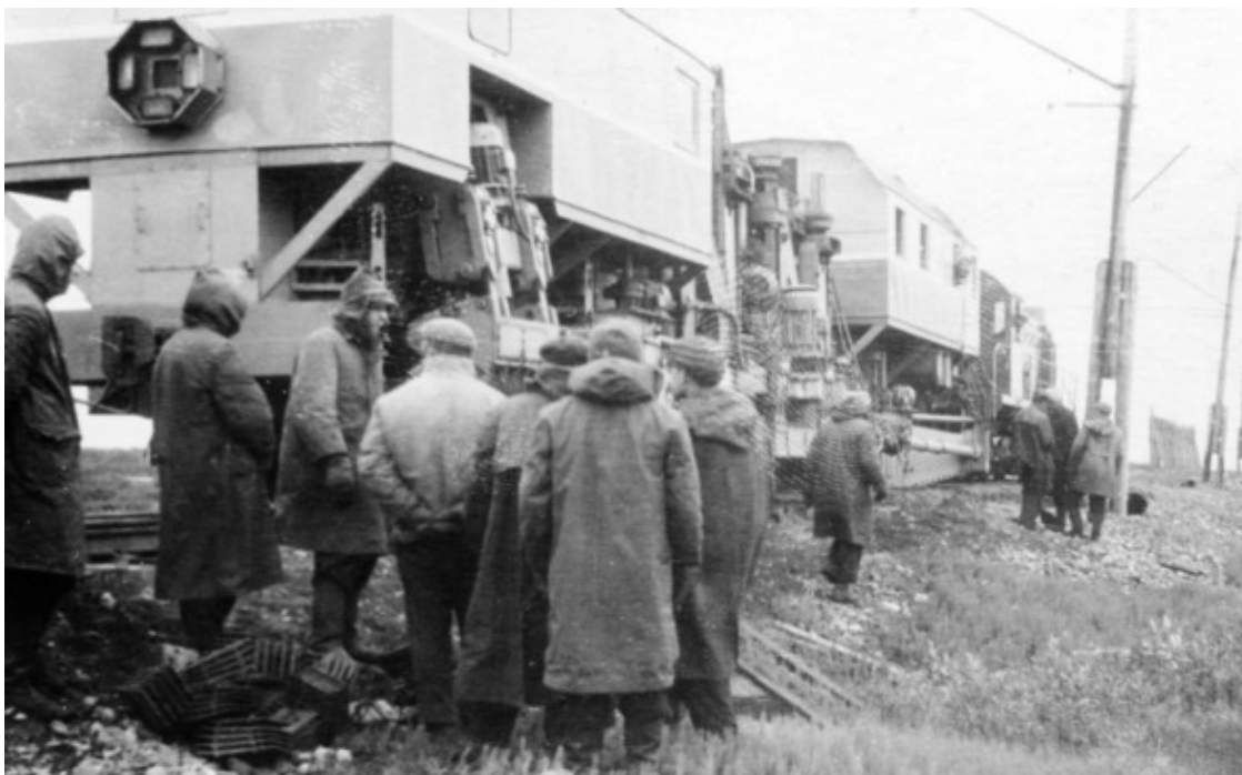
«Балластёр» – Мощная железнодорожная машина с электромагнитами

« Балластёр » – на бригадном сленге «шелешпер». Мощная железнодорожная машина. Электромагнитами вытаскивает и кладёт на грунт рельсы вместе с пришитыми шпалами. Скорость извлечения равна скорости движения балластёра по рельсам.