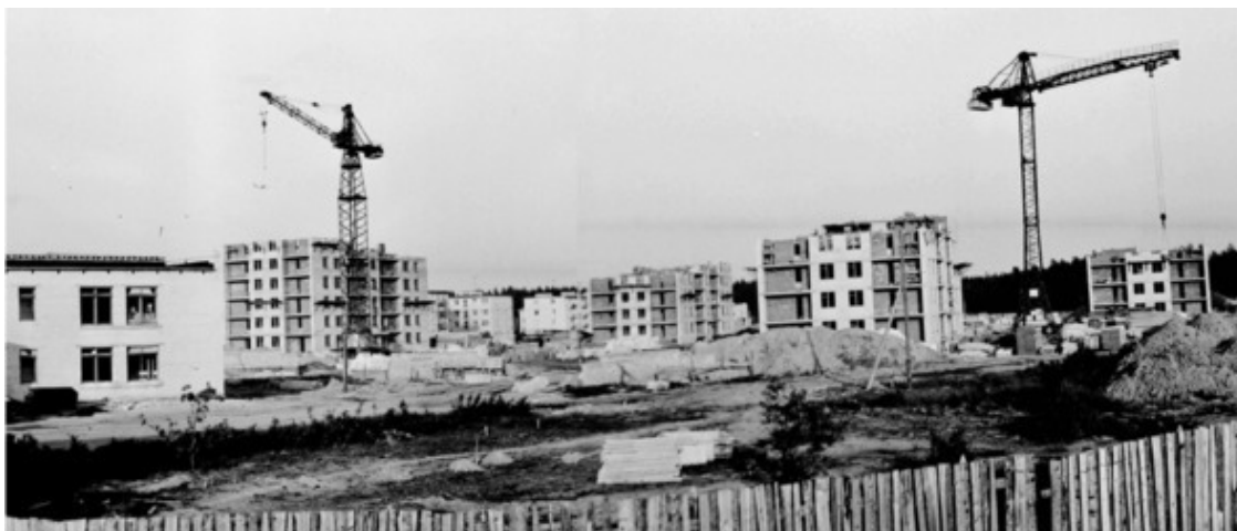
Строительство девятиэтажных домов на Первой улице