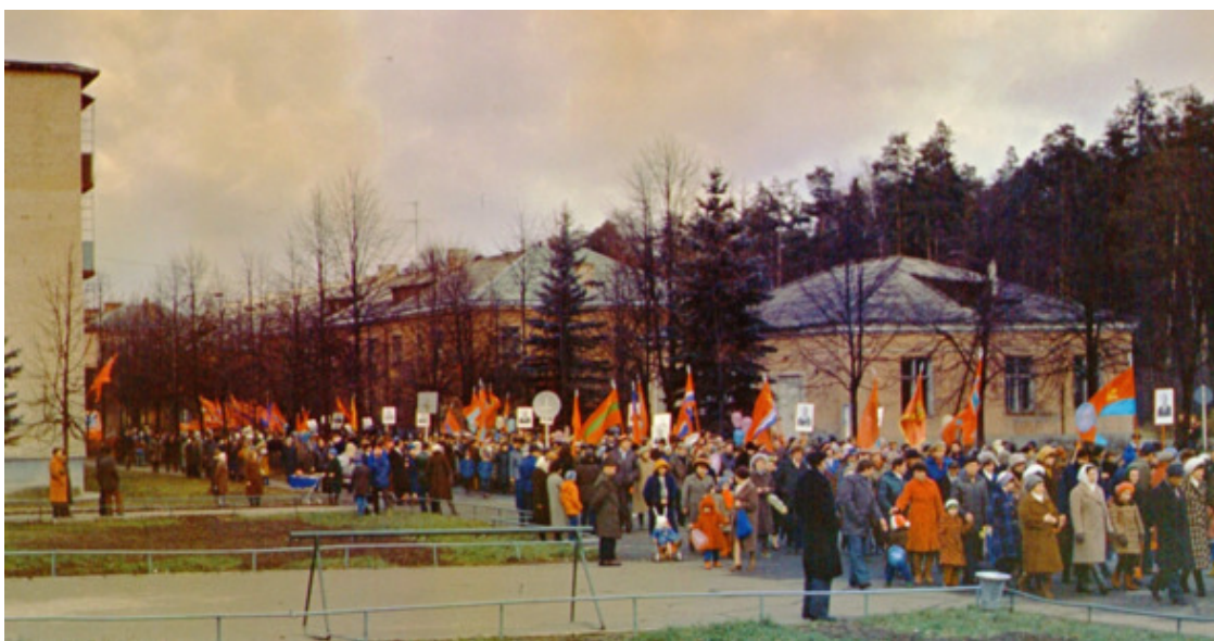
Праздничная майская демонстрация по Первой улице к школе №82

Баскетбольная и гимнастическая площадка, так же, как и футбольный стадион – места паломничества спортсменов всех возрастов. Пятёрка – пятикилометровая кольцевая трасса в лесу. Её можно бежать с аппендиксом, а можно без него, и тогда это будет где-то на километр меньше. Полигон – лиственная часть ближайшего к Черноголовке леса, куда мы ходили за белыми, подосиновиками, лисичками и другими грибами, где на самом деле находится военный полигон, на котором в военные годы испытывали авиабомбы, откуда и такое большое количество воронок и от которого, в своё время, был отрезан кусок территории для образования Черноголовки. Казематы – хвойная часть леса, куда мы ходили за чернушками и свинушками, где располагались тогда три действующих подземных каземата лаборатории горения и взрыва ОИХФ, где проводили соответствующие исследования. Демонстрация – шествие с флагами 9 мая к обелиску погибшим воинам в д. Черноголовка и 7 ноября торжественный сбор у школы №82. Вместе с Новым годом – это были самые радостные праздники. И многое, и многое ещё.