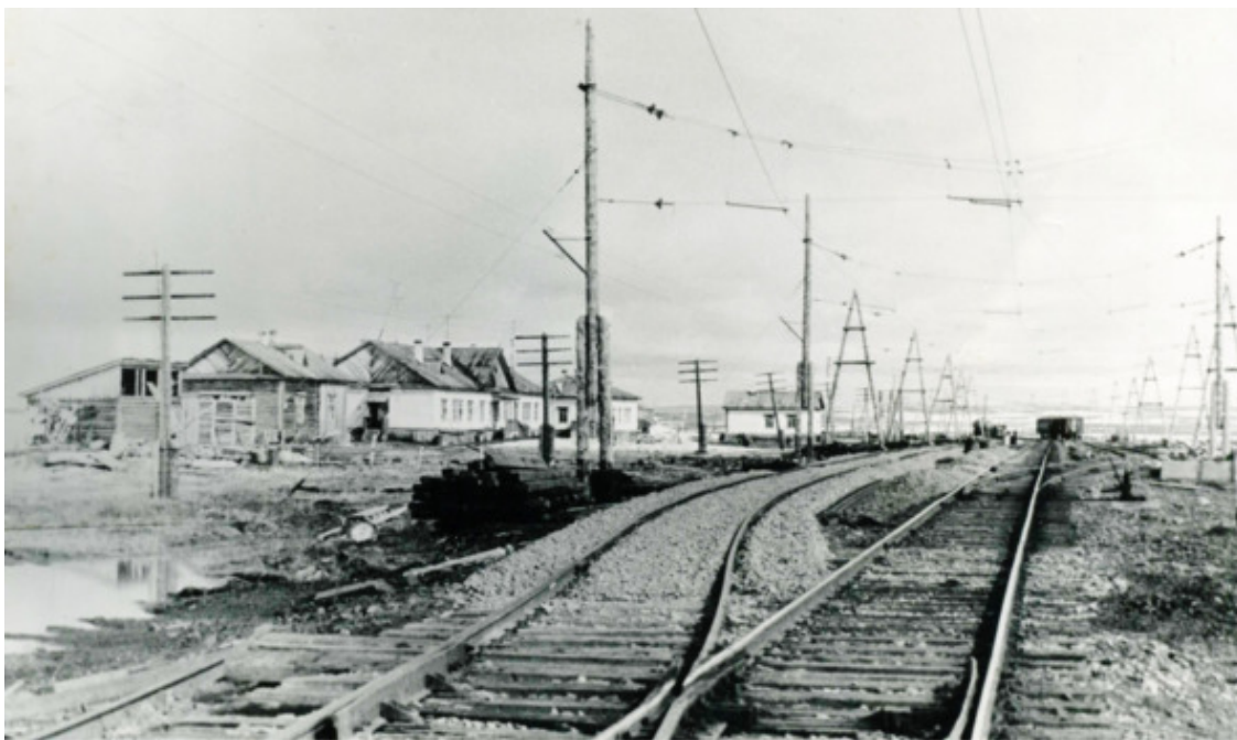
Станция «Тундра». 1969 г.