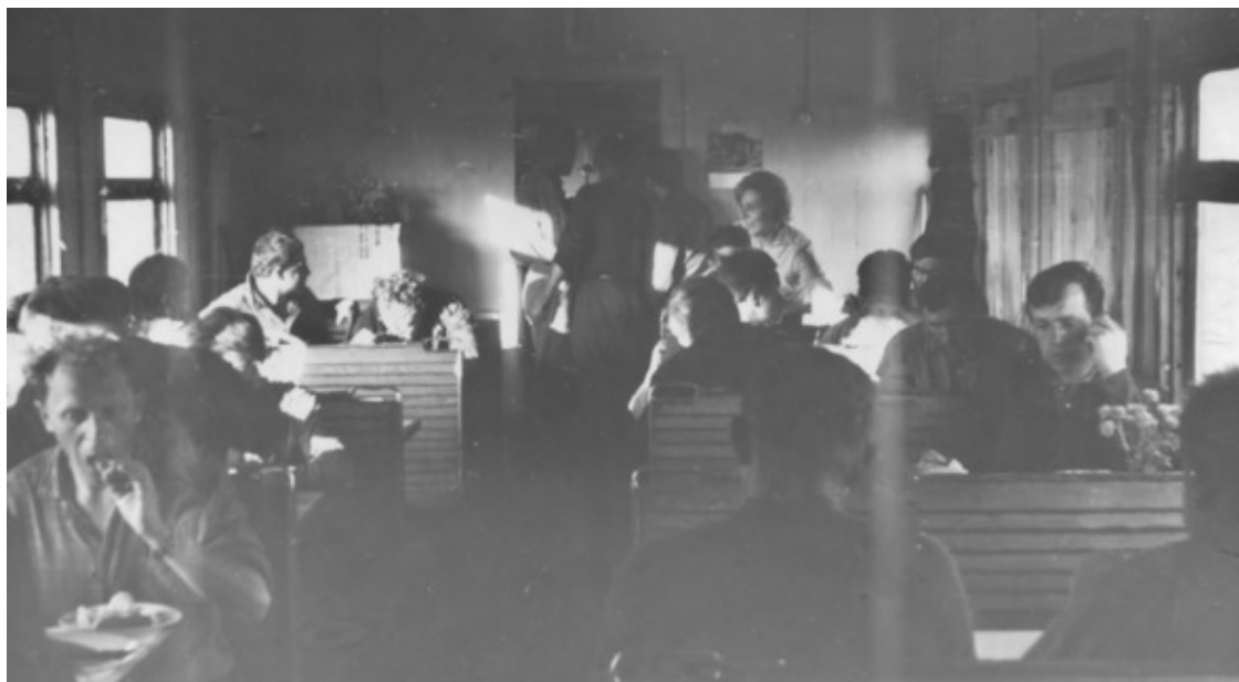
Ужин в вагоне ресторане – самые приятные часы для общения и отдыха

Станция «Тундра» – это небольшой поселок из шести деревянных домов и магазина.