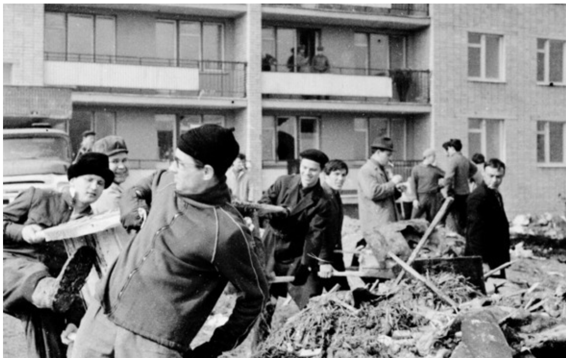
Субботник по благоустройству Черноголовки