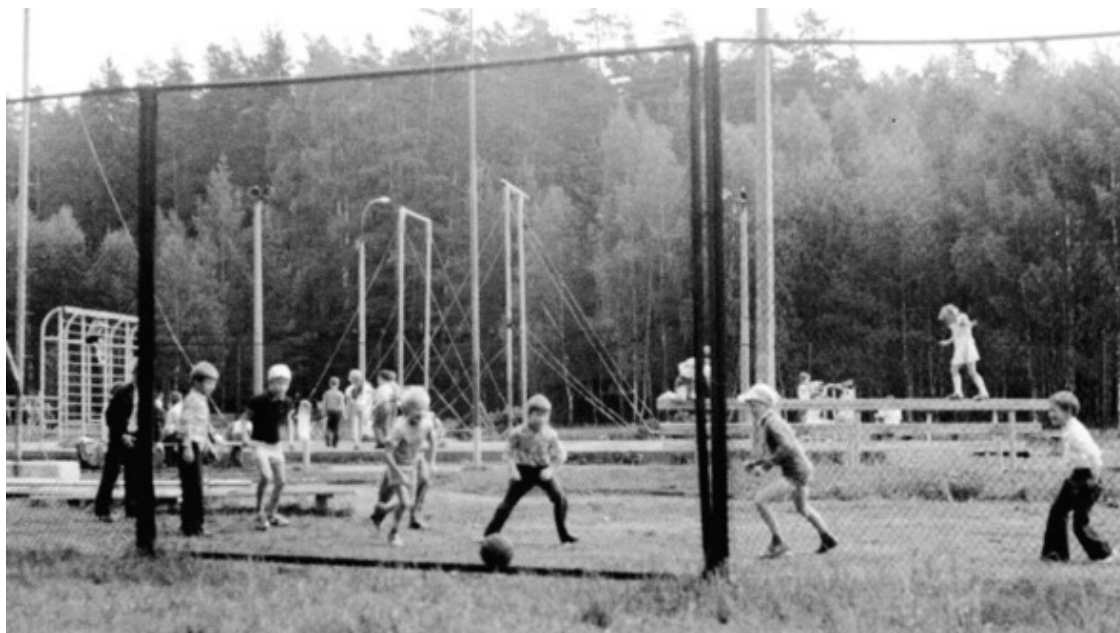
Спортивная площадка у Ближнего озера, где всегда было полно детворы

Ещё, конечно, не может не обратить на себя внимание хитросплетение улиц на карте Черноголовки. Это мы, местные жители, которые оперируют устоявшимися названиями, как-то: Дом быта, Старый рынок, Скобки, Спорткомплекс, Дом Учёных и прочее, – обозначающими район города, понимаем, что и где находится. Лидером среди топонимов, конечно, является «Колбаса». Это длинная «хрущёвка» с четырнадцатью подъездами. Улица Центральная, появившаяся вначале восьмидесятых, находится на окраине Черноголовки, а единственный многоэтажный район в Заречье, появившийся в конце нулевых годов, как бы в противовес старому городу, никоим образом не помогает ассоциировать эту улицу с центром города. Оригинальное расположение практически у всех улиц города, где они могут раздваиваться, как Первая или Лесная, или прерываться, а потом вновь появляться, где лидером, без сомнения, является Школьный бульвар. Попробуйте найти на карте дом №1 и №2 по этой улице. А также совместить в пространстве дом №13 и №14 по этой же улице. Сейчас с навигатором это легко, а вы попробуйте сделать это, выйдя на местность из автобуса, как это было ранее, и поспрашивать направление у местных. Весьма будете удивлены.