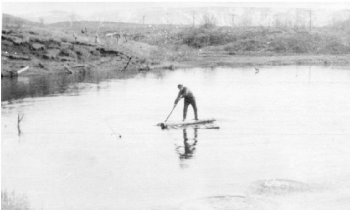
Озеро, из которого брали воду для умывания и чистки зубов

спины друг другу. Не помню, каким образом брился. А вот то, что брился, знаю точно: свидетельство тому фотокарточки и пара кадров фильма Саши Хруща.