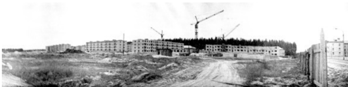
60-е года – строительство улицы Первая идёт полным ходом

Черноголовка вносила свой вклад в обороноспособность Державы, и мы в этом участвовали. А параллельно росло число кандидатов наук, все больше и больше защищалось докторских диссертаций. Появились «свои» членкоры, а потом и академики.