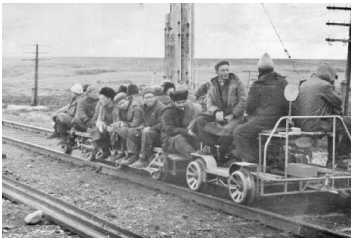
Едем на обед своим ходом, Тундра, 1970г.