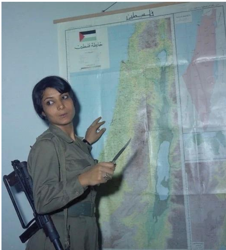
Рис. 1. Лейла Халед

Египетская нация – ее народ, ее элиты – так и не смирилась с этой позицией. Этот упорный отказ, в свою очередь, породил вторую волну восходящих движений, развер-