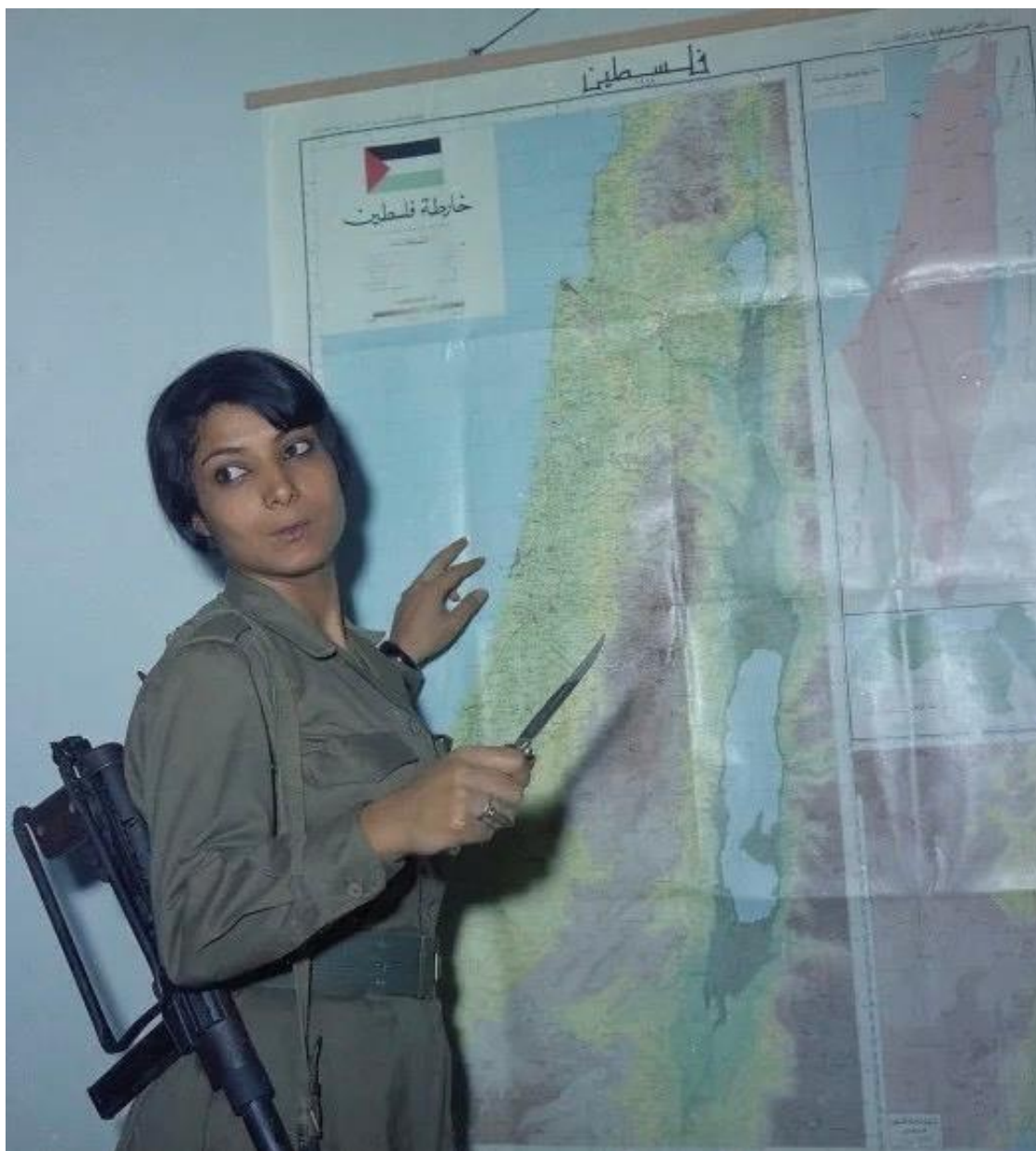
Рис. 1. Лейла Халед

Египетская нация – ее народ, ее элиты – так и не смирилась с этой позицией. Этот упорный отказ, в свою очередь, породил вторую волну восходящих движений, развернувшуюся в течение последующих полувека (1919-67 гг.). По сути, я рассматриваю этот период как непрерывную череду борьбы и крупных движений вперед. Он имел тройную цель: демократия, национальная независимость и социальный прогресс. Эти три цели – какими бы ограниченными и порой запутанными ни были их формулировки – были неотделимы одна от другой, и эта неотделимость была тождественна выражению последствий интеграции современного Египта в глобализированную капиталистическую/империалистическую систему того периода. При таком прочтении глава (1955-67 гг.) насеровской систематизации является не чем иным, как заключительной главой той длинной череды наступательной борьбы, которая началась с революции 1919-20 гг.