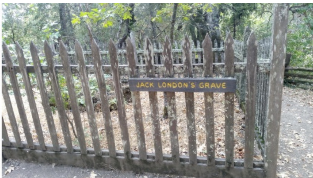
Могила Джека Лондона

Наконец, оглядываясь назад, на мозаичное панно прожитого и подборку написанного, рано или поздно задаешься вопросом: что же было важнее? Сама жизнь, выстроенная твоей волей, часто безрассудными решениями и поступками, неизбежными предательствами и утешительными высокими жертвами, или то, что и как о ней удалось рассказать в книгах? Для кого-то, кто через сто лет сможет открыть книгу и узнать о тебе, давно ушедшем в небытие, книги конечно важнее. Для себя и близких, всех, кто был рядом и умел жить со вкусом, время, потраченное на писание и издание книг, может, однако, показаться и украденным у жизни. У детей, у семьи, у любимых и у тех, кому нужна была твоя так и не оказанная помощь.