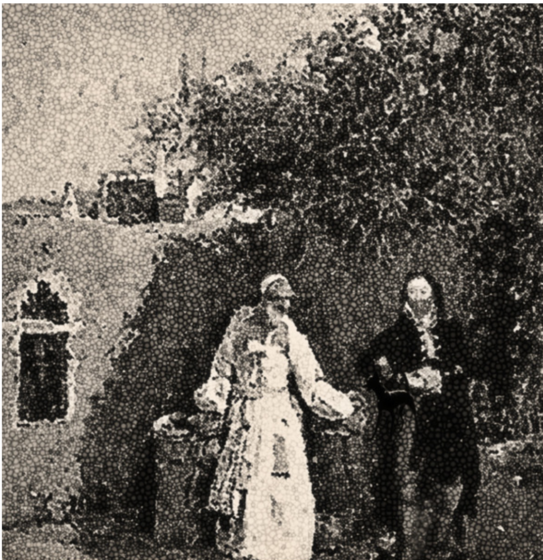
ДОН ГРЕГУАР И ГОНОРИС

И много ль должен я, скажите мне по чести? Запутался в расчетах хитрых я, Мне вспомнить надо, сколько ж должен я.