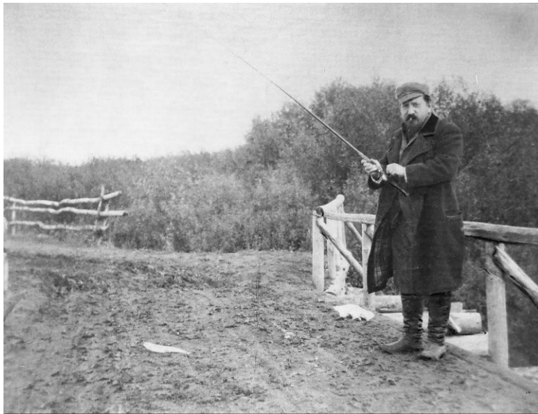
Серов на рыбной ловле. Фото.1905. (?)

Много стоило ему труда наладить дело с женской натурой. До его прихода в Школе живописи позировали только мужчины. Папа сам принял участие в поисках натурщиц. Ездил вместе с Н. П. Ульяновым по разным адресам, расспрашивал знакомых, от Школы были даны в газетах объявления. Уговаривая смущенных женщин позировать, Серов объяснял им, что художникам надо учиться, как учатся доктора, что бояться им нечего. «Вскоре, – пишет Ульянов, – эти новообращенные модели, позирующие на первом сеансе в сле-