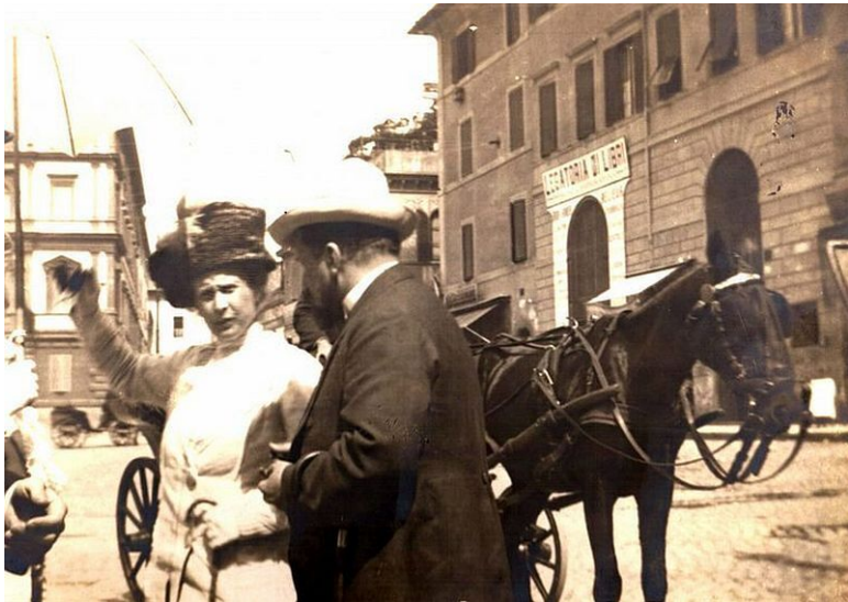
Серов с женой в Италии. Фото. 1911.(?)

Папа поселился в Москве потому, что боялся, что вырой петербургский климат был вреден для мамы, так как у нее были слабые легкие. Все письма к маме, начиная с юношеских лет, тогда еще к невесте (они были женихом и невестой в продолжение нескольких лет), и кончая письмами 1911 года, пронизаны заботой и вниманием.