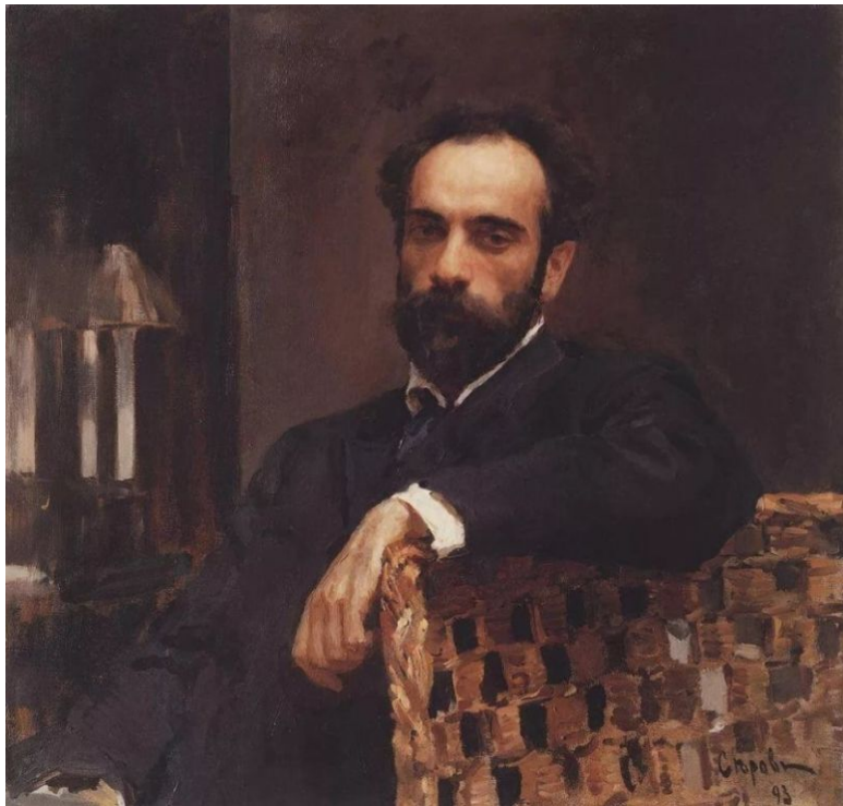
Портрет художника Левитана. 1893

Один из учеников долго рисовал одно интересное и очень женственное лицо модели и, думая, что работа ему удалась, с нетерпением ждал Валентина Александровича. Подошел Валентин Александрович, окинул взором рисунок да вдруг на вопрос ученика, похожа ли модель, коротко ответил: «Вы-