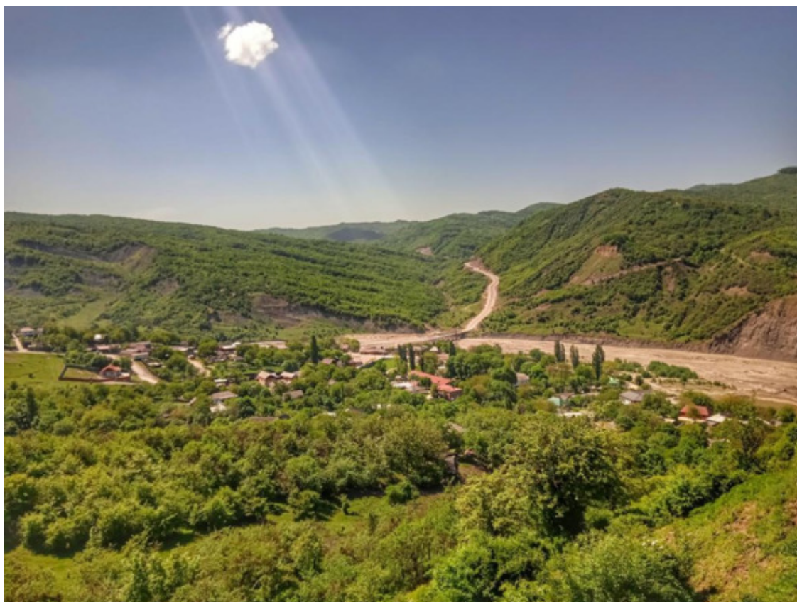
село Саясан... чеч Сесана