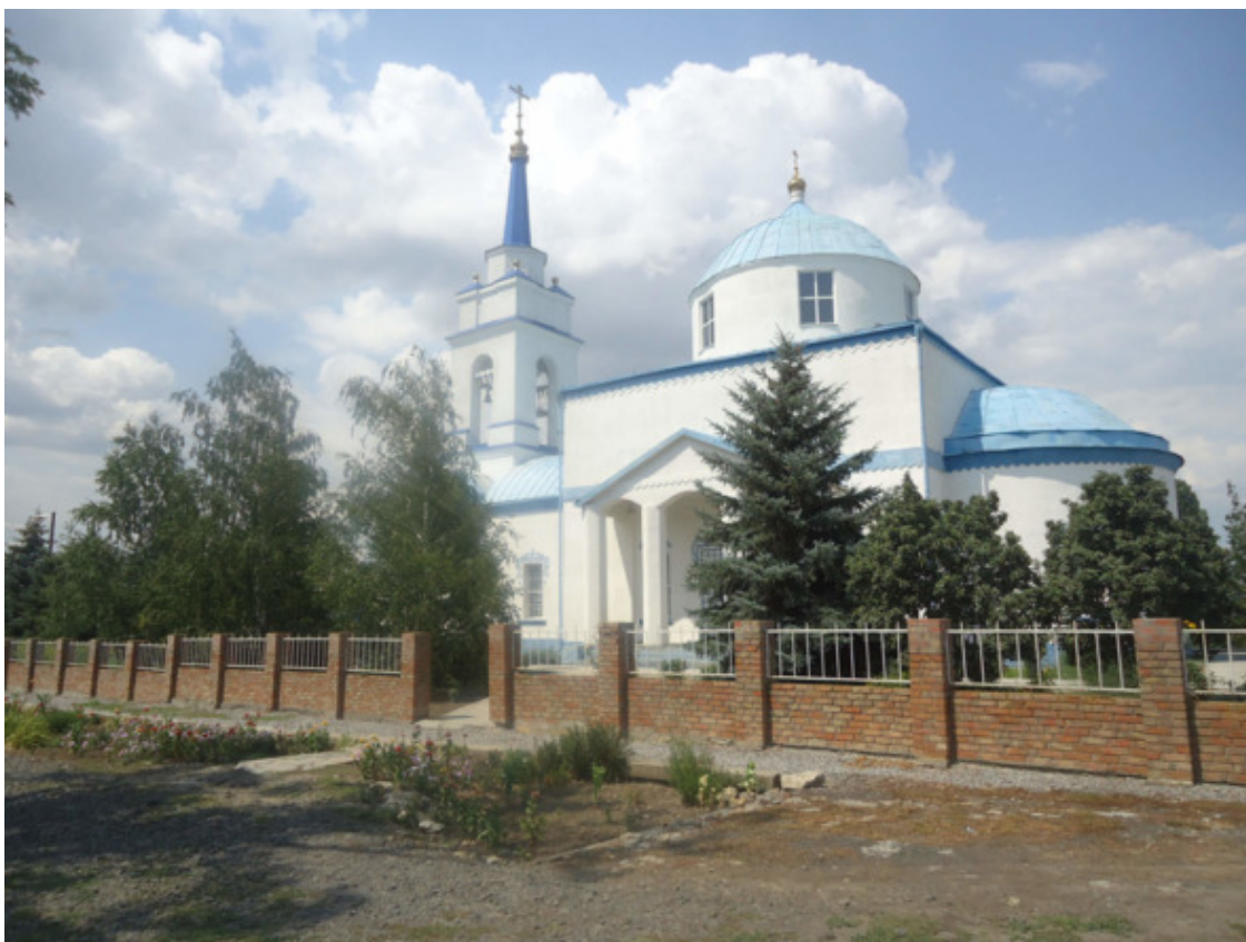
Храм в с. Анастасиевка Матвеево-Курганского района.

Живую душу укачала, Русь, на своих просторах, ты, И вот – она не запятнала Первоначальной чистоты. (Александр Блок)